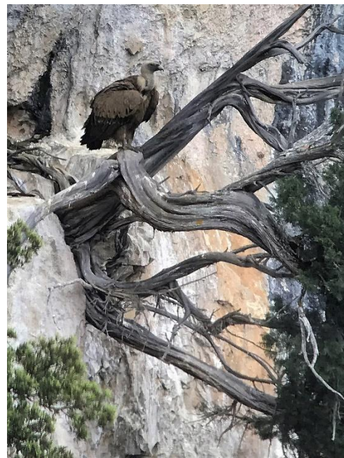
Gåsgam, talrik i Navarra.

Vi tittade på rovfåglar och bergsklättrare i bergstupen. Det var lite kyligt i vinden. Nästa stopp ägnades åt en annan spansk specialitet, svart stenskvätta, vilka visade upp sig fint. Efter lunch vid några picknickbord längs vägen och kaffestopp åkte vi till en plats där man lägger ut ben till lammgamen, Arten heter quebrantahueso på spanska, vilket kan översättas med, ”den som knäcker ben”. Här fanns det minst två lammgamar på plats och dessa visade upp sig på nära håll.