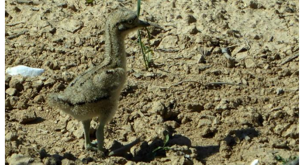
Unge av tjockfot.

än 4 stolta hanar och en hona. En flygande småtrapp på väldigt långt håll sågs av Gorka. Ett par tjockfot gick med sina ungar alldeles vid vägen.