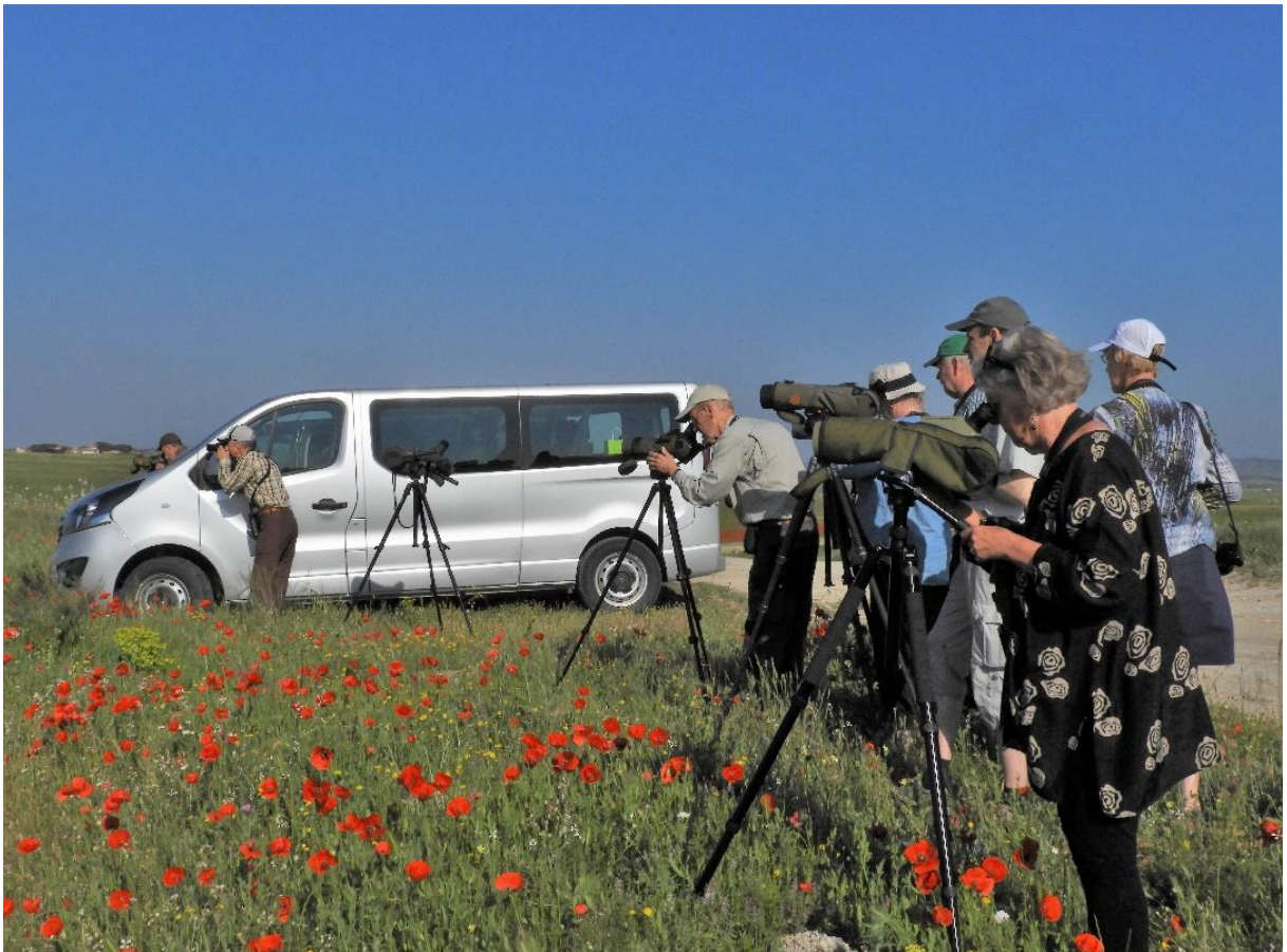
Underbar morgon i sällskap av stotrapp!