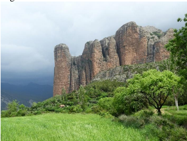
Bergen i Riglos

Dag 7: Vi gjorde en liten morgontur i lätt regn, och när det var dags för avfärd ösregnade det. Under färden mot Lleida slutade det dock att regna och vi kunde skåda utan problem på de inplanerade lokalerna. Ett längre stopp gjordes i de mäktiga bergen vid Riglos.