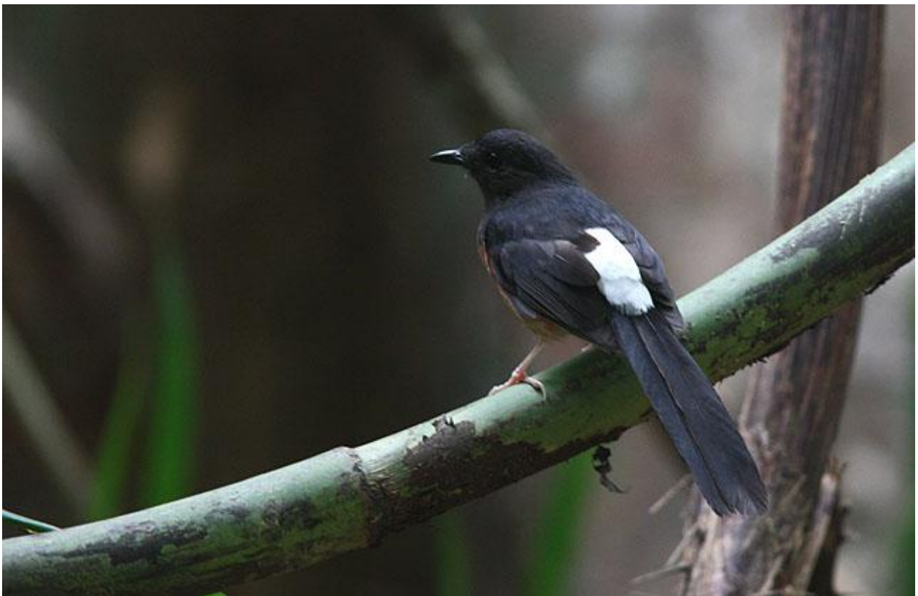
White-rumped Shama är en av många fina arter för Sydostasien.

Dag 11: Skådning under morgonen och förmiddagen i området närmast parkcentrat. Efter lunch buss till Kuala Lumpur. Vi gör inga seriösa skådarstopp längs vägen utan tar oss direkt till Kuala Lumpur International Airport. Nattflyg till Skandinavien.