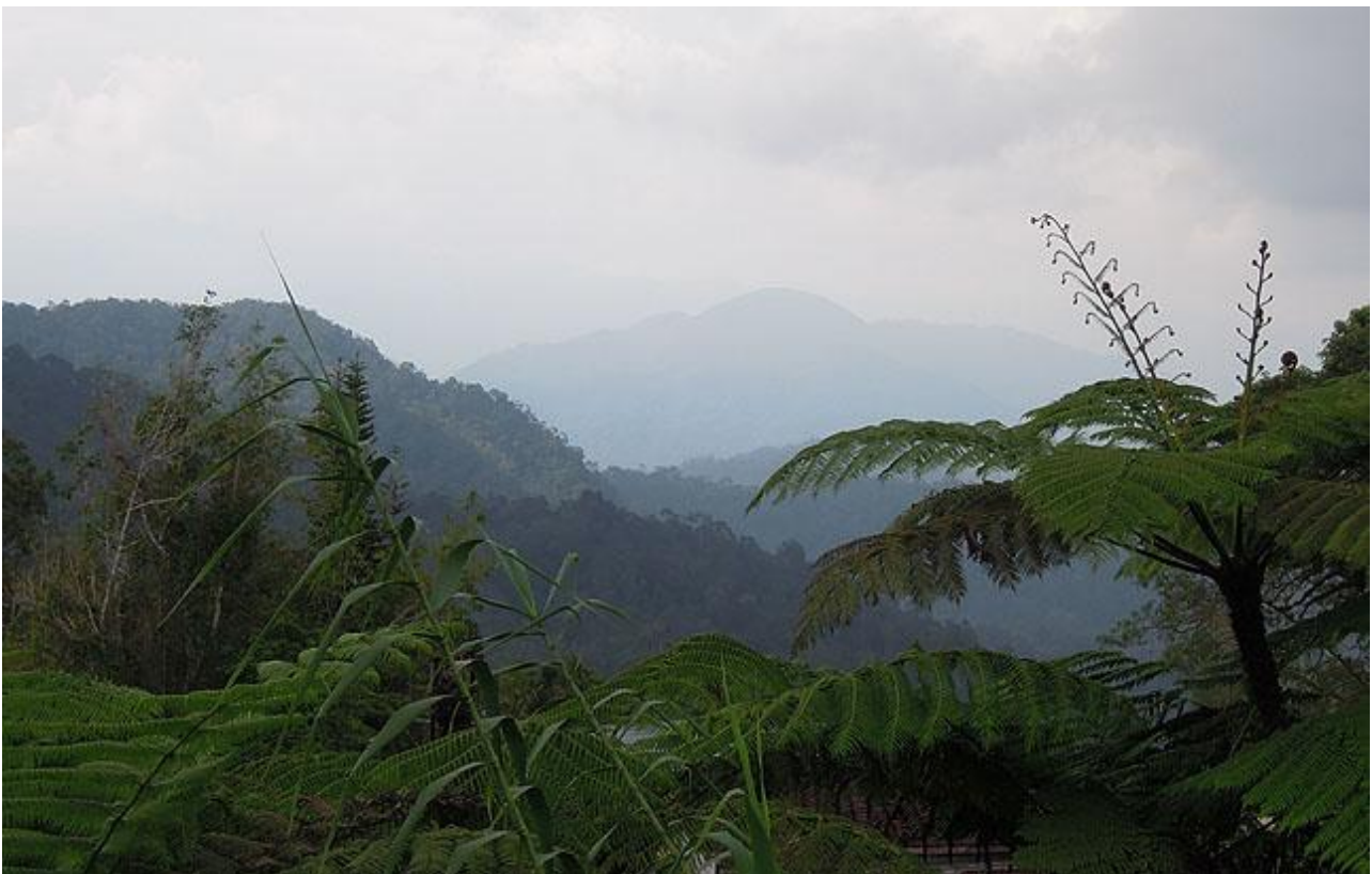
I Fraser's Hill möts vi av bergåsar. I förgrunden trädormbunkar.

Under andra halvan av eftermiddagen promenerar vi genom en gles lövskog med begränsad undervegetation. Collared Kingfisher brukar väsnas rätt friskt ifrån skogen och Lineated och Coppersmith Barbets pumpar på med sina monotona revirläten. I de öppnare markerna hittar vi bl a Olive-winged Bulbul och Ashy Tailorbird. Om vi spanar över skogen mot havet bör vi kunna räkna in hyfsade antal med brahminglador och är vi riktigt observanta bör vi även hitta White-bellied Sea-Eagle som även häckar i den närbelägna radiomasten. Små flockar med Pink-necked Green Pigeon brukar dra omkring och karaktäristiska läten från Peaceful Dove hörs. På kvällen äter gott vi på en fisk- och skaldjursrestaurang i grannbyn. Natt i Kuala Selangor.