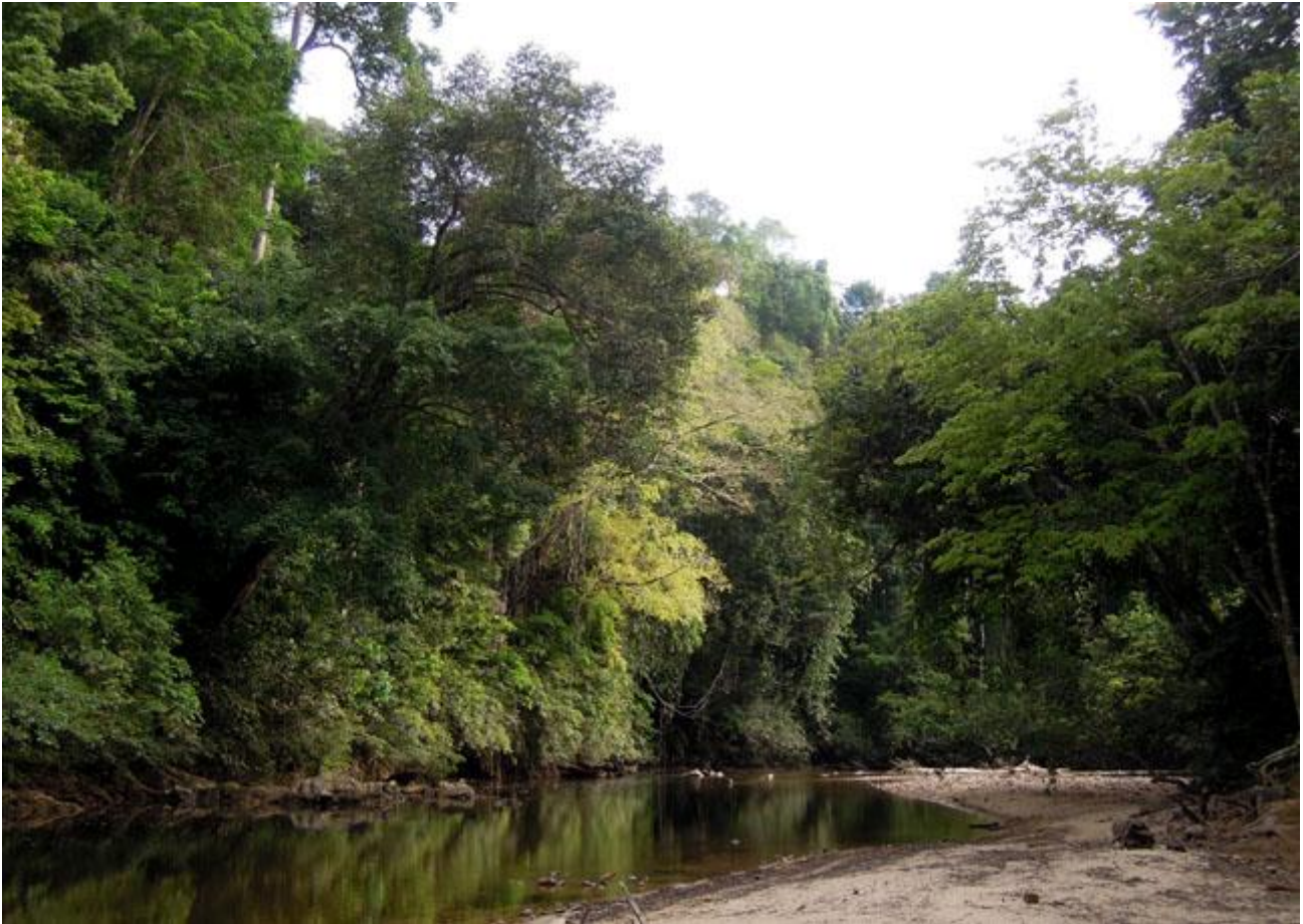
Biflödena till Tahan River i Taman Negara är verkligen jungfrulig mark och ger spännande skådning..

Dag 7–10: Vi har nu fyra heldagar framför oss som vi helt kommer att ägna Taman Negara. Över 300 arter är observerade i nationalparken. Flera av dessa kommer inte att komma vår väg då de har sin utbredning på de högre höjderna (norra delarna av Taman Negara) och vi rör oss hela tiden i lågländet av parken. Vi kan räkna med att få se ca 175 arter under vår vistelse här, med representer från många fågelgrupper; hägrar, rovfåglar, hönsfåglar, duvor, gökar, papegojor, kungsfiskare, hackspettar, Barbets, Broadbills, pittor, bulbyler, flugsnappare, Babbler, solfåglar, Flowerpeckers m m – artsammansättningen är imponerande. Vi kommer att hålla ett lugnt dagstempo men med långa dagar. Fågelaktiviteten är som bäst under morgnar och tidiga förmiddagar. Mitt på dagen är värmen påtaglig och fåglarna mera svårседda och då tar vi vanligen en siesta på ett par timmar. Framåt senare delen av eftermiddagen ökar fågelaktiviteten och vi kommer ofta att skåda fram till kvällsmaten (givetvis med tid för duschning innan maten). Flera kvällar gör vi sena nattexcursioner för att lyssna efter ugglor och Frogmouths. Vi ska försöka få in några av arterna i ficklampsskenet men detta är en nyckfull övning. Vi har dock stor chans att få höra flera arter.