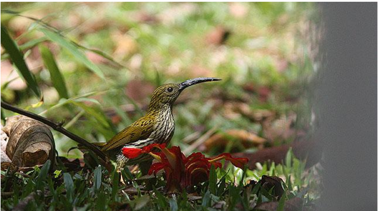
Streaked Spiderhunter är en av de arter vi träffar på i höglandet.

Framme vid hotellet i Fraser's Hill börjar skådningen redan vid parkeringen. Streaked Spiderhunter, Fire-tufted Barbet, Long-tailed Sibia och Black-throated Sunbird blir nya bekantskaper här. Efter att vi checkat in gör vi en kortare promenad för att hinna känna på lokalen lite innan mörkret kommer. Vi bör se en del typiska arter för området som Orange-bellied Leafbird, Grey-chinned Minivet, Javan Cuckooshrike, Little Cuckoo Dove, Golden Babbler och Everett's White-eye. Natt i Fraser's Hill.