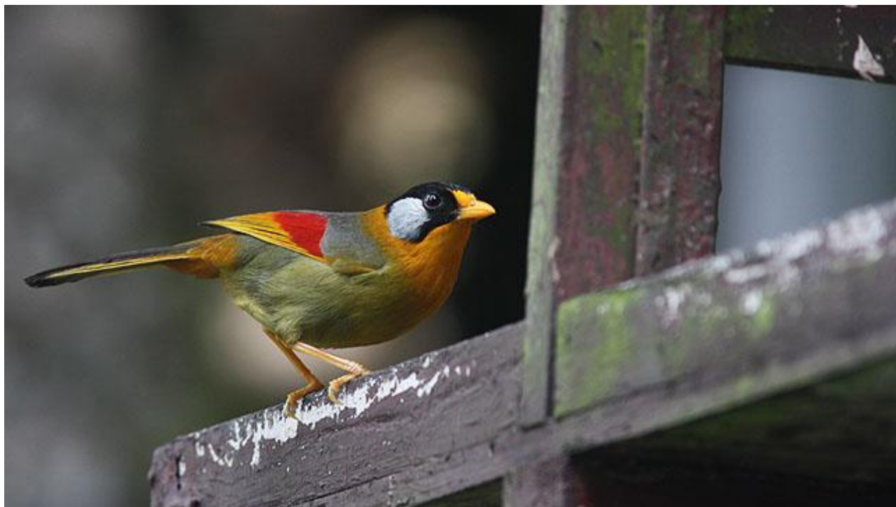
Silver-eared Mesia, en art vi tittar efter i Fraser's Hill.