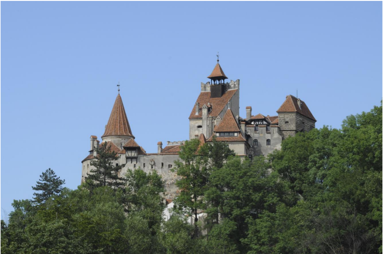
Slottet Bran, för evigt förknippat med greve Dracula.

Vi far vidare genom den pittoreska Homoroddalen med ett tilltalande, böljande landskap med ängsmarker. Här korsas ungersk och saxisk kulturtradition. Lyckas vi väl och vi ännu har tid gör vi en kort sightseeing i staden Brasovs äldsta delar innan vi checkar in på vårt hotell, granne med Rumäniens äldsta skola. Transylvanien styrdes av ungrarna – magyarerna – under medeltiden. Under 1100-talet bjöd deras kung Geza II in tyskspråkiga sachsare, vilka ända fram till 1989 års revolution satte sin prägel på områdets kultur och arkitektur. Här är byarna med sina speciella, fortifierade stenkyrkor mer än fotogeniska. Det kanske finaste exemplet är den sengotiska och protestantiska svarta kyrkan, med sin gothiska katedral och imponerande 4 000-pipiga kyrkoorgel.