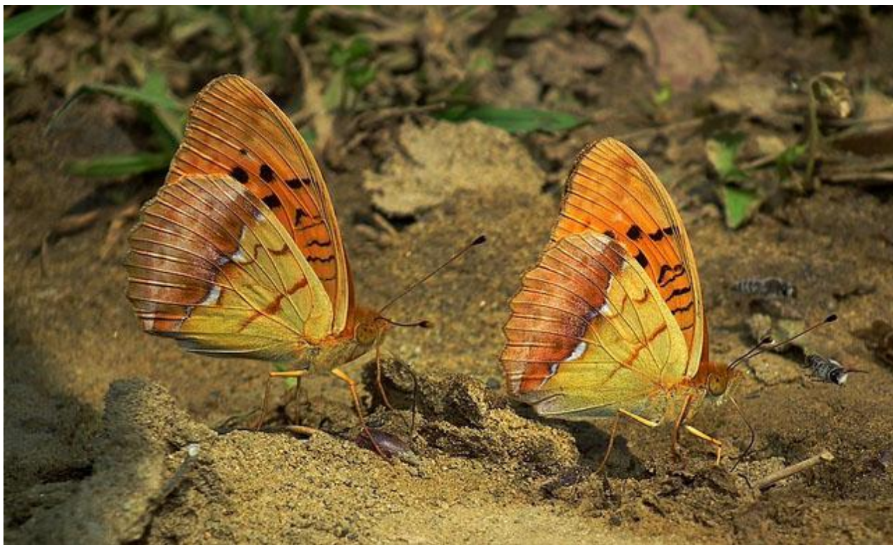
Skuggpärlemorfjäril är en av flera riktigt karismatiska fjärilsarter vi kan se i Transsylvanien.