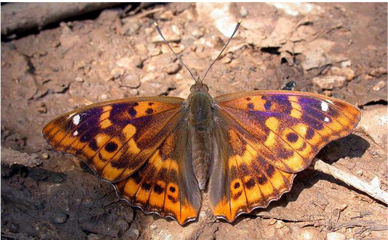
Aspskimmerfjäril är en av tre skimmerfjärilar vi hoppas få se.

Dag 1: Vi möts på Cluj flygplats i Rumänien av vår guide Lajos Nemeth, och far i minibussar mot vårt första boende – ett fantastiskt hotell i byn Torockoszentgyorgy (Coltesti), vid Apusenibergens fot. Om du anländer med ett tidigt flyg hinner vi bekanta oss med den underbara naturen. Vi befinner oss i ett imponerande subalpint landskap vid Aricsflodens källor. Dramatiska, sydvända klippstup ger förutsättningar för annars mer högalpina arter. Lokalbefolkningen transporterar sig med åsnor i pittoreska miljöer med halmtaksförsedda hus, och kvinnorna samlas för att tvätta vid byns vattenkälla på torget, en syn praktiskt taget omöjlig i någon annan del av Europa. Kanske får vi en första chans på gulbukig klockgroda och flera exklusiva fjärilar, däribland en av resans mest exklusiva arter, vitvingen Fentoon´s White . Det blir en kulinarisk välkomstmiddag med lokal mat på hotellet, och chans att höra dvärguv från sovrumsfönstret innan vi somnar!