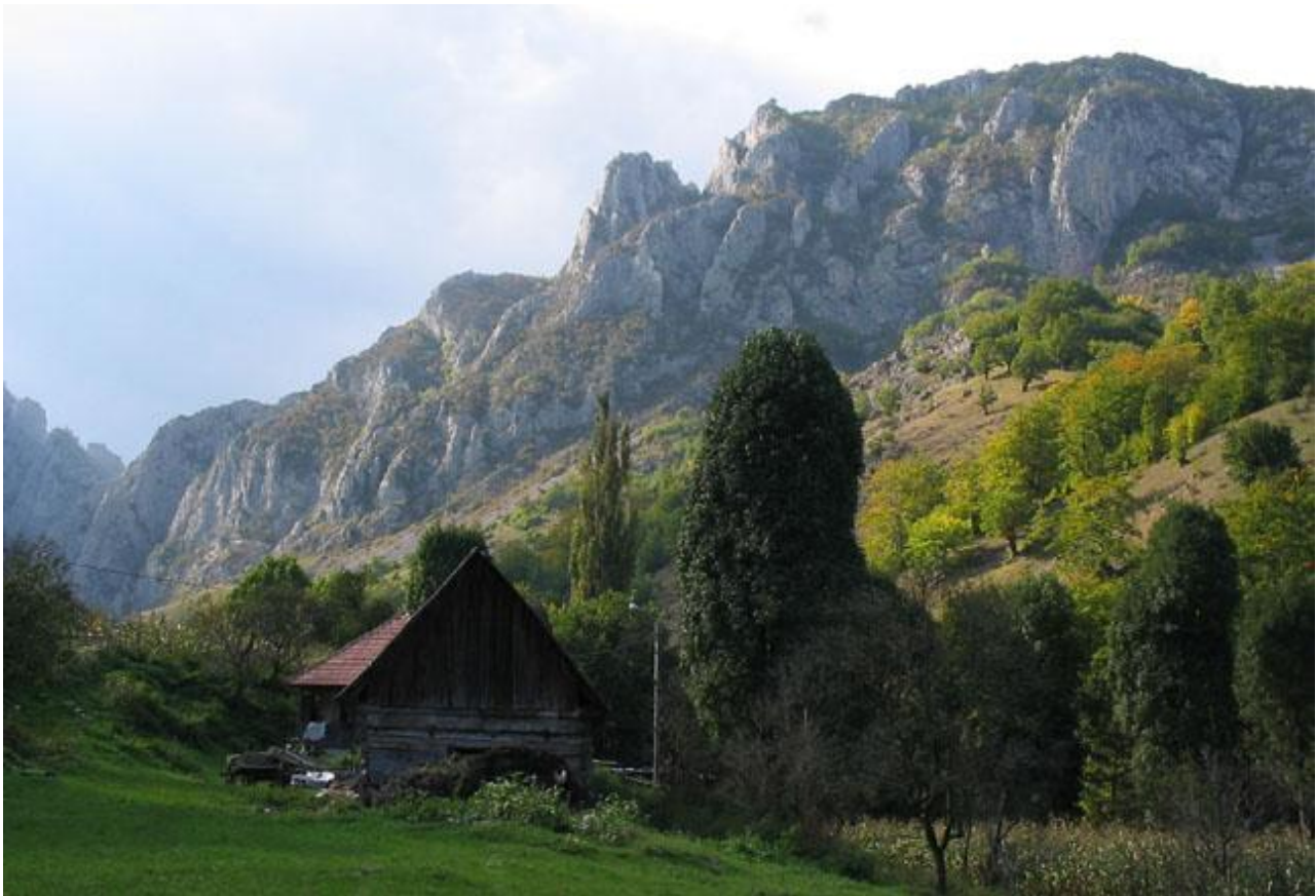
Transsylvansk landsbygd med småbyar omgivna av mycket natur. Byn Moc.

Dag 6: En kort bilfärd på morgonen tar oss till byn Bagy och Fortress Hill, områdets enda plats för fjärilen Hermit . Här finns också arter som Small Mountain White , Adonis Blue , Sooty Copper och Essex Skipper . Fåglintresserade lär också uppskatta att mindre skrikörn inte är ovanlig alls i omgivningarna, och att vi besöker fiskdammarna vid Sinpaul, där både vitögd dykand, svart stork och purpurhäger ofta ses. Troligen finns här även intressanta trollsländefynd att göra. Efter en ovanligt tidig middag ger vi oss iväg till ett björngömsle, där vi sannolikt inte kommer att missa målarten i skymningen. Björnarna matas här dagligen. En mikroskopisk chans finns även att se varg. Man kan fascineras över att Rumänien, med en yta bara drygt hälften av Sveriges, hyser både en björn- och vargstam som är betydligt större än vår, och dessutom sen hösten 2016 har jaktförbud på alla stora rovdjur (jo, lodjur finns också!).