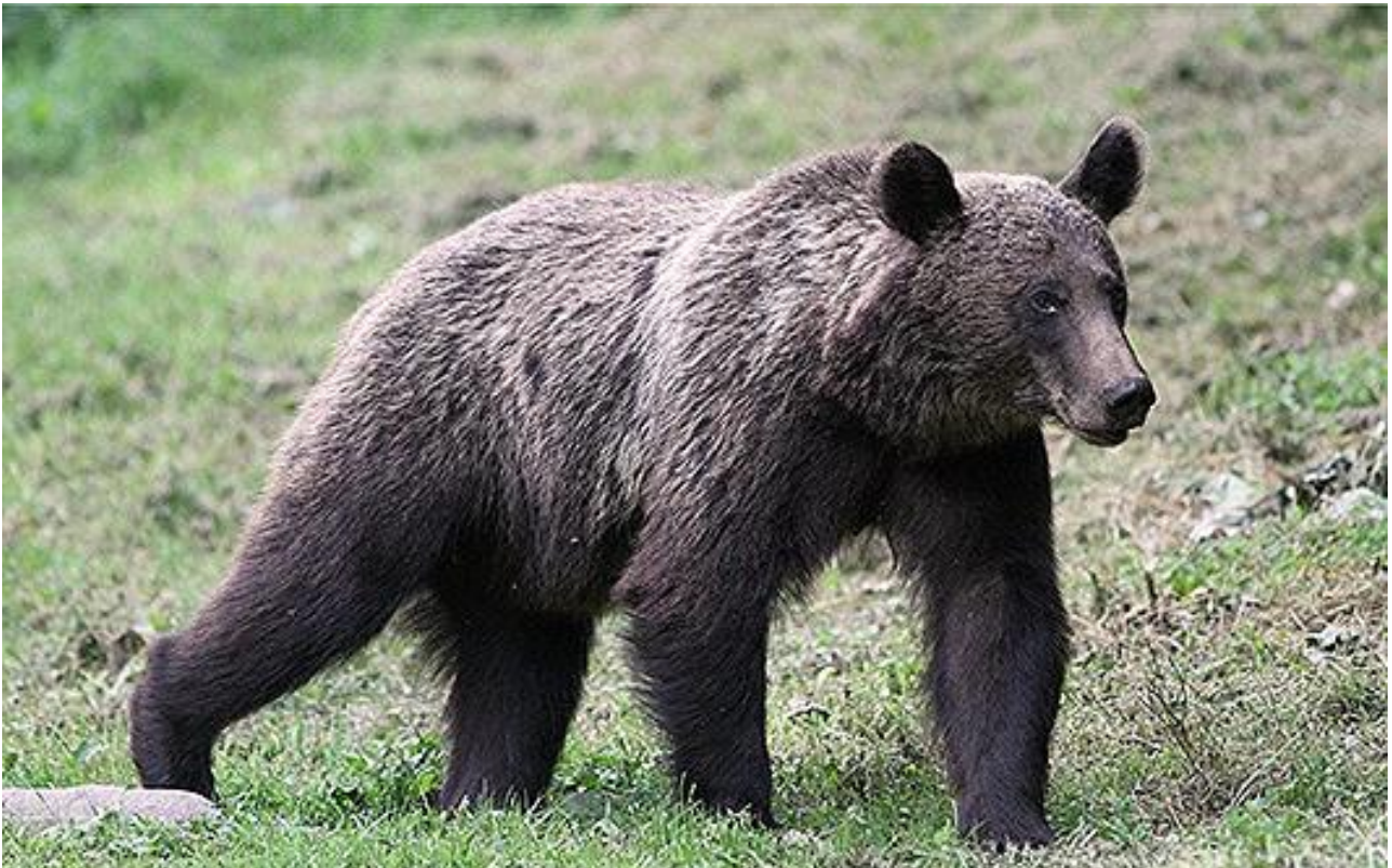
Vi hoppas få se brunbjörn ifrån ett gömsle nära Desag.

Dag 3: Hela denna dag ägnar vi åt omgivningarna kring Coltesi och den nära liggande byn Rimetea. Coltesti är uppkallat efter ett medeltida fort, vackert beläget högst uppe på en klippa. Denna dag promenerar vi såväl i bergslandskap som lummiga skogar, med chans på ett stort antal mycket exklusiva fjärilsarter. För några år sedan lyckades Lajos notera hela 84 dagfjärilsarter under en dag här, men fjärilar är som bekant väderberoende. Ett axplock av vad vi har chans på är Geranium Argus , Large Copper , Common och Hungarian Glider , samt ett stort antal blåvingar, pärlemor- och nätfjärilar. Med tur kan balkanmes ses i omgivningarna och smaragdödlan lär vi inte missa! Natt i Coltesi.