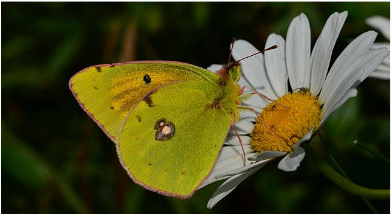
Donauhöfjäril är Europas mest sällsynta höfjärilar och har minskat kraftigt de senare åren.

Dag 9: Avfärd för transport till flygplatsen utanför Cluj, där resan avslutas strax efter lunch.