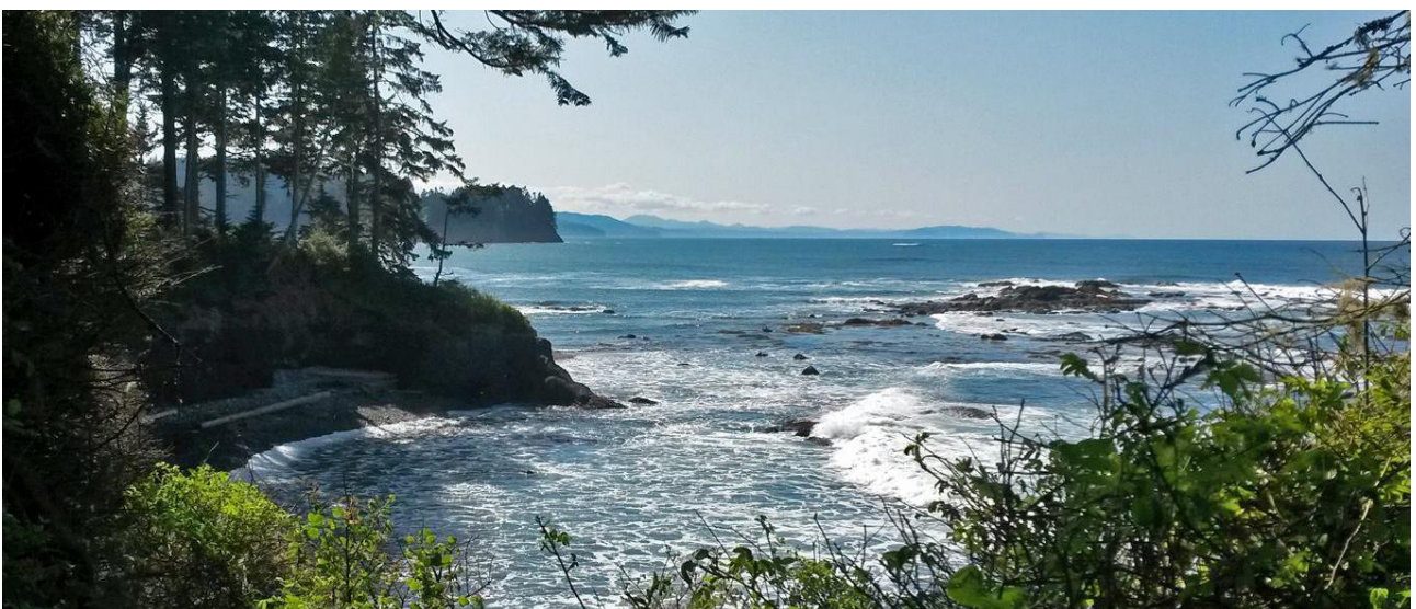
Många vackra vyer väntar på oss!