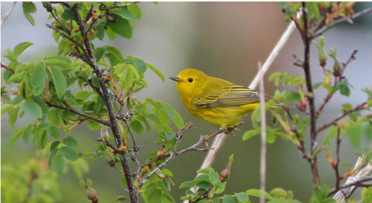
Gul skogssångare.

Dag 3: Heldag i hackspettrika områden vid Bethel Ridge. Arterna vi håller utkik efter är kråkspett, svartryggig, rödnackad och rödhuvad savspett, hårspett, dunspett, vedspett, svartryggig och vithuvad hackspett, am. spillkråka och guldspett. I övrigt tittar vi bl.a. efter nashilleskogssångare, lärkparv, lazulifink, ponderosa-, vitbröstad- och rödbröstad nötväcka och två arter sialior.