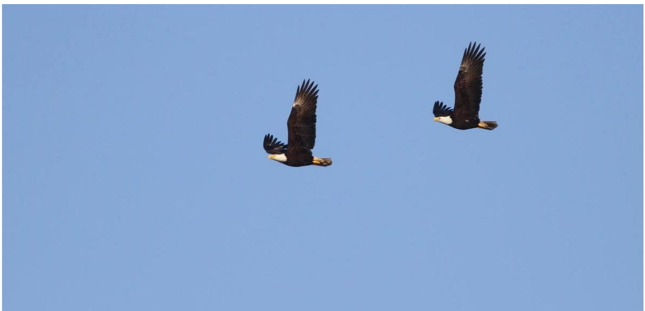
Vithövdade havsörnar.