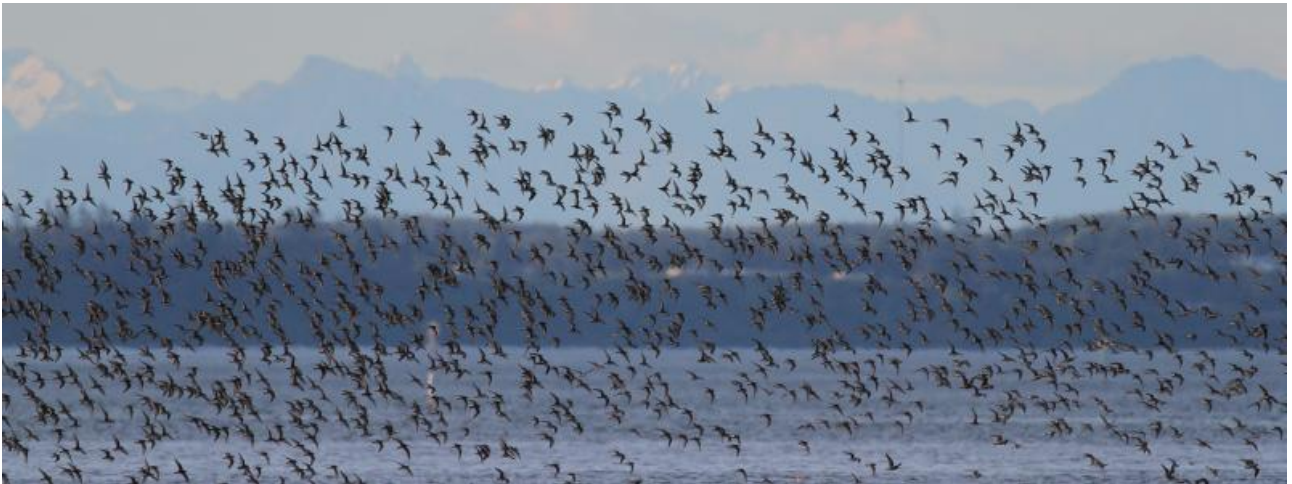
Härliga moln av vadare väntar oss vi Grey's Harbour!

Dag 12: Morgon vid tsunamitornet i Westport – garanterat ett av skådarvärldens mest skakningsfria fågeltorn! Bukten utanför brukar vara härligt rik på sjöfågel av alla de slag och vi spanar efter vitnackade svärter, svartnåbbade islommar, mörka svandopingar, sträckande dvärgkanadagäss och flera olika arter av stillahavsalkor och skarvar. Därefter transport till Seattle där resan avslutas.