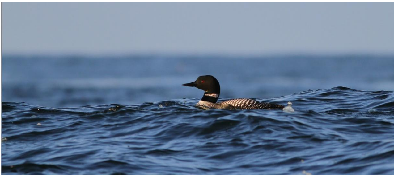
Svartnäbbad islom.