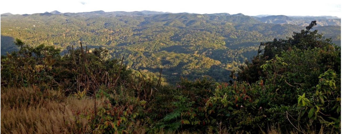
I Serra de Baturité får vi uppleva en härlig blandning av biotoper.

kommer vi att se ett härligt och varierat landskap. Här finns den speciella caatinga som är en slags ökenbiotop med mycket buskar och torr skog, som består främst av små träd med törnar som släpper sina löv under torrperioden. Där finns även kaktusar, tjockstammade växter och höga gräs. En liknande biotop är cerradon , som är Sydamerikas motsvarighet till den afrikanska savannen. Vi kommer också besöka de olika typer av regnskogar som finns närmare Atlantkusten.