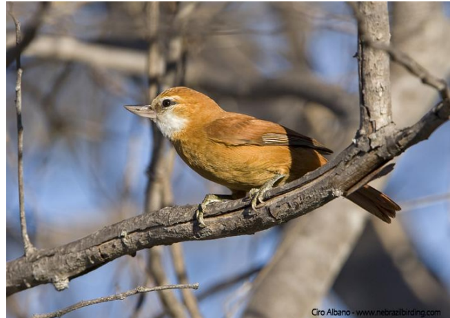
Araripe manakin och Great Xenops – två av Chapada do Araripes specialiteter.

Dag 4: Tidigt på morgonen fortsätter vi fågelskådningen i Quixada och åker därefter till Chapada do Araripe – en längre transport på 50 mil då vi kan njuta av landskapet och vila. Chapada do Araripe är en högplåtå i den södra delen av delstaten Ceará. Området är rik på fåglar på grund av mångfalden av biotoper. På toppen av plåtån finns cerrado och Caatinga och på sluttningarna en blandad fuktig skog. Det finns flera källor i sluttningen och i skogen vid dem har vi chans att se den fantastiskt vackra Araripe Manakin, som upptäcktes så sent som 1996! I den torrare vegetationen på toppen av plåtån kommer vi också att finna många endemiska arter såsom Great Xenops, Silvery-cheeked Antshrike, Red-shouldered Spinetail, Caatinga Antshrike, Tawny Piculet, White-browed Antpitta, Caatinga Antwren etc.