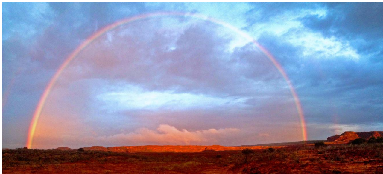
Lear's Macaw Reserve.