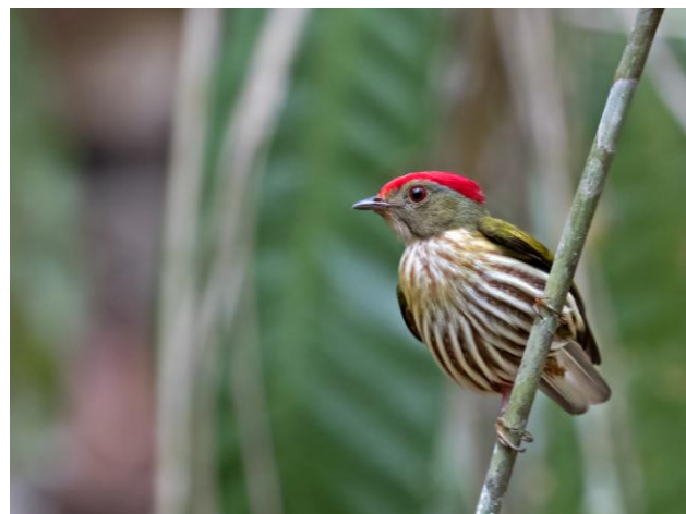
Både Banded Cotinga och Eastern Striped Manakin trivs i Veracel.

Dag 16: I närheten av staden har skogsbolaget Veracel avsatt ett ca 6 000 ha stort reservat med låglandsregnskog. De flesta av specialarterna kan ses från en allmän väg som skär genom skogen, annars krävs särskilt tillstånd. Reservatet är kanske den bästa lokalen i världen för de färgstarka Banded och White-winged Cotingas samt den luriga Hook-billed Hermit. Även White-necked Hawk, White-winged Potoo, Ochre-marked Parakeet, Golden-tailed Parrotlet, Red-browed Parrot, den fantastiska Racket-tailed Coquette, Bahia Antwren, Band-tailed Antwrens, Cinereous Mourner och Eastern Striped Manakin.