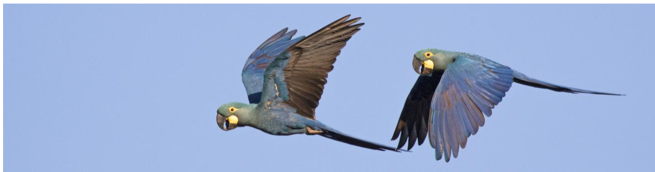
Lear's Macaw – en av flera fina fåglar som vi kommer att se på resan.

Följer du med på extradagarna har du även chans att se godbitar som Banded Cotinga, Racket-tailed Coquette, Pink-legged Graveteiro, Salvatori's Antwren och Eastern Striped Manakin. Och vi kommer självklart se vackra landskap, roliga apor, snygga fjärilar och testa det brasilianska köket. Och det blir flera trevliga stunder vid kolibri- och fruktmatningar då vi kan sitta och njuta av den färgexplosion som de brasilianska fåglarna bjuder på!