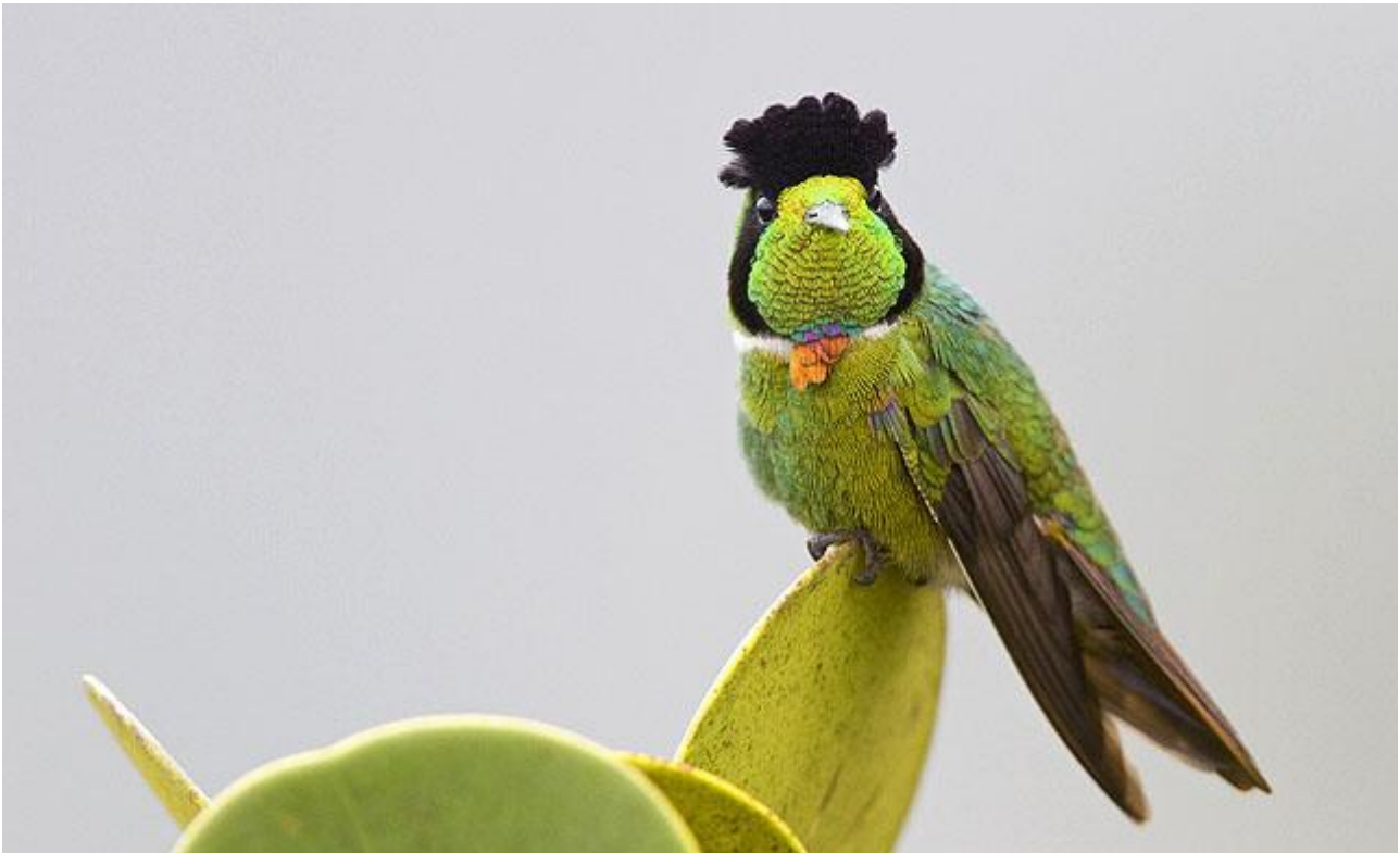
Den otroligt vackra Hooded Visorbearer.

Men det finns mycket annat att se här, t ex Sao Francisco Sparrow, Grey-backed Tachuri, Pale-throated Serra-finch, Horned Sungem, Broad-tipped Hermit, Spotted Piculet, Rufous-sided Pygmy-Tyrant, Collared Crescentchest och White-banded Tanager.