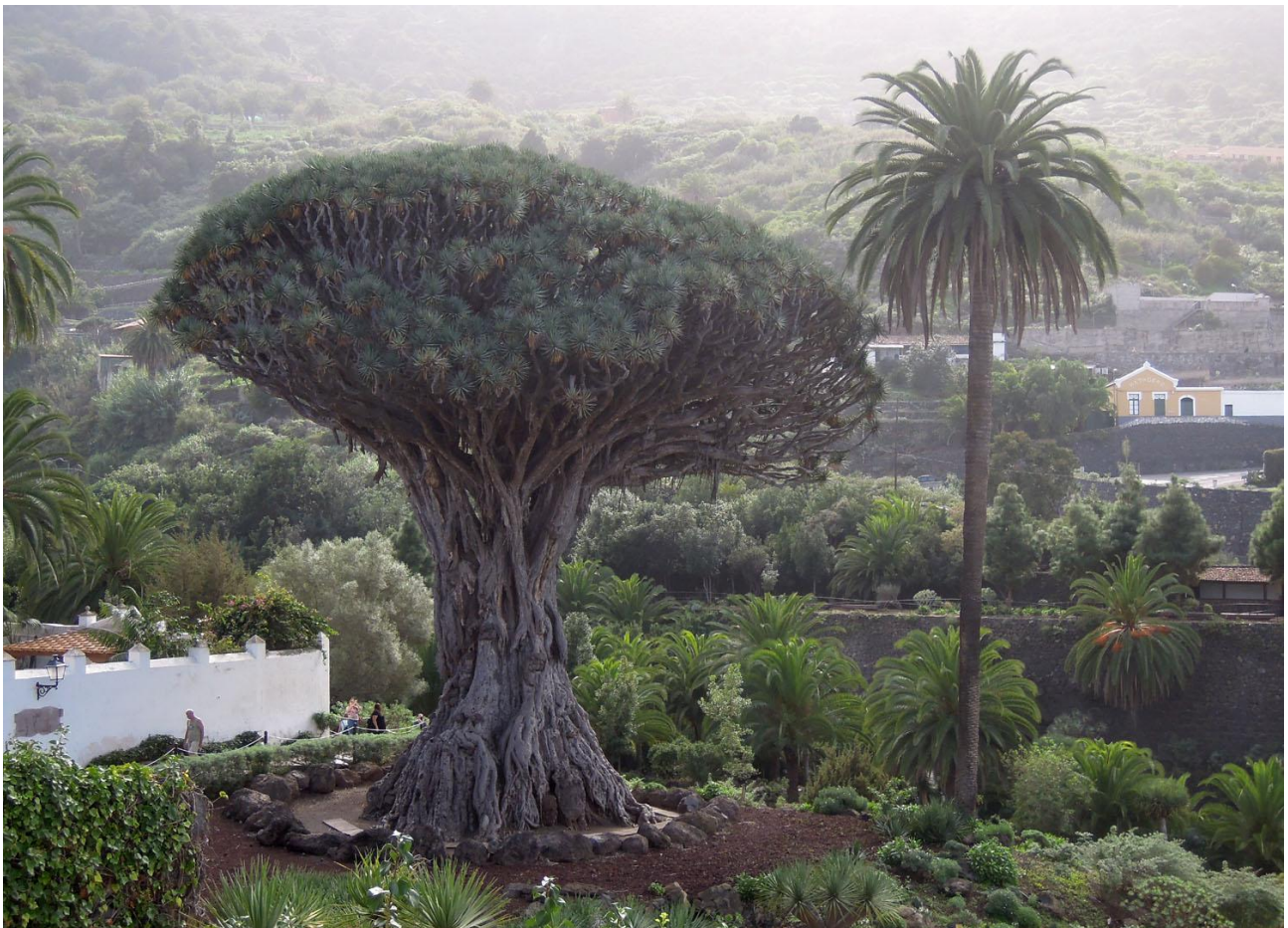
Det kända drakblodsträdet Drago Milenario på norra Teneriffa.

Dag 9: Frukost i Los Cristianos och resan avslutas på Teneriffas internationella flygplats strax före lunchtid.