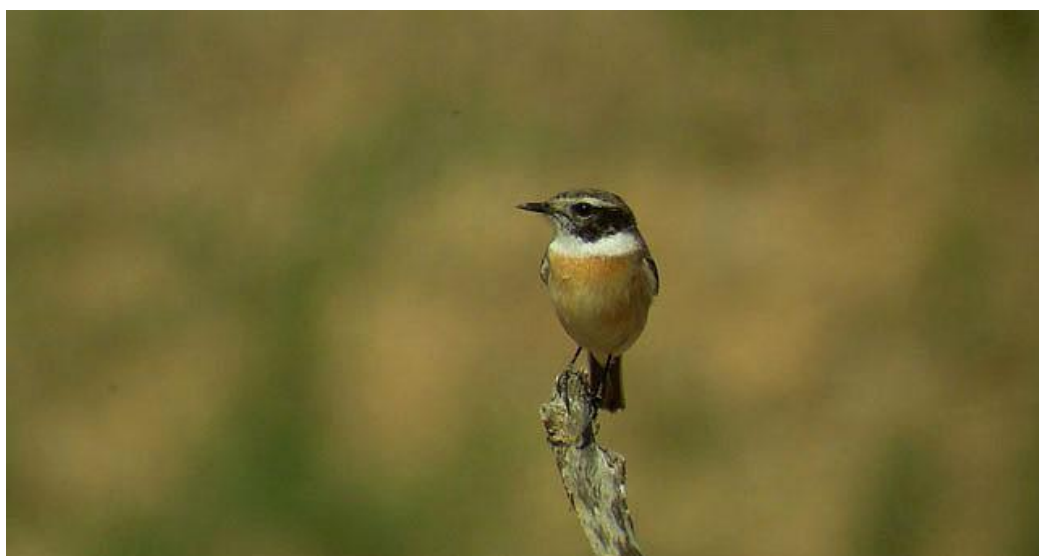
Vi har goda chanser att hitta kanariebuskskvättan under resan.

Kanarieöarna är ett populärt resmål för soltörstande nordbor. Men de atlantiska öarna erbjuder också rika naturupplevelser med dramatiska vulkanlandskap, torr öken, frodiga lagerskogar och vackra klippformationer längs kusten. Vi kryddar vår vistelse med fågelskådning i lugnt tempo där vi letar efter fåglar som bara finns här och ingen annanstans. Teneriffa utgör basen med besök på ytterligare två öar, det ökenartade Fuerteventura och det vackra och grönskande La Palma.