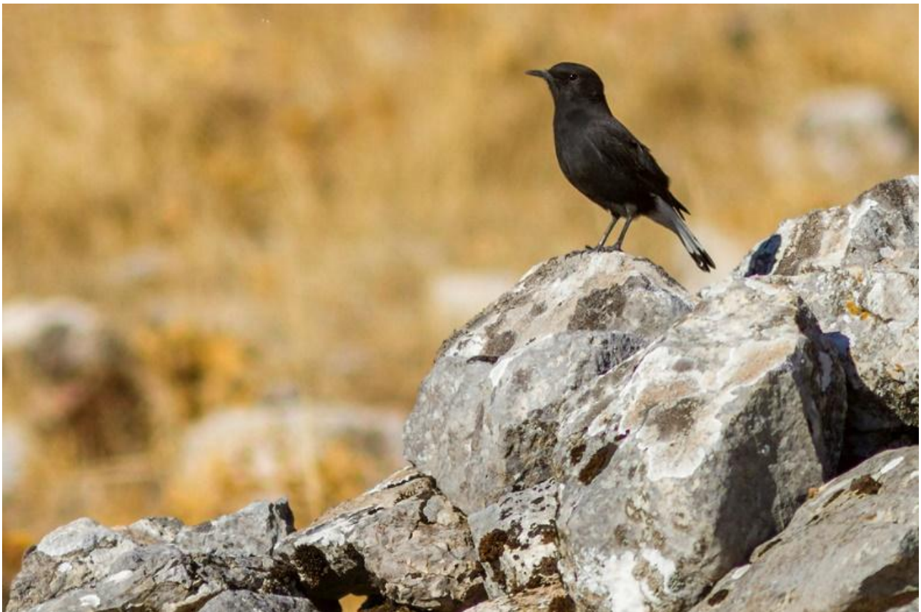
Vi kan få se svart stenskvätta i Grazalema.

Vi kommer att ha gott om tid att utforska Rondas gator och de dramatiska vyerna som erbjuds innan vi gör oss redo för en utmärkt middag med andalusiska specialiteter på vårt hotell Parador Nacional de Ronda.