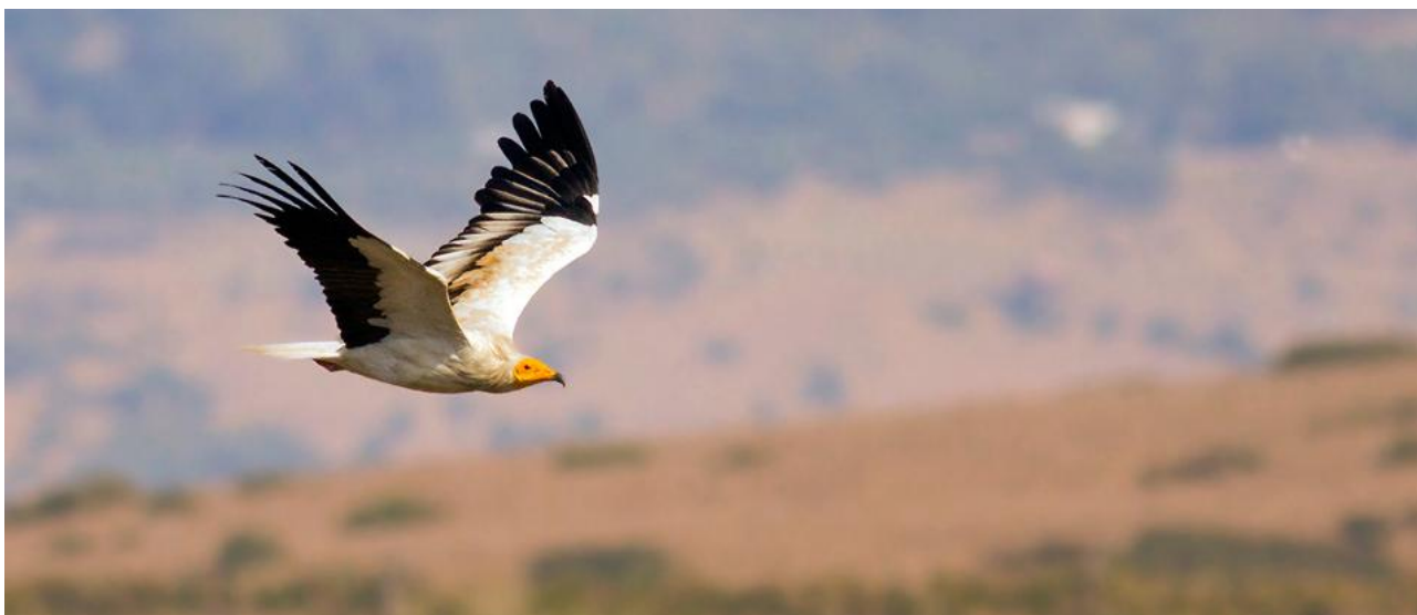
Smutsgamen är en av de sträckande fåglarna som vi kan få se vid Gibraltarsundet.