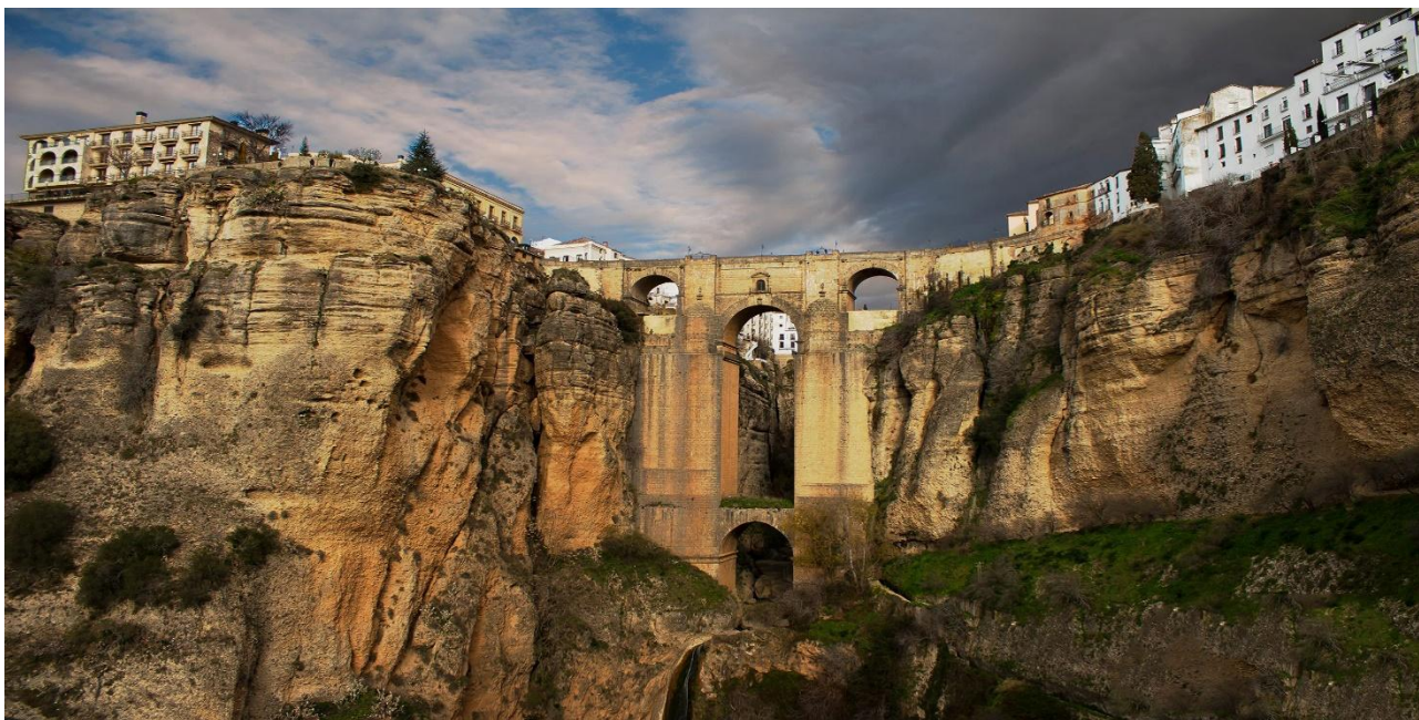
Ett av de fina hotell som vi kommer bo på – Parador Nacional (längst upp till vänster) i Ronda.