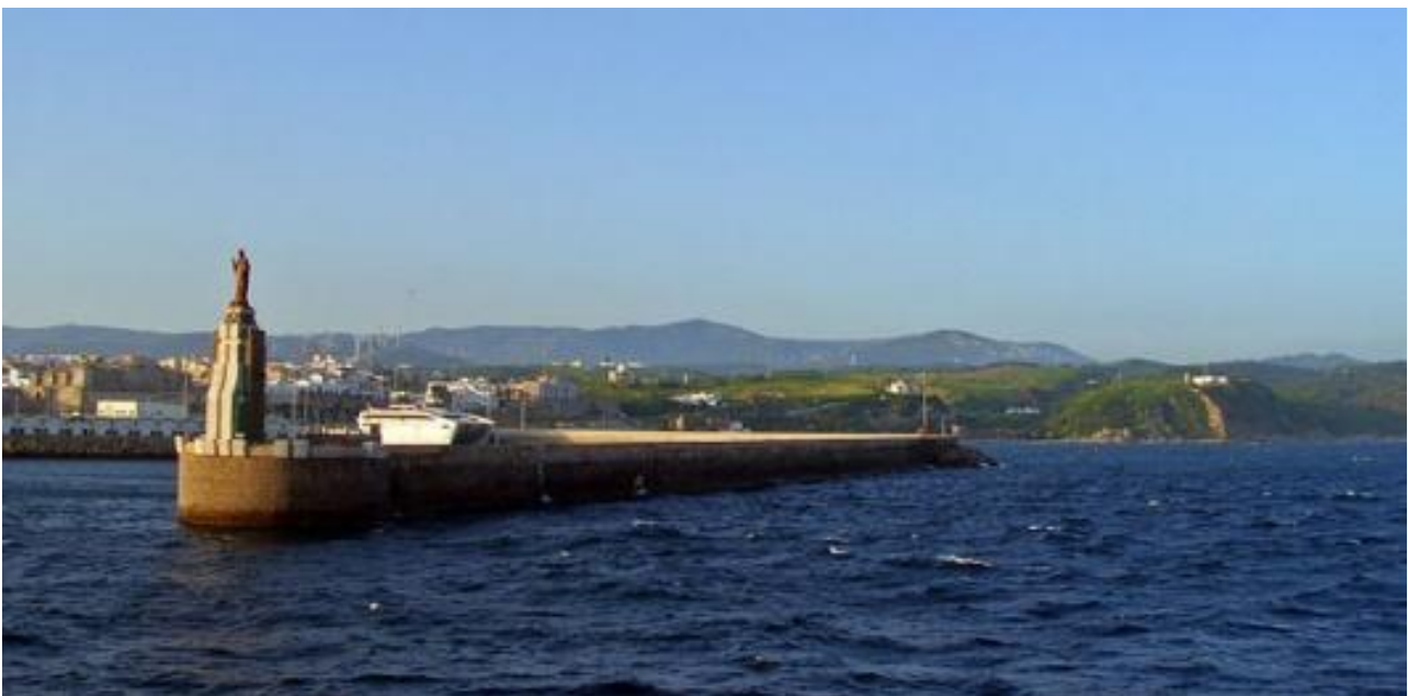
Tarifas hamn. Det är härifrån vår båttur utgår.

På klippor i området häckar gåsgam och under denna tid på året brukar ungfågarna fortfarande sitta och tigga efter mat. Sierra de la Plata är ett utmärkt ställe att spana efter blåtrast, medelhavsstenskivatta och lagerlärka.