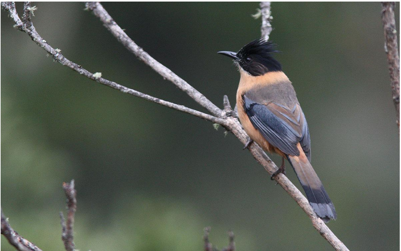
Rufous Sibia.

Dag 2–3: Kathmandudalen är ursprungligen en sjö, belägen ca 1 400 meter över havet. Dalen är tätbefolkad och ca 1,4 miljoner människor lever här. De lägre och flackare partierna är uppodlade, medan de brantare sluttningarna fortfarande är klädda med fina och fågelrika skogar. Fågelfaunan är i högsta grad intressant trots att vi är i välbefolkade områden. Här finns bl a arter som Spiny Babbler, endemisk för Nepal och Grey-sided och Aberrant Bush Warblers liksom den skygga Golden Bush Robin. När vi besöker berget Phulchowki kommer vi att träffa på mängder med arter typiska för centrala Himalayas skogsområden. Här finns t ex Rufous Sibia, Rusty-cheeked Scimitar Babbler, White-browed Fulvetta och White-throated Laughingthrush. Vi håller också koll på lufthavet efter Black Eagle som långsamt patrullerar över trädkropparna i jakt på något ätbart (däggdjur och fåglar). När vi besöker området nu under vintern så är chansen stor att vi träffar på sk bird waves (meståg). Dessa kan vara både artrika och individrika. När tågen kommer så gäller det att vara alert med kikaren. Det går ofta rätt så snabbt innan fåglarna är som uppslukade av vegetationen.