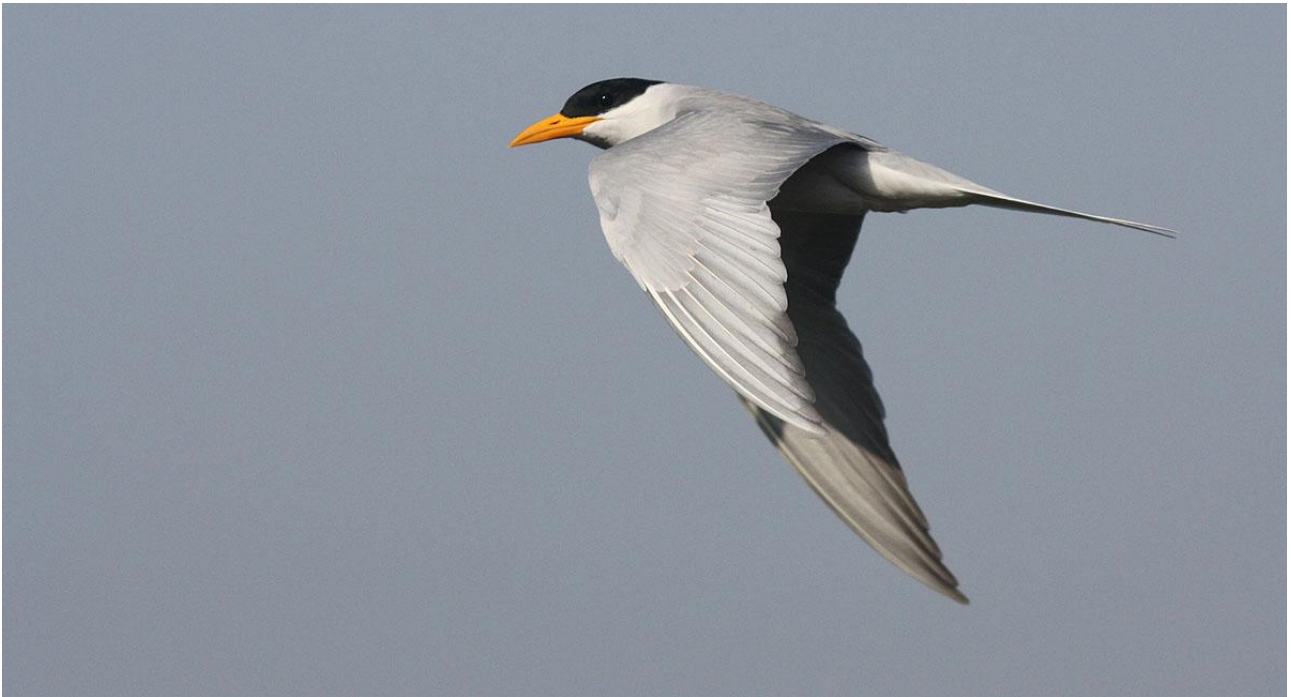
River Tern.

Dag 11: Flyg tillbaka till Kathmandu. Natt i Kathmandu.