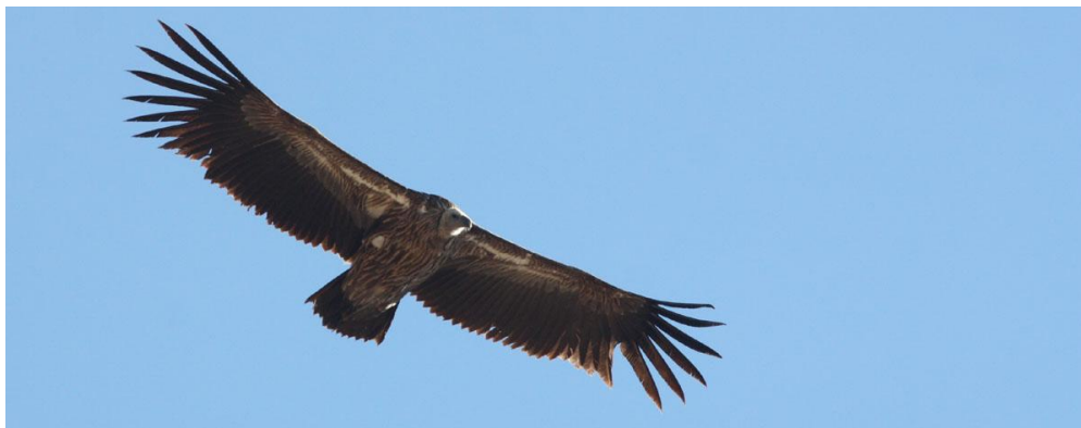
Himalayan Vulture.

Det är tidig morgon. Solen arbetar sig långsamt upp över Himalayas rand. Det är skådarljus långt innan vi ser solen. Långt bort i horisonten, över femton mil iväg, ser vi toppen av Mt Everest. När vi sveper med kikarna över sluttningen med de blommande rhododendronträden, ser vi flera arter solfåglar som söker föda i de skarpt rödtecknade blommorna. En grupp White-throated Laughingthrush tjatrar nära vägen. Så händer något som vi väntat på, ett meståg (birdwave) rör sig genom träden, fyllt med flera olika arter. Nu gäller det att hänga med! Vi tittar efter Fulvettas, Yuhinas, sångare, nötväckor, mesar, Minlas m m. Först när flocken passerat tar vi fram fågelboken och går igenom vad vi sett.