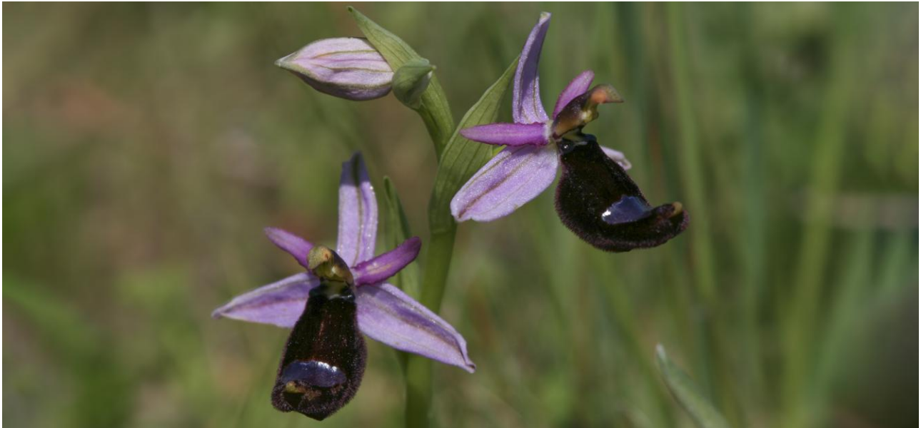
Ophrys bertolonii är bara ett av bortåt 15 flugblomstertaxa som vi bör kunna hitta.

Dag 4-6: Siracusa blir vår bas för utflykter i det orkidé- och fågelrika sydöstra hörnet av Sicilien. Vi börjar troligen med ett besök vid de tidigare salinerna i naturreservatet Golfo di Siracusa för att spana efter flamingoer och andra våtmarksfåglar. En timmes resa söderut ligger Capo Passero – känd för sitt flyttfågelsträck om våren. Vi åker längs en vacker väg till Portapolo innan vi når den kända fyren längst ut på udden, som erbjuder bra span efter liror och trutar.