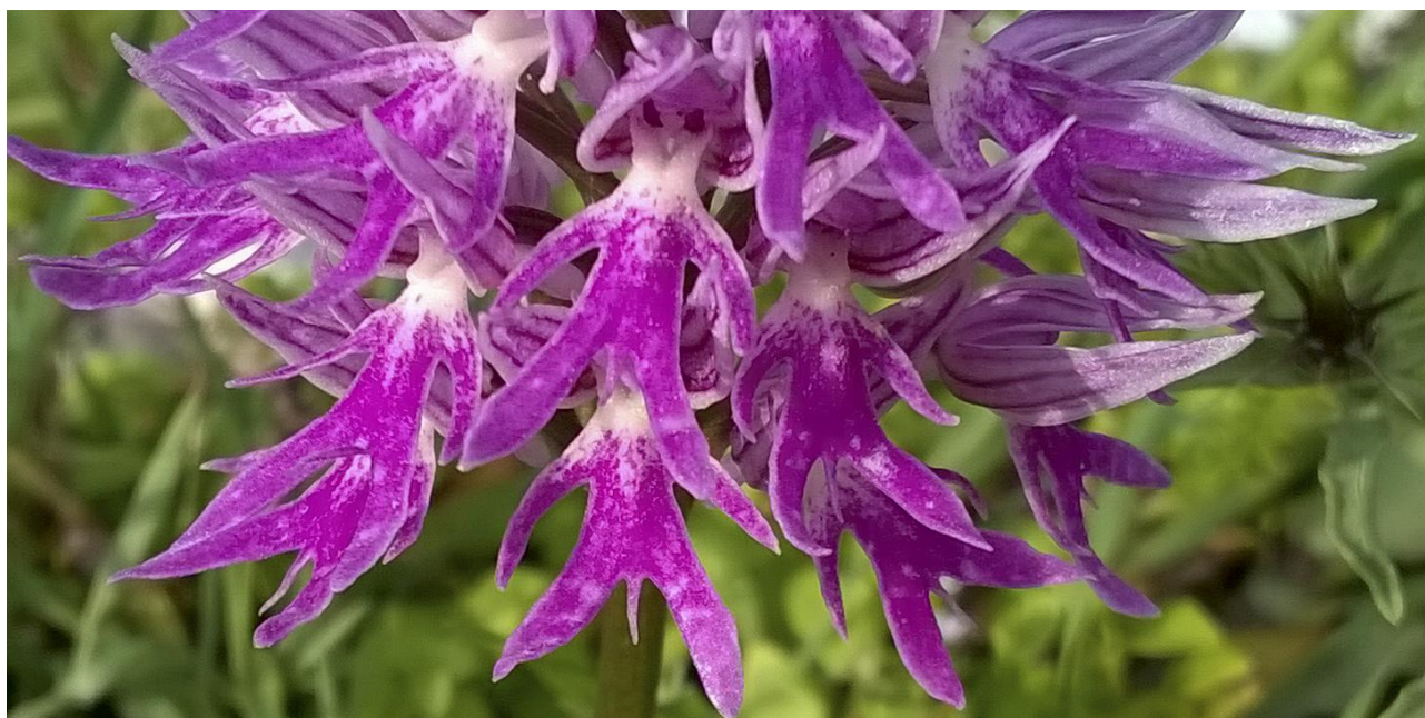
Borstnycklar Orchis italica är en vanlig syn om våren på Sicilien.

Sicilien utgör en sydlig utpost av Europa. Faktum är att det hörn av ön vi spenderar mest tid på ligger längre söderut än Tunisiens huvudstad! De klimatförutsättningar som följer av detta, graden av isolering, och de stora höjdskillnaderna gör ön till ett mycket spännande resmål för den naturintresserade. I skogklädda dalgångar, slänter med betesmarker, våtmarker och i de höglänta miljöerna ovanför trädgränsen utforskar vi öns fåglar, orkidéer, endemiska ödlor, fjärilar och i korthet ett stort stycke unik europeisk natur. Vi kommer också att bekanta oss med det hyllade sicilianska köket. Det här blir AviFaunas andra resa till den historiska ön.