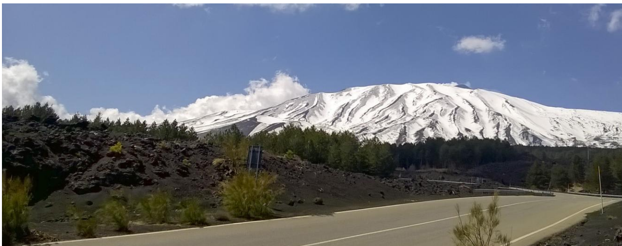
Etnas topp sträcker sig 3 350 meter över havet.