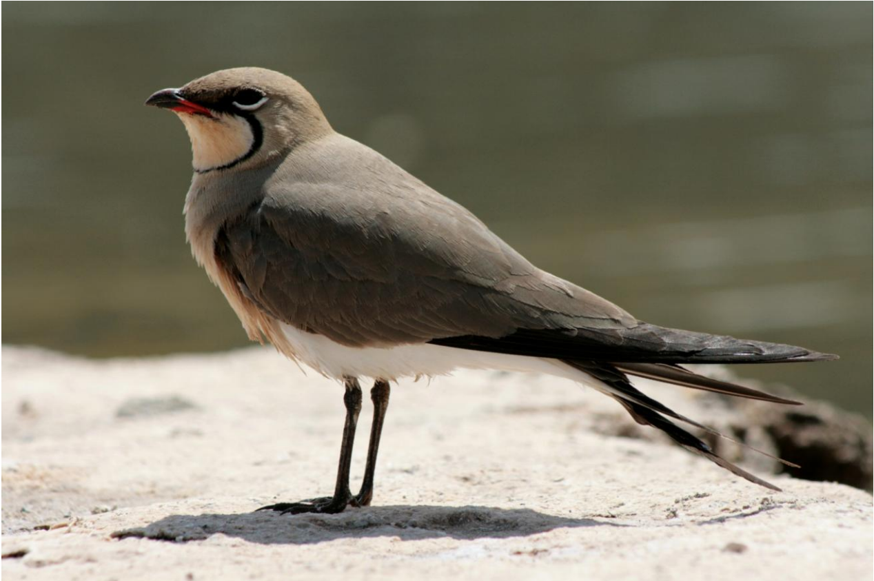
Rödvingad vadarsvala är inte en ovanlig syn vid saliner och våtmarker.

Dag 1: Vi möts på eftermiddagen/kvällen på flygplatsen i Catania, och tar oss i minibuss ca 1 timme norrut mot Etna, till vårt hotell i en lantlig miljö utanför byn Randazzo där vi ska bo två nätter. Om det ännu är ljus gör vi eventuellt korta stopp för skådning vid våtmarker längs vägen, med chans på hägrar, måsar, tärnor och svart stare.