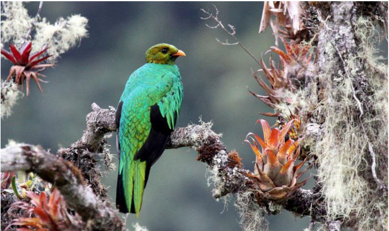
Golden-headed Quetzal. Så glänsande grön!

Dag 10–12: Under tre hela dagar skådar vi runt lodgen och på olika höjd nivåer på vägen ovanför och nedanför lodgen. Skogen går ända intill vägen så det är en behaglig skådning där bussen kör oss upp och så vi kan gå utför. Vi spenderar också tid på lodgen där feeders lockar Violet-fronted Brilliant, Many-spotted Hummingbird och publikfriare som Booted Raquettail och Wire-crested Thorntail. Flera arter Tanagers, flugsnappare och andra fåglar kommer också förbi och Yungas Manakin finns utmed stigarna. Ytterligare arter vi spanar efter är bl a Golden-headed Quetzal, Black-and-chestnut Eagle och Solitary Eagle. Vi ska givetvis besöka spelplatsen för Cock-of-the-Rock (Klipptupp) strax ovanför lodgen, där den bjuder oss på ett mäktigt skådespel. På lägre höjd, 1 000 meter över havet, kan vi förvänta oss andra arter som Green-fronted Lancebill, Lanceolated Monklet, kanske Amazonian Umbrellabird och Olive Finch, Bluish-fronted Jacamar och Black-backed Tody-Flycatcher m m. En kväll gör vi ett försök på Lyre-tailed Nightjar.