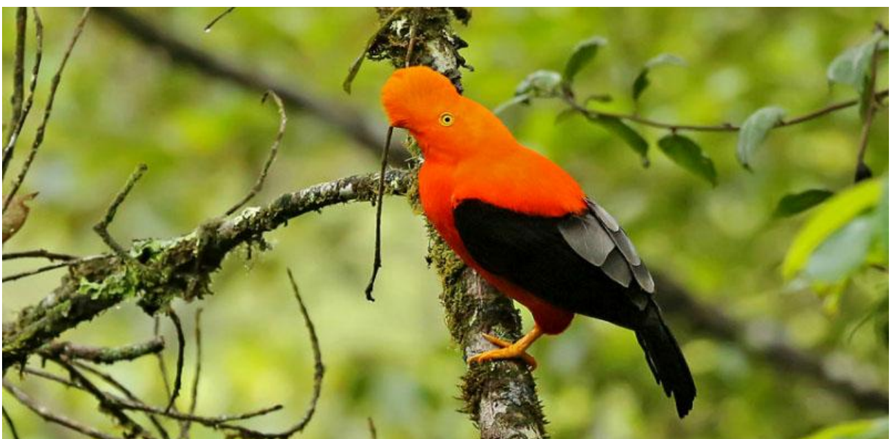
Andean Cock-of-the-rock, Perus nationalfågel.