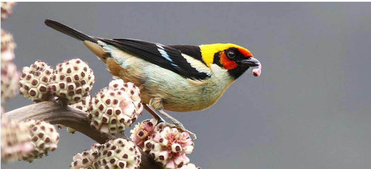
Flame-crested Tanager, en av alla dessa färggranna tangaror vi kommer att få se.

Dag 8: Morgonen spenderar vi vid Abra Malaga som nås på en nybygd asfaltsväg. Ytterligare chans på kondor men vi ska framför allt besöka en mindre polylepisskog där vi hoppas hitta de flesta fåglarna som är endemiska för denna synnerligen hotade miljö. Polylepis är det träd som växer högst upp av alla och börjar i princip där de andra träden upphör att växa. Man räknar med att det idag bara finns ca 1 % kvar av de ursprungliga polylepisskogarna i Anderna. Vi stannar också på den torra sidan och letar efter endemer som Creamy-crested Spinetail, Chestnut-breasted Mountain-Finch och White-tufted Sunbeam. Efter lunch tar vi tåget tillbaka till Cusco. Natt i Cusco.