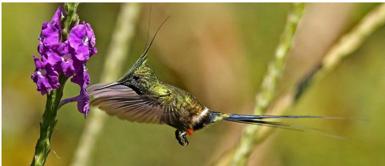
Wire-crested Thorntail, en av alla läckra kolibrier vi ser.

Efter några timmar i buss från Cusco når vi Acjanciopasset på 3 600 meters höjd. Här siktar vi in oss på våra första andinska fåglar. Nedanför oss har vi klassiska Manu Road som brakar nedför östra sidan av Anderna till Amazonas lågland. Vi ska dock hålla oss till den bergiga delen, strategiskt baserade på trevliga Cock of the Rock Lodge. Alldeles intill har vi en spelplats för Andean Cock-of-the-rock, tillika Perus nationalfågel. Följ med på ett fantastiskt fågeläventyr och till ett mycket bra pris!