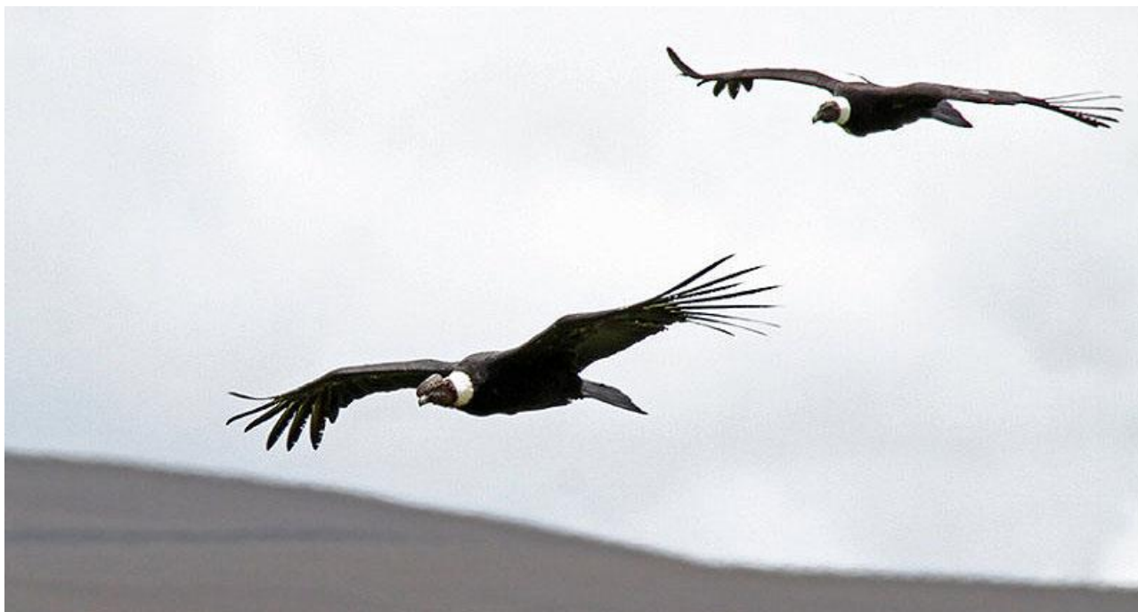
Andean Condor, Andernas regent.