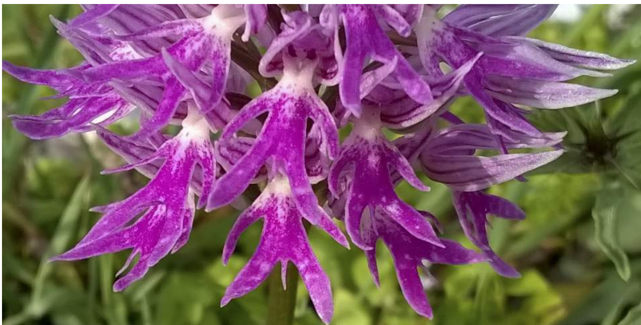
Borstnycklar Orchis italica är en vanlig syn om våren på Sicilien.

Sicilien utgör en sydlig utpost av Europa. Faktum är att det hörn av ön vi spenderar mest tid på ligger längre söderut än Tunisiens huvudstad! De klimatförutsättningar som följer av detta, graden av isolering, och de stora höjdskillnaderna gör ön till ett mycket spännande resmål för den naturintresserade. I skogklädda dalgångar, slänter med betesmarker, våtmarker och i de höglänta miljöerna ovanför trädgränsen utforskar vi öns fåglar, orkidéer, endemiska ödlor, fjärilar och i korthet ett stort stycke unik europeisk natur. Vi kommer också att bekanta oss med det hyllade sicilianska köket. Det här blir AviFaunas andra resa till den historiska ön.