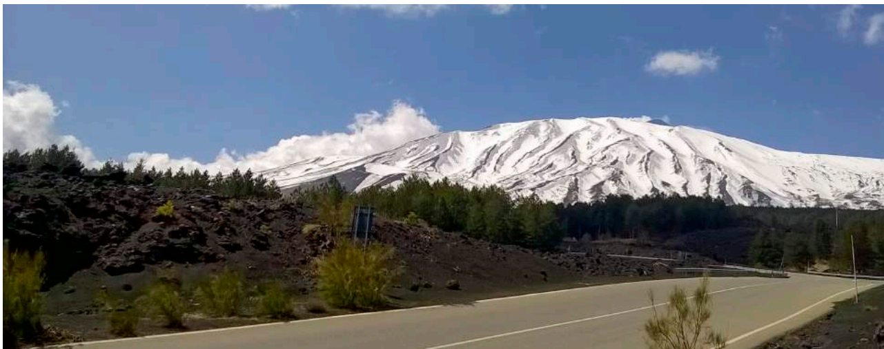
Etnas topp sträcker sig 3 350 meter över havet.