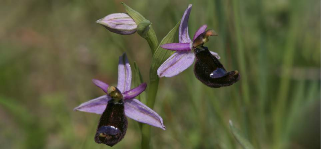
Ophrys bertolonii är bara ett av bortåt 15 flugblomstertaxa som vi bör kunna hitta.

Dag 4-6: Siracusa blir vår bas för utflykter i det orkidé- och fågelrika sydöstra hörnet av Sicilien. Vi börjar troligen med ett besök vid de tidigare salinerna i naturreservatet Golfo di Siracusa för att spana efter flamingoer och andra våtmarksfåglar. En timmes resa söderut ligger Capo Passero – känd för sitt flyttfågelsträck om våren. Vi åker längs en vacker väg till Portapolo innan vi når den kända fyren längst ut på udden, som erbjuder bra span efter liror och trutar.