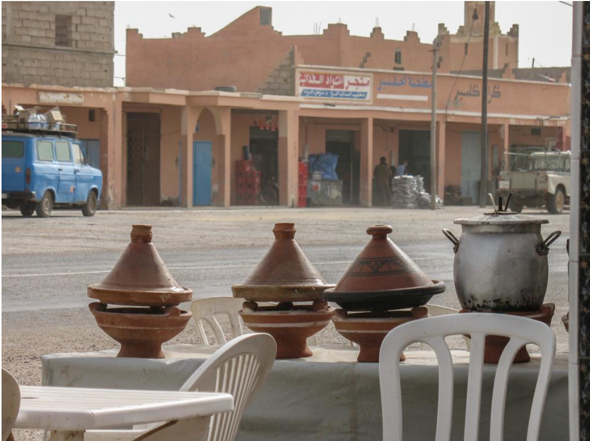
Den traditionella grytan Tajine tillreds i lerkärl över öppen låga..

Vi bor i dubbelrum på bra, trevliga och rena hotell med dusch och toalett på rummen.