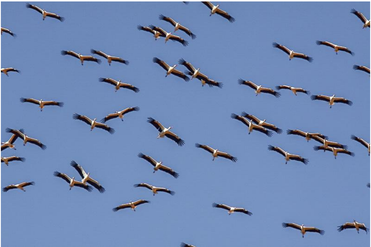
I Soudalen brukar det övervintra flockar med vit stork.