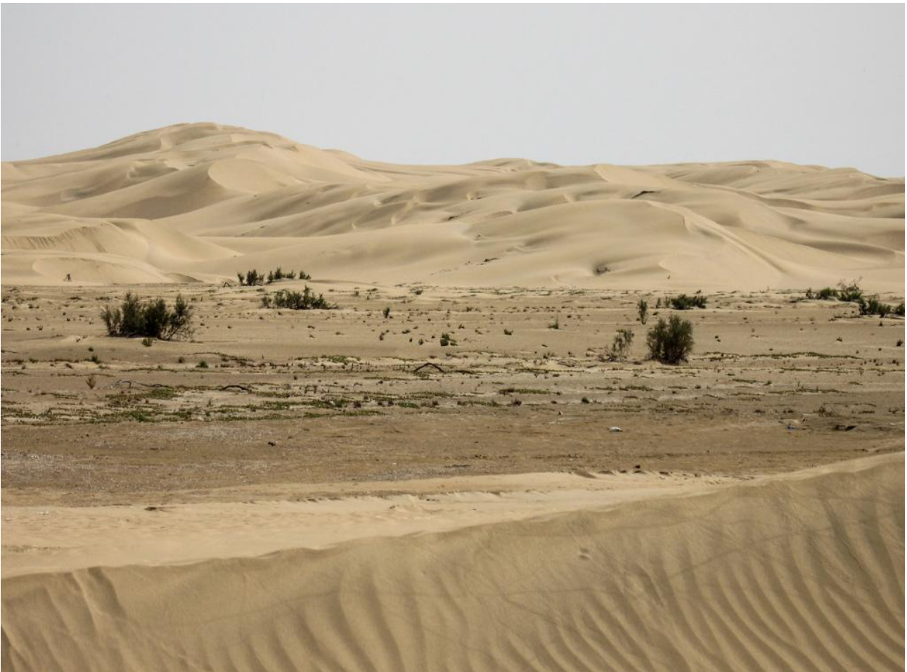
En hel del av skådningen sker i vacker ökenmiljö där vi bl. a. letar efter exklusiva lärkor.