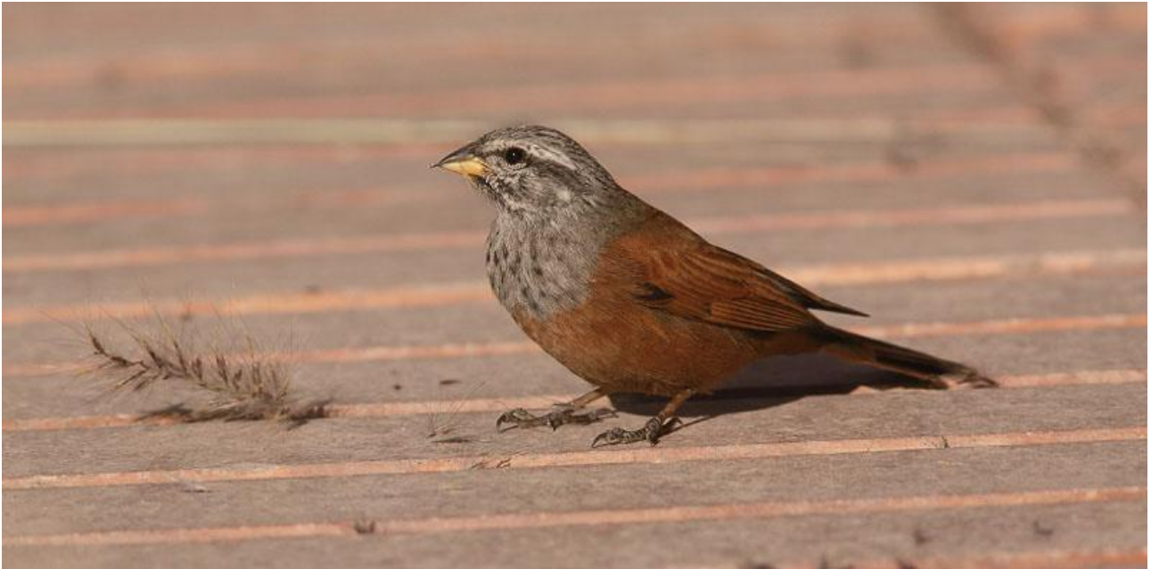
Den vackra hussparven finns här och där i stadsmiljö i Marocko. På bilden syns en hane.

Dag 7: Havsfågeltur under förmiddagen. Drygt halva dagen ägnas åt en pelagisk tur utanför Agadir. Vi åker ut med den bekväma båten M/S Aba Karim, som är chartrad enkom för oss. De har också med sig ”chum”, som används för att mata in fåglarna åt oss. Vi kan räkna med att kunna se havssulor, baleariska liror och mindre liror på närhåll, några labbar dyker säkert upp som en extra krydda, t.ex. bredstjärtad labb eller storlabb. Ute på havet serveras vi en förnämlig lunch med alla tänkbara tillbehör. Chansen är stor att vi får sällskap av några delfiner – springare är den mest sannolika arten. På eftermiddagen fortsätter vi norrut och skådar vid Tamri. Där är målarten nummer ett, eremitibis men också rödnäbbad trut står högt på önskelistan. Innan dagen är över kommer vi troligen att ha lagt till lagerlärka, diademrödstjärt, svart stenskvätta, och kanske afrikansk borstekorre på dagens artlista. Natt i Agadir.