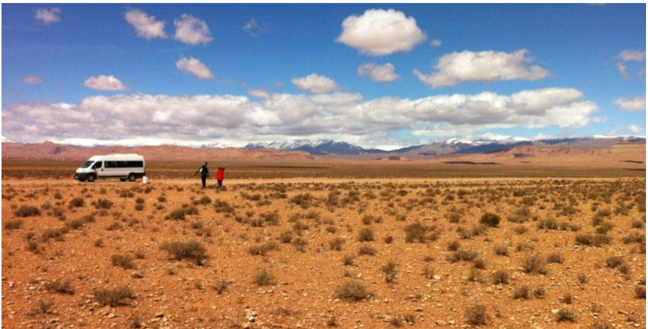
I Höga Atlas, som skymtar i fonden, letar vi efter alpina fågelarter och endemen atlasgröngöling.

Dag 1: Morgonflyg från Skandinavien till Marrakech. Transport upp till hotell nära skidorten Oukaïmeden i Atlasbergen. Natt i skidorten Oukaïmeden..