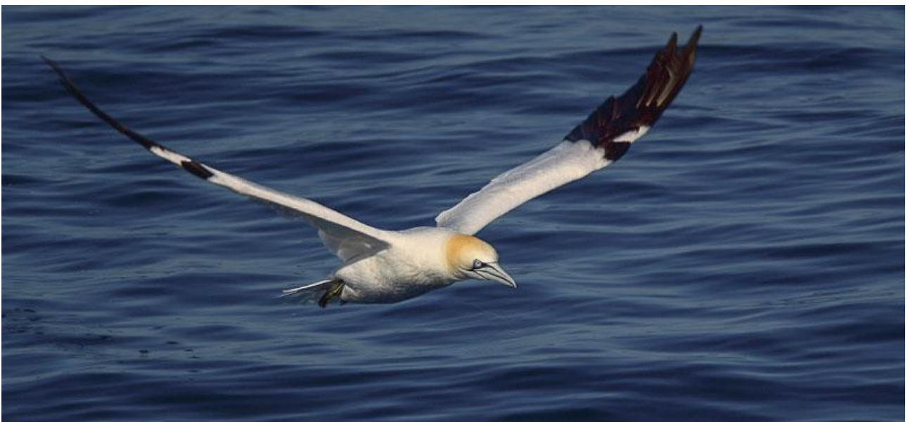
Under den planerade havsfågelturen utanför Agadir har vi chans att se havsfåglar på nära håll. Här en havssula.

Dag 7: Havsfågeltur under förmiddagen. Drygt halva dagen ägnas åt en pelagisk tur utanför Agadir. Vi åker ut med den bekväma båten M/S Aba Karim, som är chartrad enkom för oss. De har också med sig ”chum”, som används för att mata in fåglarna åt oss. Vi kan räkna med att kunna se havssulor, baleariska liror och mindre liror på närhåll, några labbar dyker säkert upp som en extra krydda, t.ex. bredstjärtad labb eller storlabb. Ute på havet serveras vi en förnämlig lunch med alla tänkbara tillbehör. Chansen är stor att vi får sällskap av några delfiner – springare är den mest sannolika arten. På eftermiddagen fortsätter vi norrut och skådar vid Tamri. Där är målarten nummer ett, eremitibis men också rödnäbbad trut står högt på önskelistan. Innan dagen är över kommer vi troligen att ha lagt till lagerlärka, diademrödstjärt, svart stenskvätta, och kanske afrikansk borstekorre på dagens artlista. Natt i Agadir.