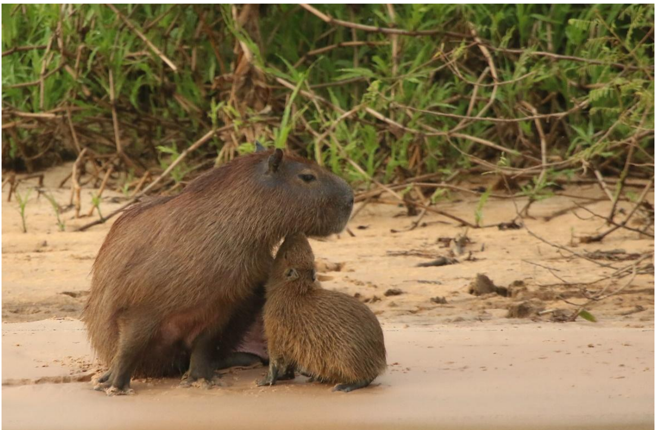
Kapybara är ett av däggdjuren vi bör stöta på.