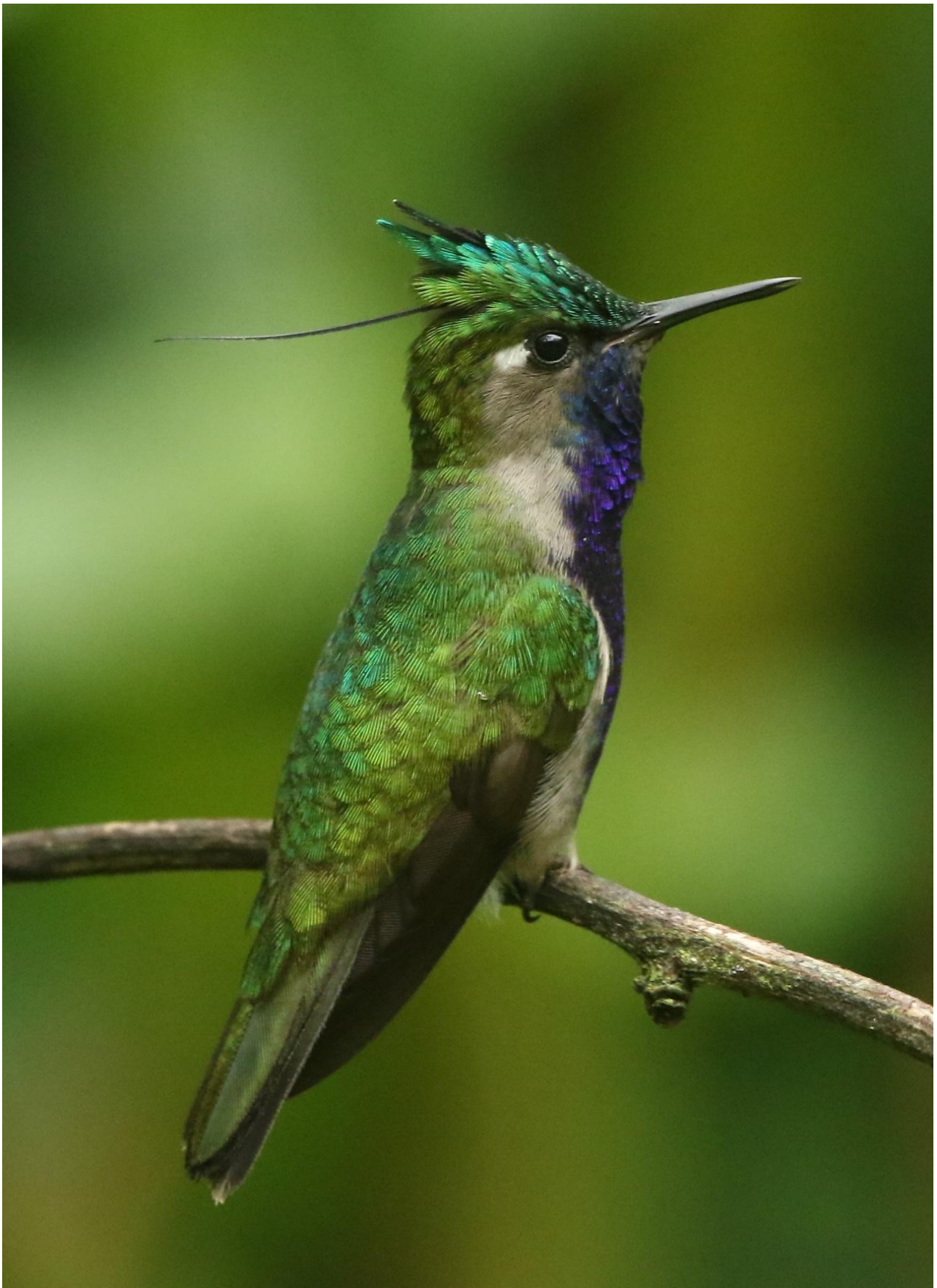
Plovercrest – en av de tjusiga kolibriarter vi kommer att se.