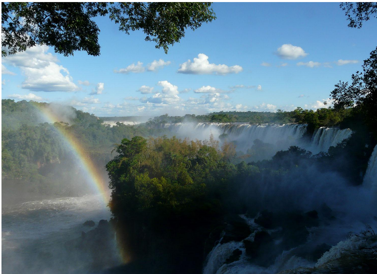
Iguazúfallen är fint invävda i frodig växtlighet.