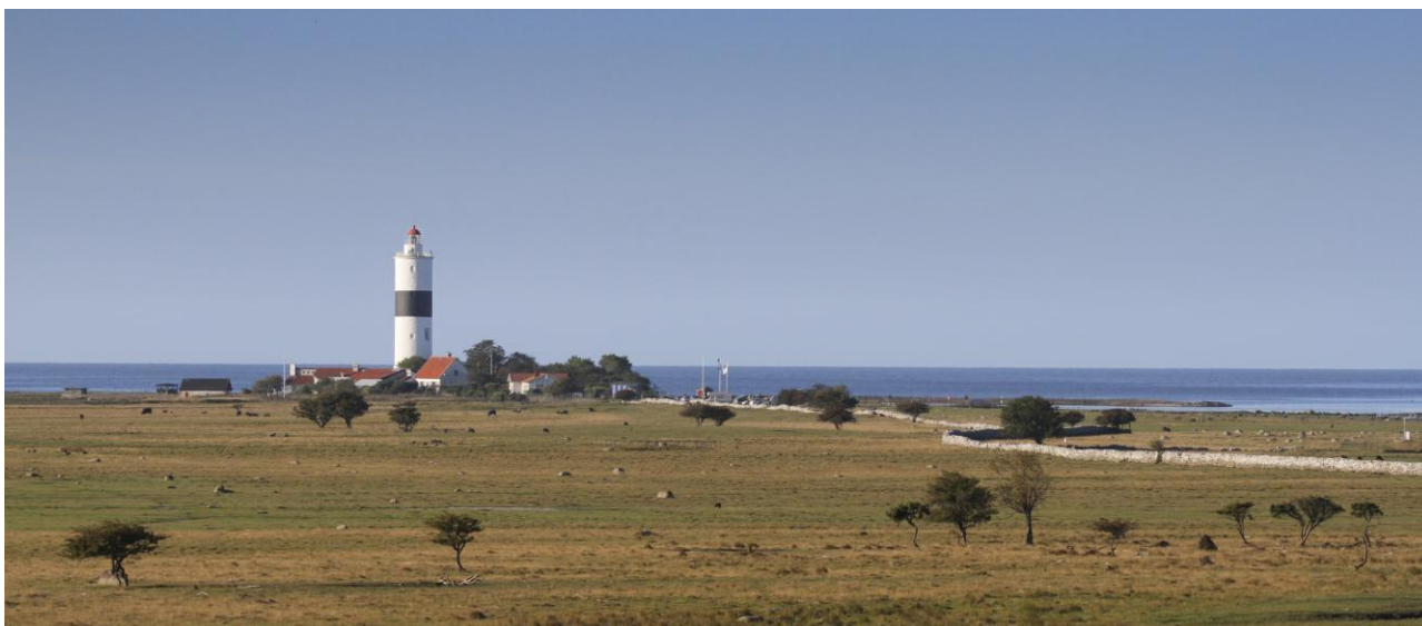
Ölands södra udde med Sveriges högsta fyr, Långe Jan. Historiska riktmärken för såväl sjöfarare som fågelskådare!