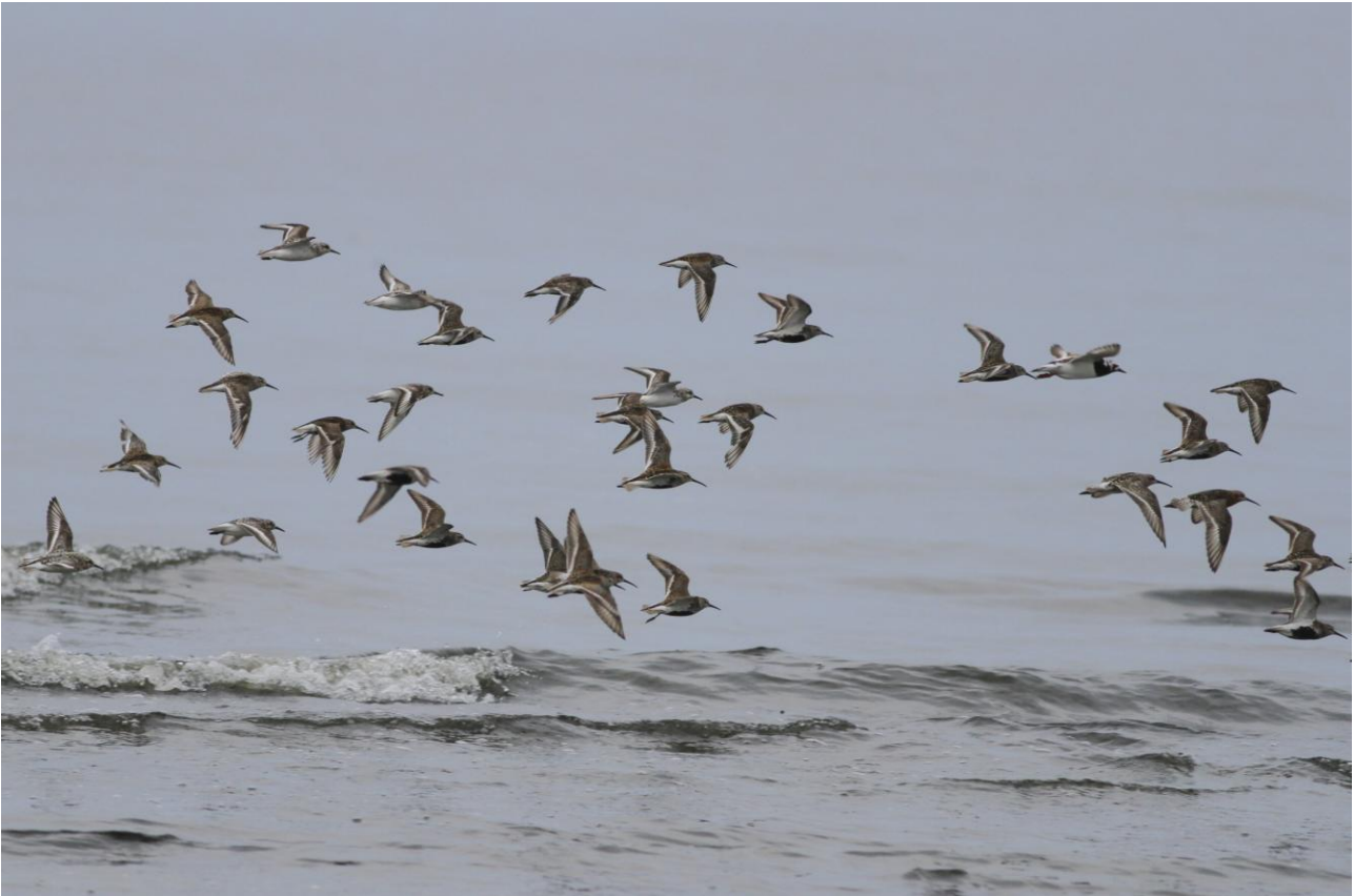
Spovsnäppa, sandlöpare och en roskarl har här gjort kärnsnäpporna sällskap.

Dag 1: Vi möts på eftermiddagen vid Kalmar centralstation, och tar oss i minibuss till Beijershamn – ett riktigt fågelparadis mindre än en halvtimme bort, och bara en knapp mil söder om brofästet på Ölandssidan. Här räknar vi med en första kontakt med många av de fågelarter vi kommer att studera under veckan som kommer: änder, vadare, rovfåglar och tättingar. Efter 2-3 timmar här fortsätter vi till vårt boende i lugna Gräsgård på sydöstra delen av ön. Naturligtvis gör vi korta stopp om vi ser något längs vägen, och så ser vi fram emot en riktigt fin middag på vårt värdshus.