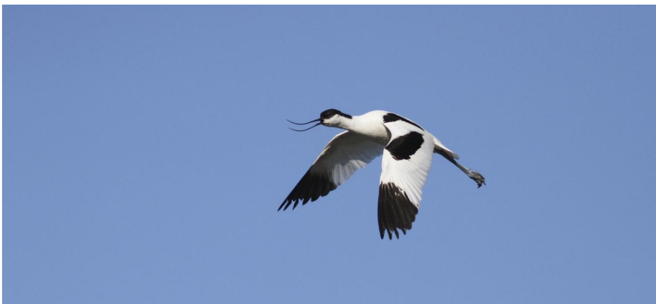
Skärfläckan, med sin märkligt uppåtböjda näbb, beskrevs som ny för vetenskapen av Linné år 1741. Efter Linnés ölandsbesök. Det öländska dialektala namnet bibehölls som svenskt artnamn!

Öland om sommaren förknippas oftast med sol och semester, men många fåglar, inte minst de arktiska vadarna från Sibiriens tundra, rastar så här års i stora mängder på väg mot sina övervintringsplatser i Afrika. Samtidigt är de flesta av de bofasta fåglarna ännu kvar, däribland exklusiva arter som skärfläcka, ängshök och rödspov.