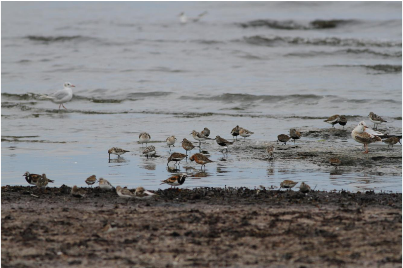
Att i lugn och ro studera vadare på närhåll vid Seby läge, med en sol som sänker sig i ryggen, är en lika härlig som lärorik upplevelse.

Gräsgård med lite möjlighet att vila upp sig innan middag. Efteråt åker vi ned till Seby läge och Gammalsbyören för att öva oss på vadare, och kanske njuta lite av kvällssträcket.