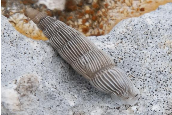
I Cava Grande fanns Muticaria syracusana, en av fyra för Sicilien unika landsnigelarter vi såg.