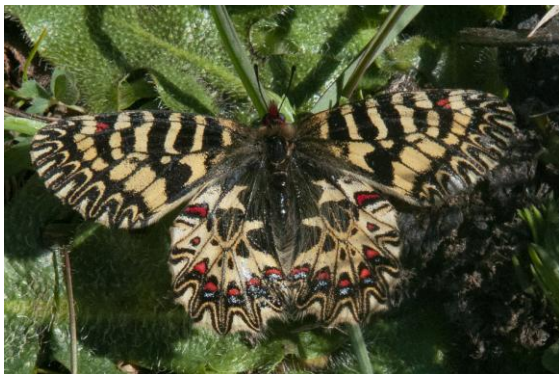
Sydlig hålrötsfjäril, en italiensk endem, var en inte ovanlig skönhet uppe i bergssluttningarna.