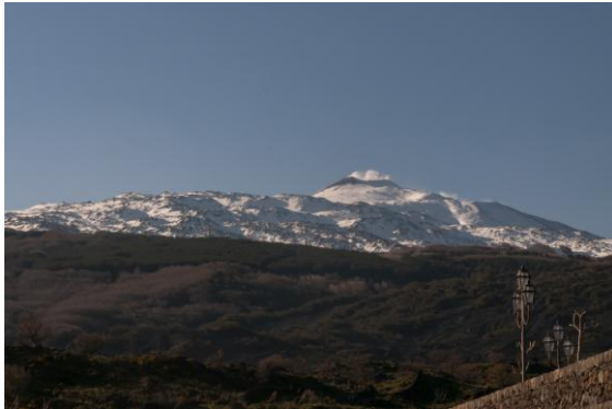
Ständigt pyrande Etna.

Resan startade på seneftermiddagen/kvällen på flygplatsen i Catania även om hela gruppen möttes redan på flygplatsen i Amsterdam! Transport till vårt boende, Etna Quota Mille, ett "agriturismo", eller mer precis ett så kallat "masseria" (gammal restaurerad gård omgjord till hotell med lokalt producerad mat) i Randazzo. En fantastisk middag väntade redan första kvällen och utanför ropade åtminstone tre dvärguvar.