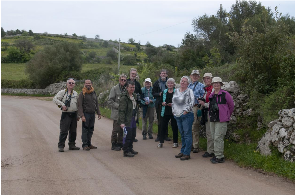
På väg mot Palazzolo Acreide fick Andrea syn på en sicilienofrys i väggkanten.