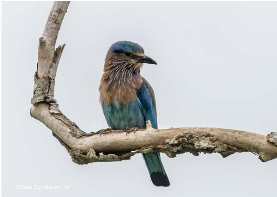
Indian Roller.