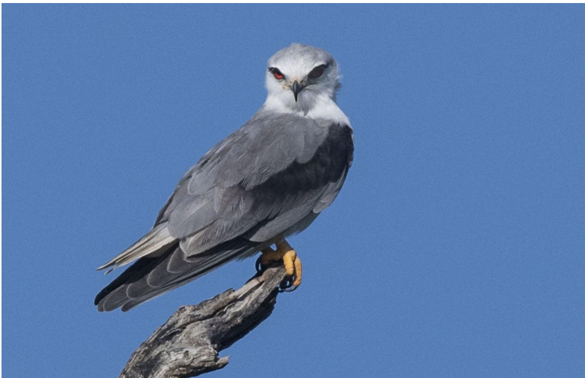
Svartvingad glada.