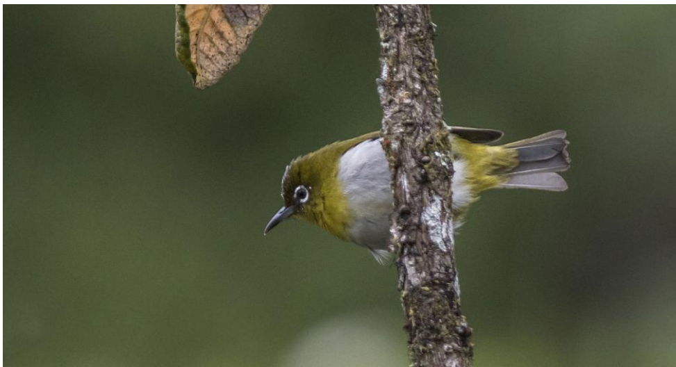
Sri Lanka White-eye, endem så klart.