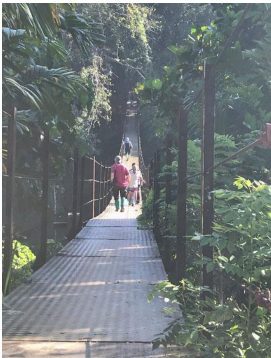
Hängbron över Kelini River.