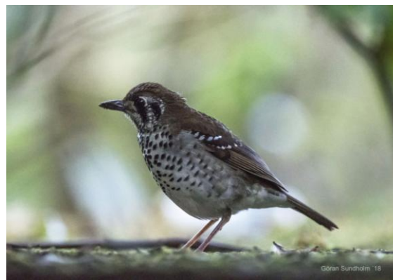
Spot-winged Thrush kom till matningen hos den fågelvänliga familjen.

Iväg före frukost till en liten by några kilometer iväg från hotellet. Vi besökte en familj som sedan flera år tillbaka utfodrar fåglar i sin trädgård. Det är tidig morgon som galler och vi var därför på plats före gryningen. Mor i huset förberedde frukosten för familjen och vi stod posterade inne i och strax utanför huset och väntade med spänning på de första matgästerna i trädgården. Det dröjde ungefär en halvtimme sedan började fåglar anlända. Först ut var några totalt orädda Spot-winged Thrushes som hoppade på nästan klappavstånd. Sedan fylldes det på i snabb följs med bl a Ashy-headed Laughingthrush, Brown-capped Babbler, Slaty-legged Crake, White-breasted Waterhen och Orange-billed Babbler. Finalen bestod av en hona Sri Lankan Spurfowl som födosökte helt öppet. Vi noterade även ett nytt däggdjur i form av Dusky-striped Squirrel. Innan vi lämnade byn gick vi en sväng längs vägen och såg bl a Velvet-fronted Nuthatch och Blue Magpie.