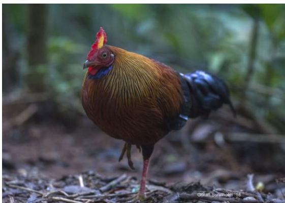
Sinharaja NP är en bra lokal för Sri Lanka Junglefowl.

Innan mörkret kom blev vi hämtade av bussen som tog oss tillbaka till vårt logi där vi förberedde oss för kvällens middag och artgenomgång.