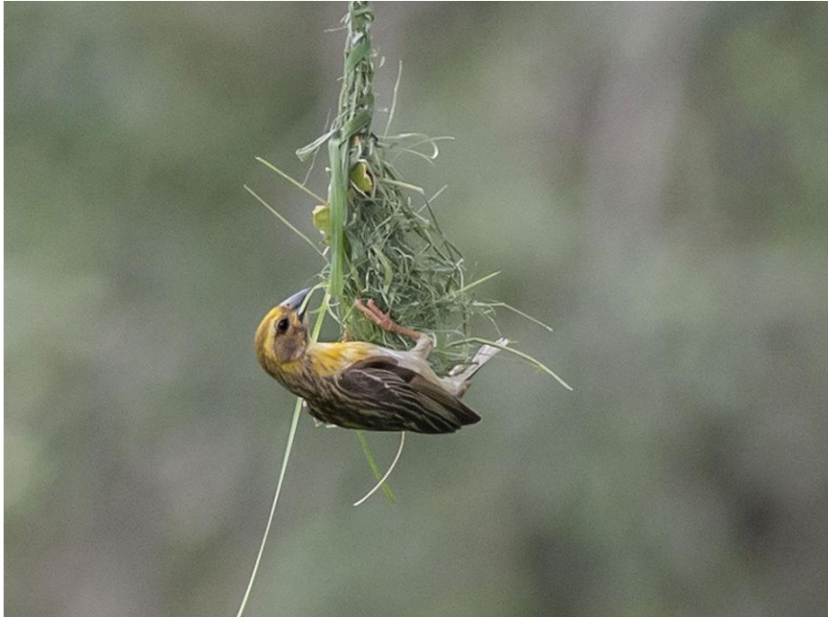
Baya Weaver. Sinharaja NP.