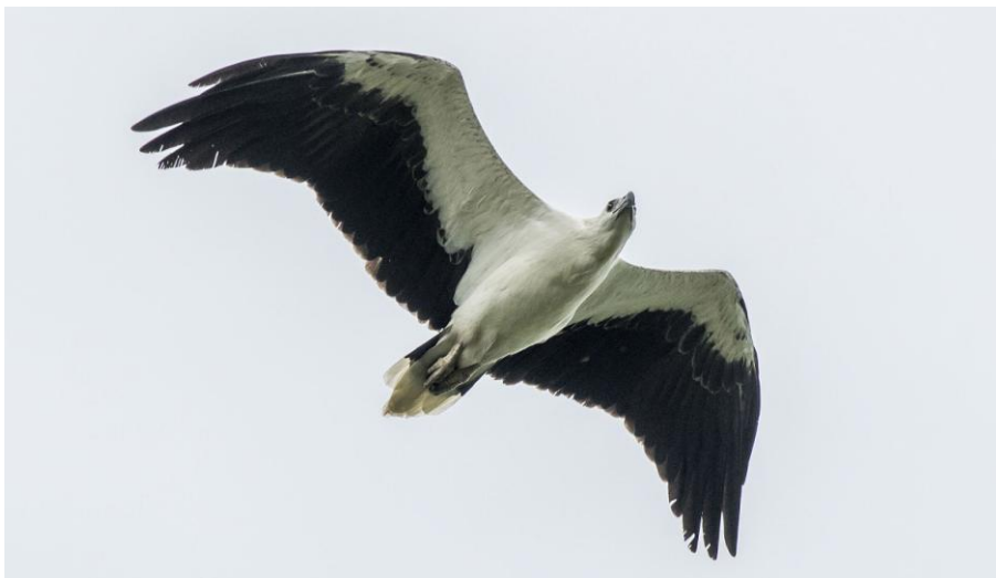
Vi såg en hel del White-bellied Sea Eagle under resan.