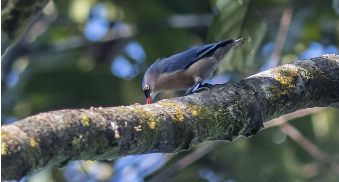
Velvet-fronted Nuthatch. Victoria Park, Nuwara Eliya.