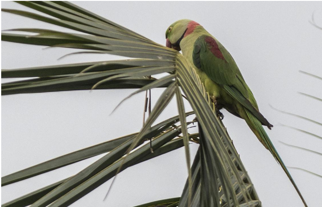
Alexandrine Parakeet. Kitulgala.