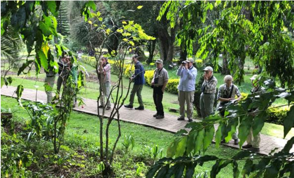
Vi spanar efter Forest Wagtail. Ictoria Park, Nuawara Eliya, Foto: Göran Pettersson