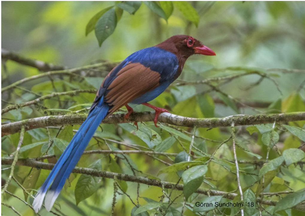
Sri Lanka Blue Magpie är något av ett signum för Sri Lankas endemiska fågelliv.