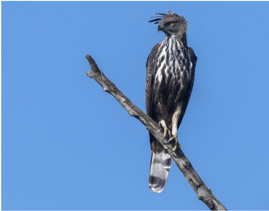
Changeable Hawk-Eagle. Udawalawe NP.