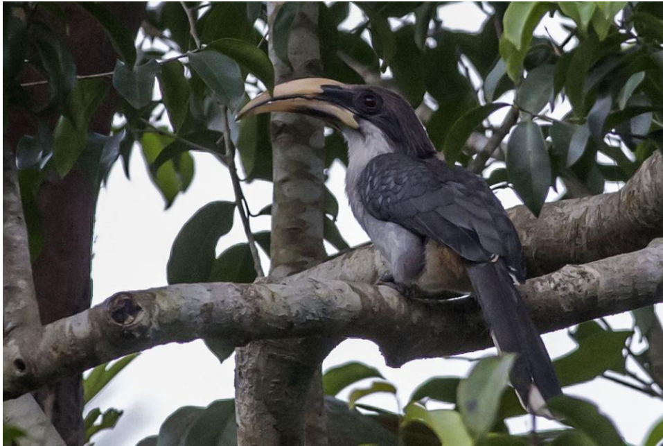
Sri Lanka Grey Hornbill.