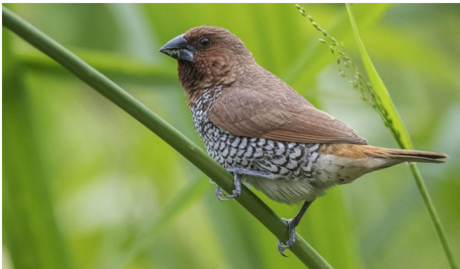
Scaly-breasted Munia.