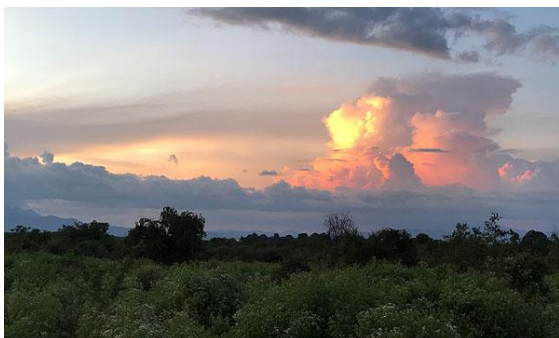
Det regnade en del på resan, särskilt på nätterna.

På kvällen middag i den lite bullriga hotellrestaurangen.