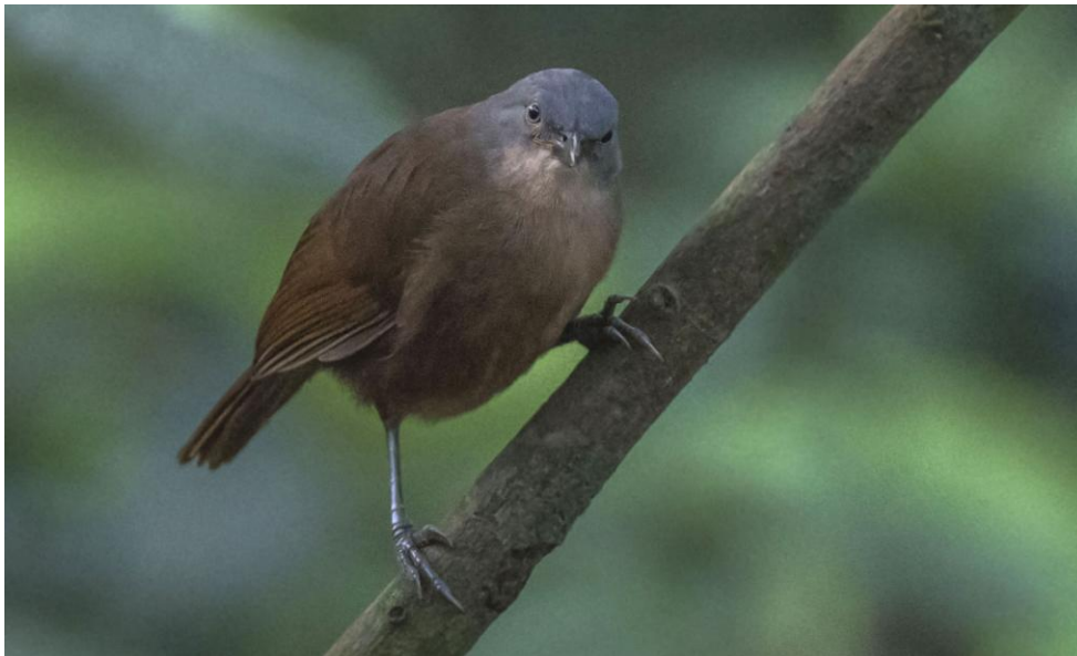
Ashy-headed Laughingthrush. Sinharaja NP.