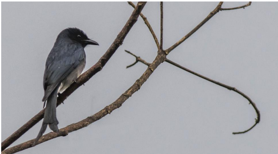
White-bellied Drongo. Den Drongo man ser mest av på Sri Lanka.