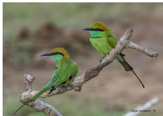
Green Bee-eater var nog den vanligaste arten i Yala NP.

På kvällen middag och artgenomgång på hotellet.