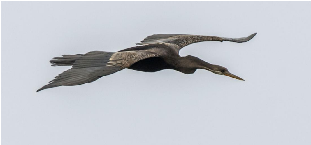
Oriental Darter sågs i de flesta större våtmarksområdena.