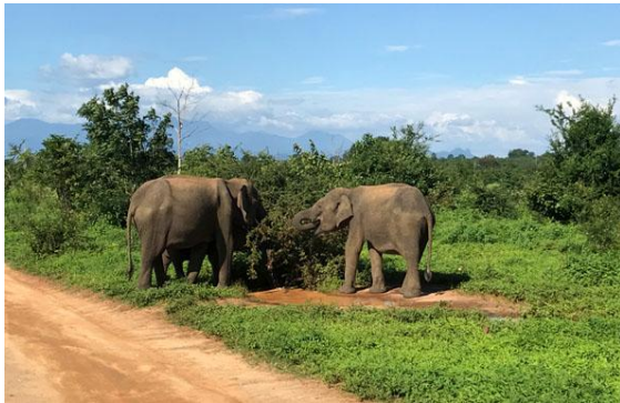
Elefanter i Udawalawe NP.

tittade på kolonin med silkes – och natthägrar. Inte att förglömma, vår bensträckare. Vi stannade vid ett litet hotell längs vägen och killen som jobbade där öppnade upp två rum så vi kunde gå på toa. Det var service!