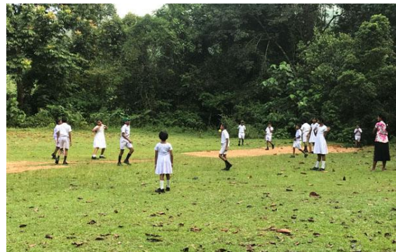
På sista skoldagen innan jullovet spelar man cricket.

På kvällen artgenomgång och middag på vårt hotell.