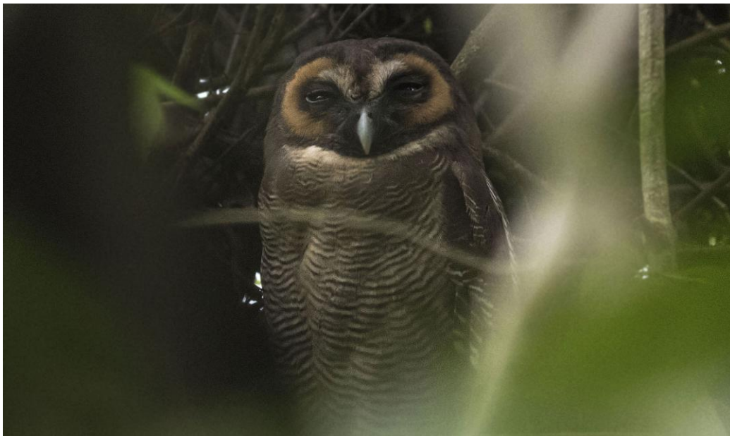
Brown Wood Owl. Surrey BS.