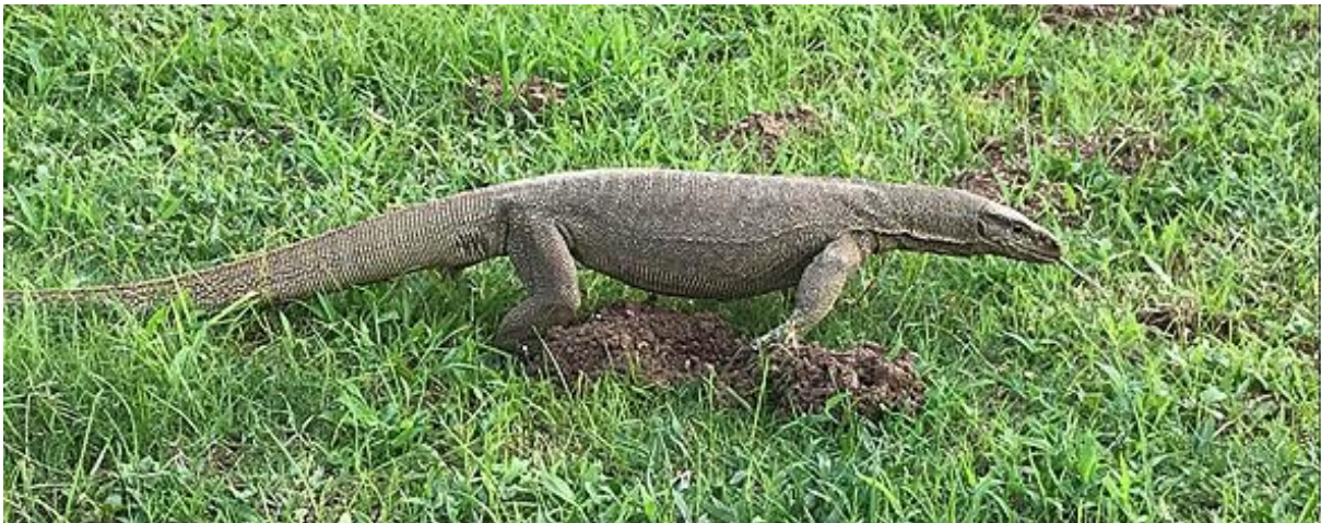
Bengal Monitor. Galle.