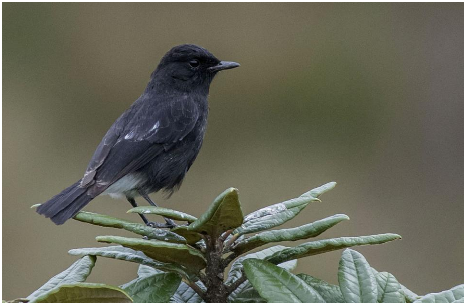
Pied Bushchat, hane. Horton Plains.