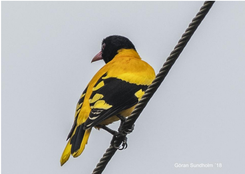
Black-hooded Oriole hördes och sågs ofta under resan.