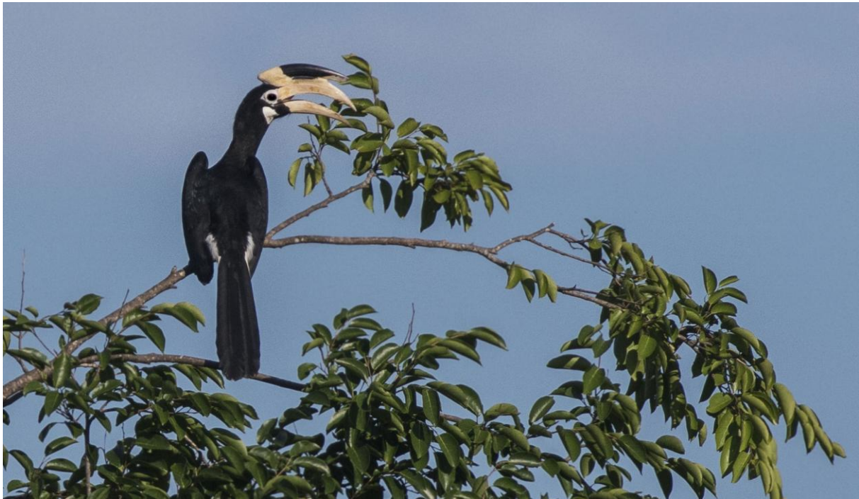
Malabar Pied Hornbill. Udawalawe NP.