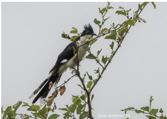
Jacobin Cuckoo.