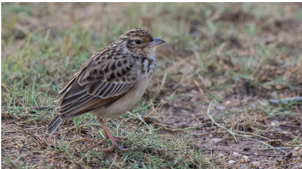
Jerdon's Bush Lark. Finns bara på Sri Lanka och i Sydindien.