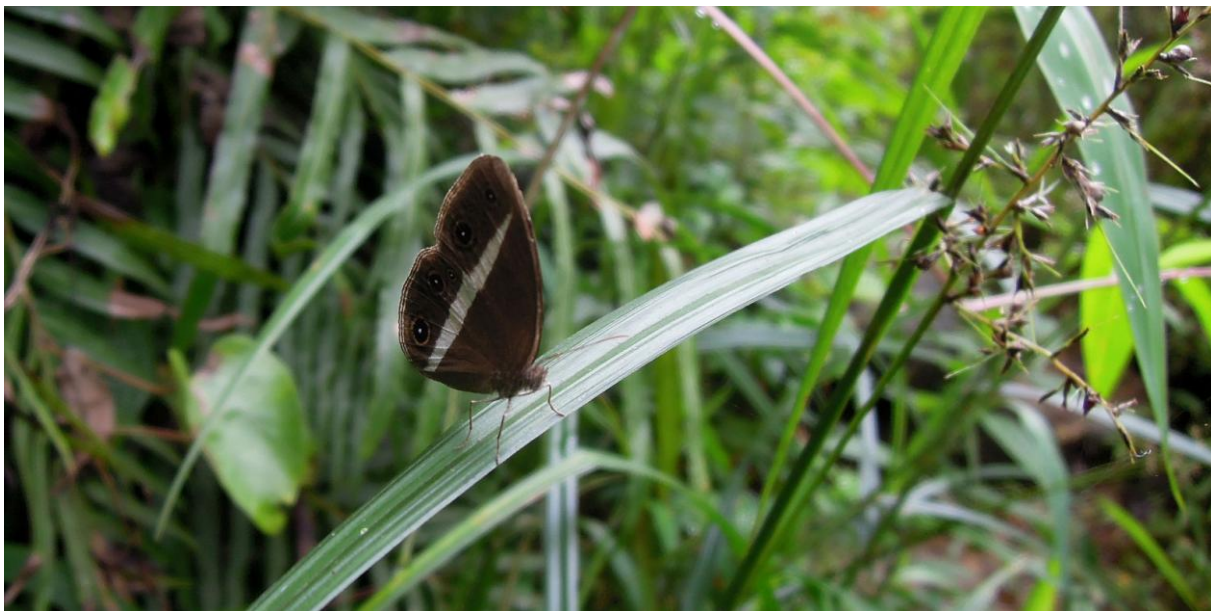
Dusky Bush-brown Orsotriaena medus . Kitulgala.