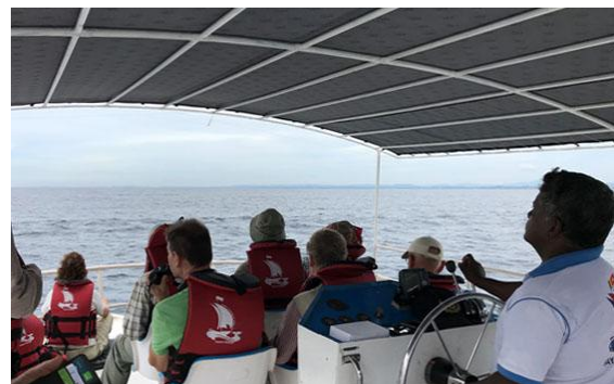
På valtur.

Vi antrade vår båt Sayuri i Mirissas hamn och stävade söderut mot öppet hav. Det var ett tiotal båtar som var mer eller mindre fyllda med förväntansfulla turister. Det är big business med valskådning på Sri Lanka. Det dröjde inte länge förrän vi såg en Bryde's fenväl som vände vid vattenytan, och strax därpå var de två. Kul! Vi fortsatte längre ut och till sist nådde vi så långt ut att de fiskande tärnorna försvann (skägg- och tofstärna). Några i fören av båten såg en bortflygande gammal White-tailed Tropicbird, en art som är sparsam i området. Då dök plötsligt en liten grupp späckhuggare upp. Vi kunde se två vuxna honor och en hane. Det var årets andra fynd för säsongen och första gången vår guide Indika fick se arten. Jättekul! Det här blev också vår vändpunkt för båtturen. Det var en handlinglös återfärd bortsett från ett tiotal tygeltärnor som jagade förbi.