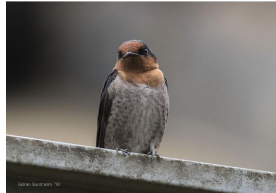
Vid parkcentrat i Horton Plains NP såg vi Hill Swallow.

Bushchats visade sig. Black Eagle och tofsbivräk skruvade i skyn. En högst oväntad fiskgjuse 6 satt i toppen av en torraka. Så småningom återvände vi till hotellet för lunch och paus.