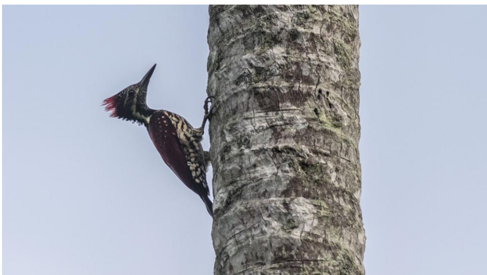
Red-backed Flameback. Ny endem för Sri Lanka.