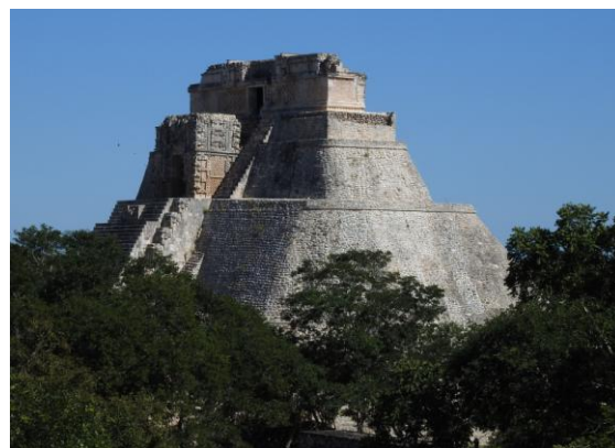
"Pyramid of the Magician", Uxmal.

Tillbaka för frukost och sedan besök ett par timmar vid de fina Maya-lämningarna i Uxmal. Lämningarna är fint restaurerade och man får verkligen inblick i hur livet kunde ha sett sig här för drygt tusen år sedan. Givetvis blev vi guidade på plats av en mycket kunnig David! Vi klämde också in ett par nya researter i form av Turquoise-browed Motmot och Cave Swallow som häckar i de gamla byggnadsverken.