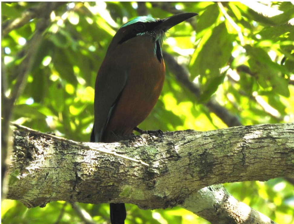
Turquoise-browed Motmot. Uxmal.