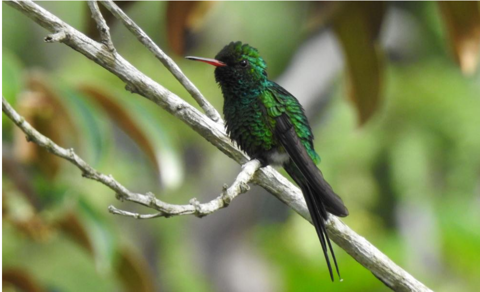
Cozumel Emerald. Cozumel.