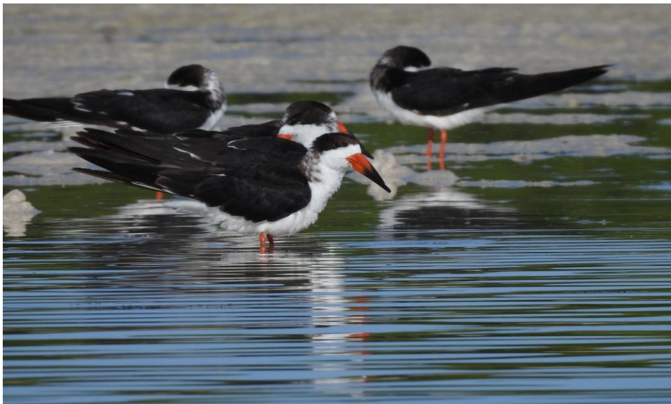
Black Skimmer. Río Lagartos.