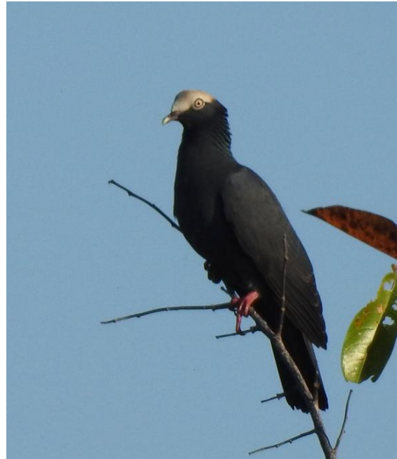
White-crowned Pigeon, en typisk karibisk art.

Morgon norr om staden och nu hittade vi äntligen White-crowned Pigeon, dessutom med hela 15 ex. Därefter tillbaka till hotellet för utcheckning och sedan färjan tillbaka till fastlandet.