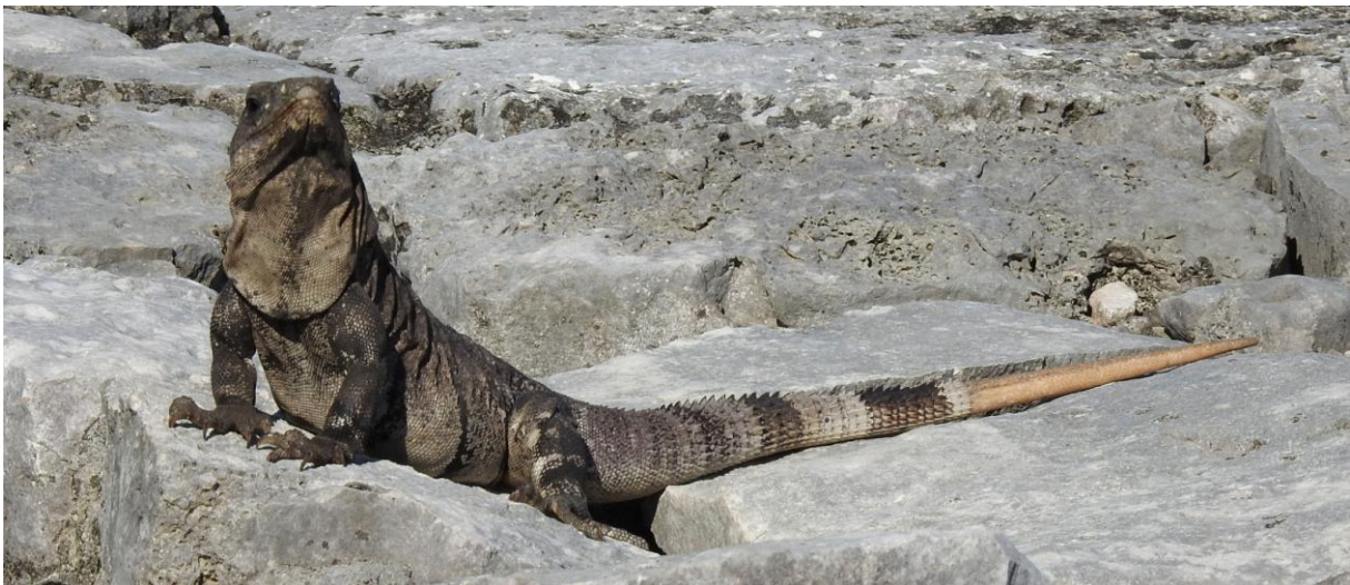
Black Iguana. Tulum.