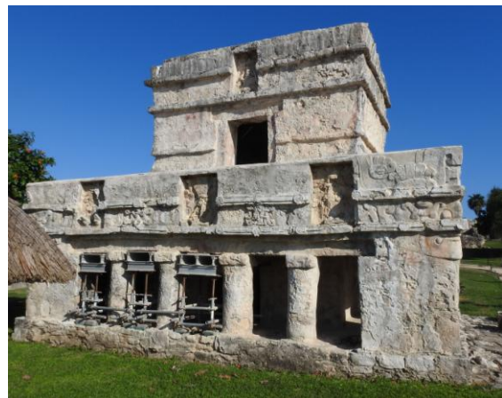
Maya-lämningar i Tulum. Här ser man på ovanvåningen den märkliga byggnadstekniken att basen är smalare än toppen.

Vi körde söderut och lunchade i Tulum på en av resans bästa restauranger. Eller snarare hak, det såg inte mycket ut för världen. Men så god mat. Efter lunchen besökte vi de intressanta Maya-lämningarna just utanför Tulum. David berättade initierat om Maya-folkets historia. Kan nämna att nu var det riktigt varmt ute.