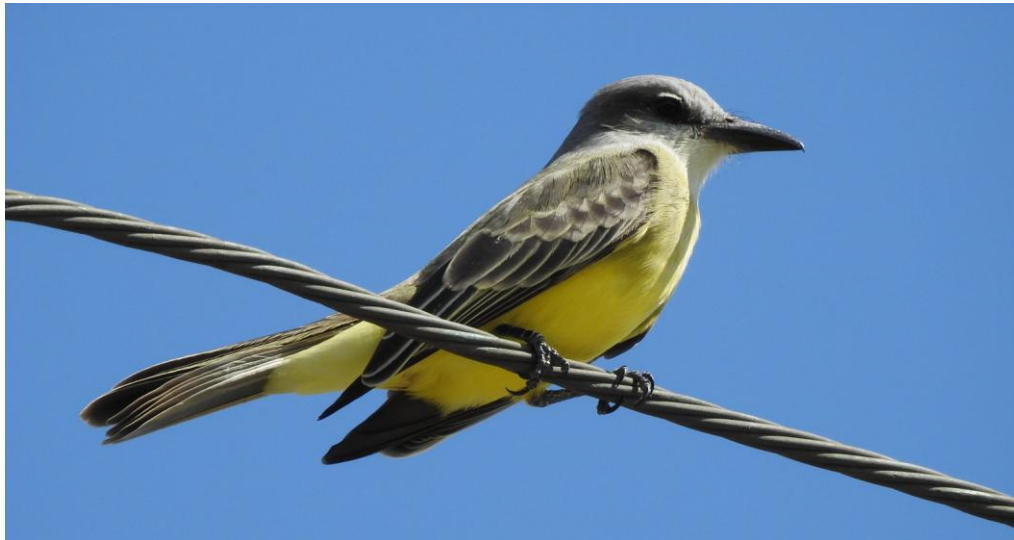
Tropical Kingbird. Cozumel.