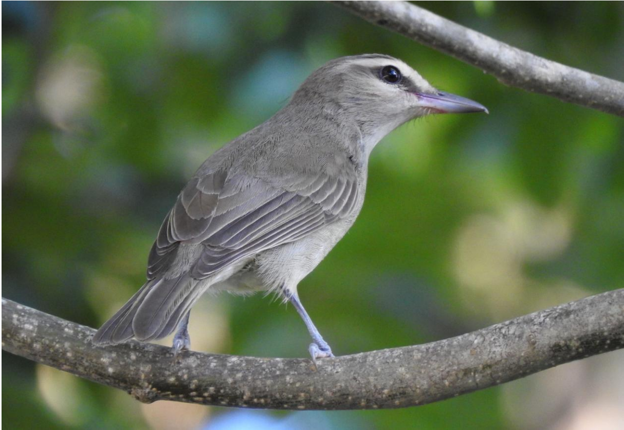
Yucatan Vireo, endem för Yucatánhalvön. Cozumel.