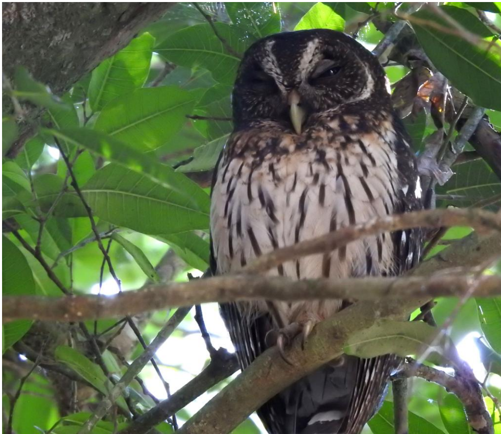
Mottled Owl. Calakmul.