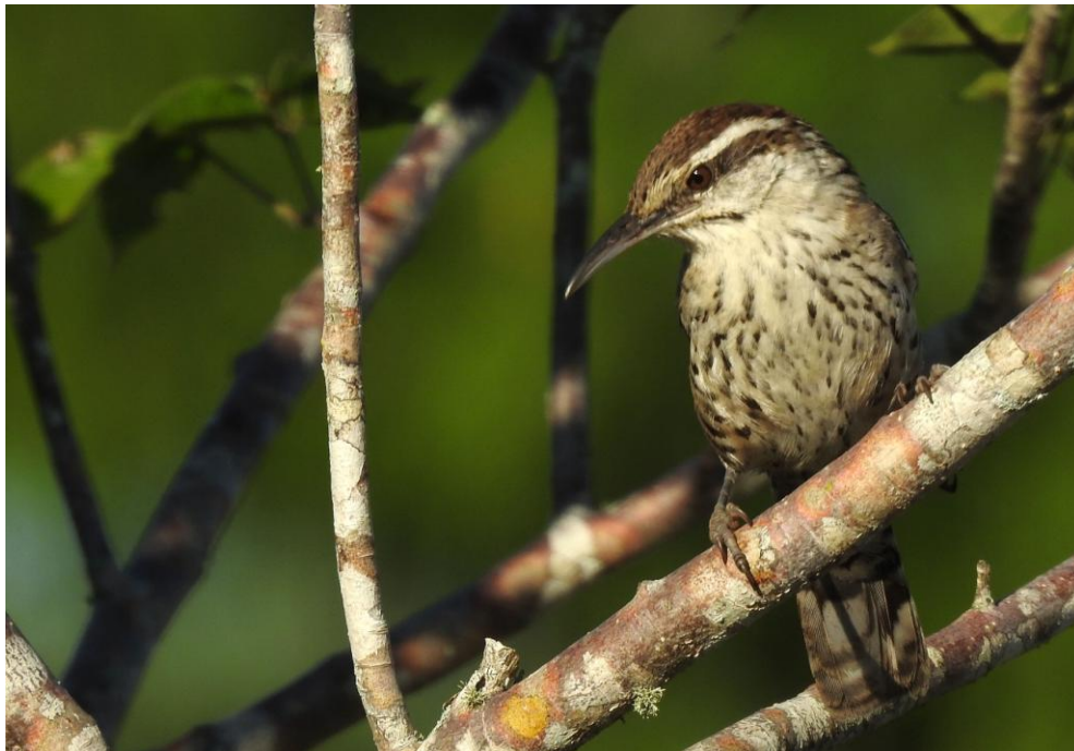
Yucatan Wren. Río Lagartos.