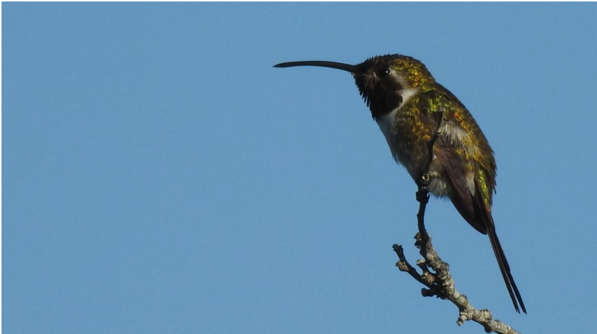
Mexican Sheartail. Río Lagartos.