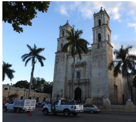
Katedralen San Servacio i Valladolid.

Vi stävade på med bussen mot Cancún och gjorde ett kort shoppingstopp i Valladolid. Här fanns möjlighet att handla med sig minnen eller presenter hem, eller att göra ett besök i stadens Katedral, san Servacio.