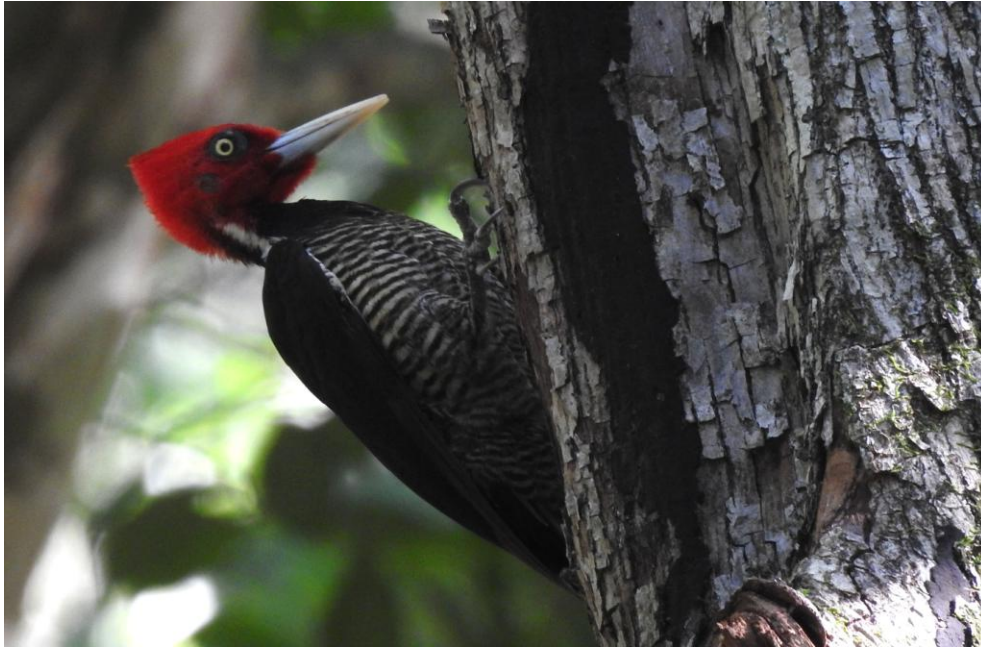
Pale-billed Woodpecker. Calakmul.