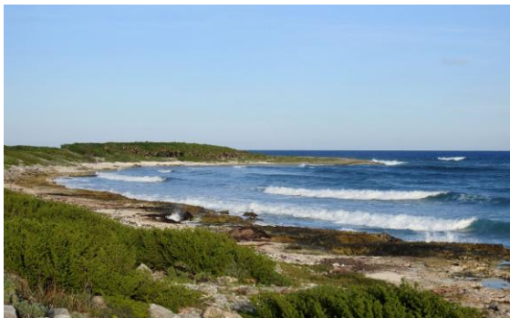
Östkusten på Cozumel.

Efter frukost körde vi tillbaka till gårdagens villakvarter och fick se flera intressanta arter och underarter, bl a den endemiska rasen för House Wren och Caribbean Dove. Därefter vände vi kosan norrut och körde till vägs ände. Mycket vatten på den sandiga vägen vi åkte på, men det gick bra. Vi hade flyt och fick se den endemiska Pygmy Raccoon, vars population anges till 192 (!) individer (enligt IUCNs Red List). Det ser således mycket dystert ut för artrens framtida överlevnad.