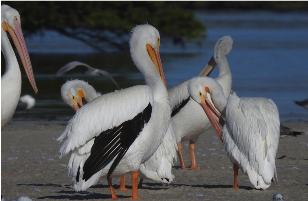
American White Pelican. Río Lagartos.