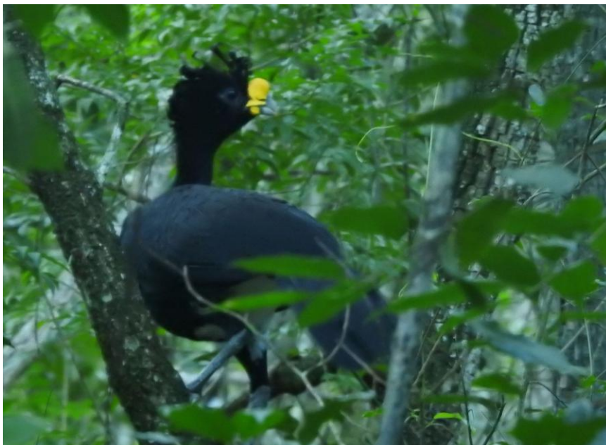
Great Curassow, en av de häftigaste arterna att få se på resan.