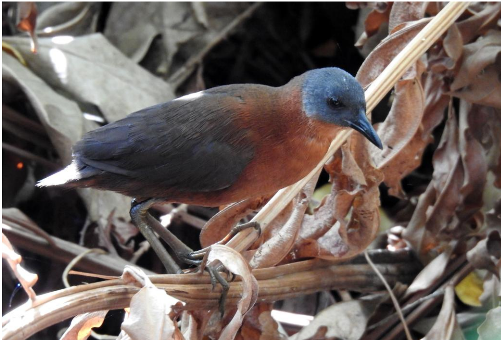
Ruddy Crane. Cozumel.