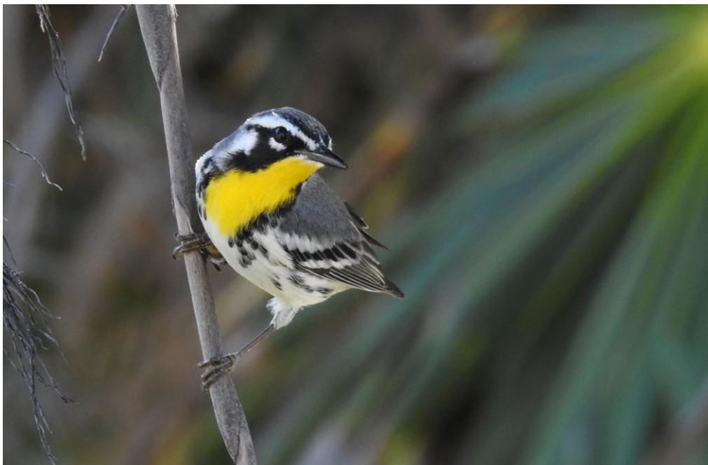
Yellow-throated Warbler. Tulum. Foto: Göran Pettersson