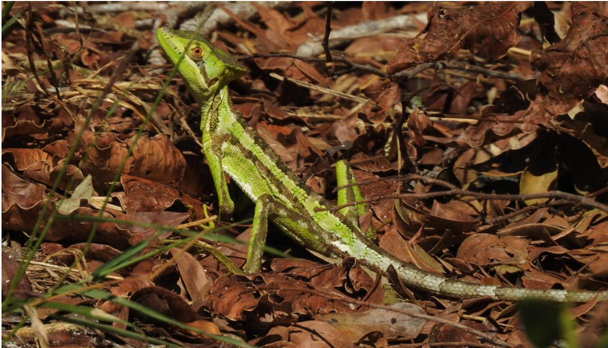
Serrated Casquehead Iguana. Dzilam de Bravo.