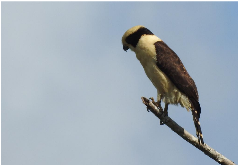
Laughing Falcon.