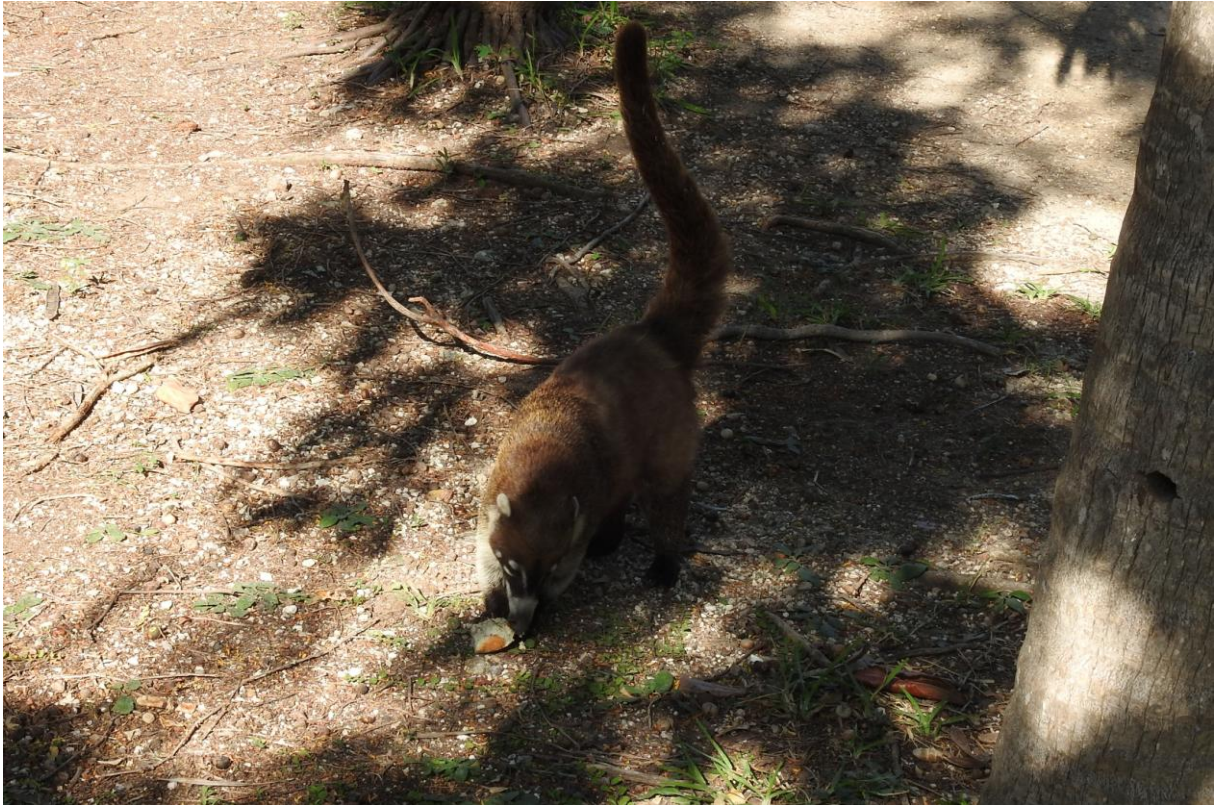
White-nosed Coati. Tulum.