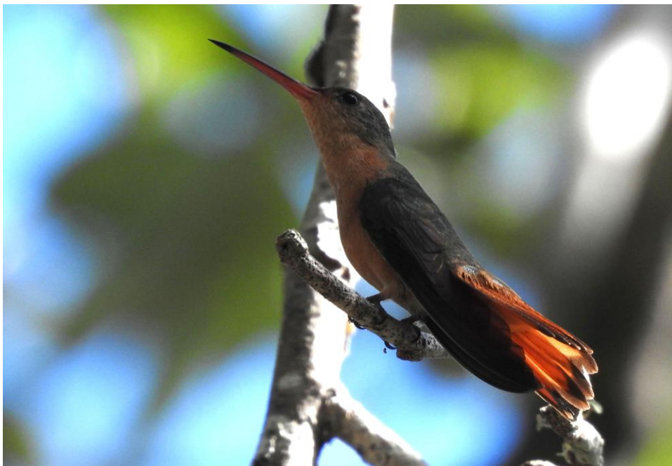
Cinnamon Hummingbird. Uxmal.