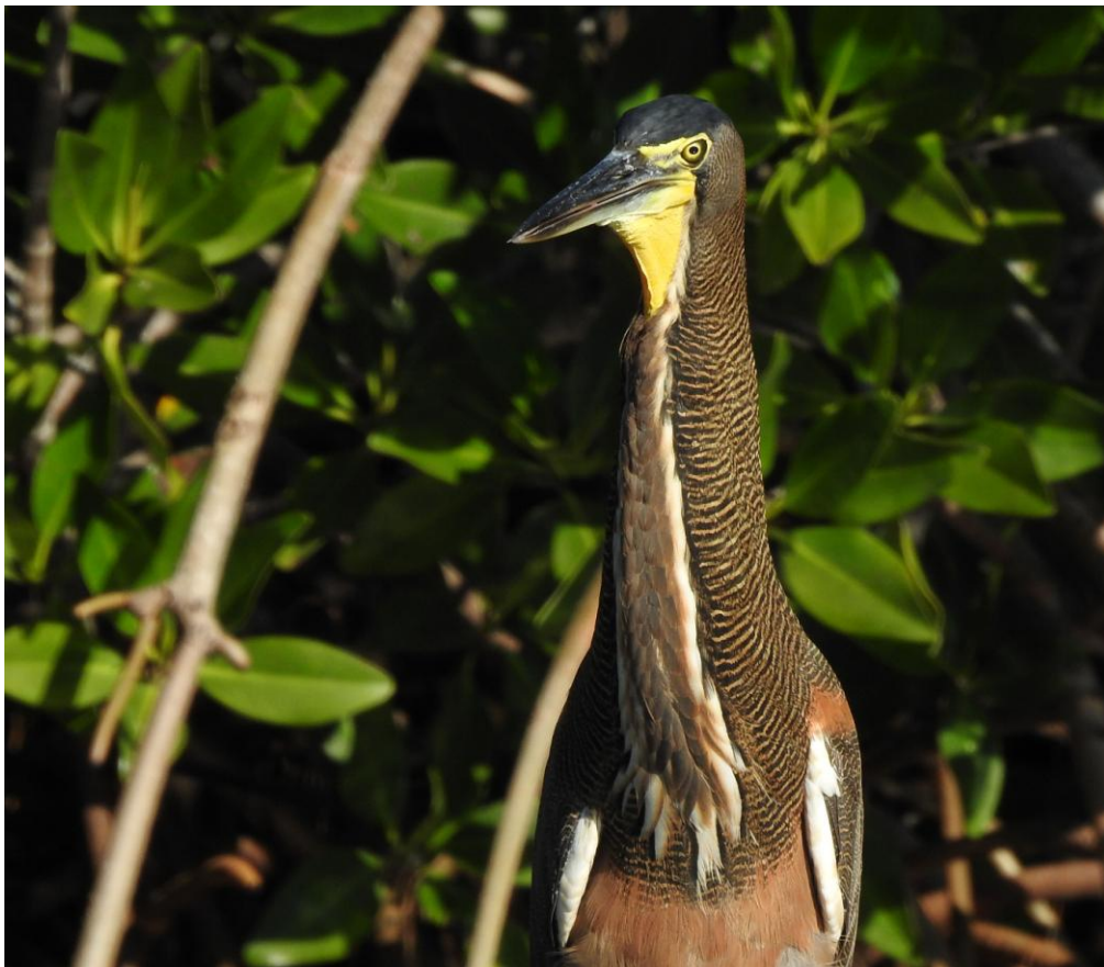
Bare-throated Tiger Heron. Río Lagartos.