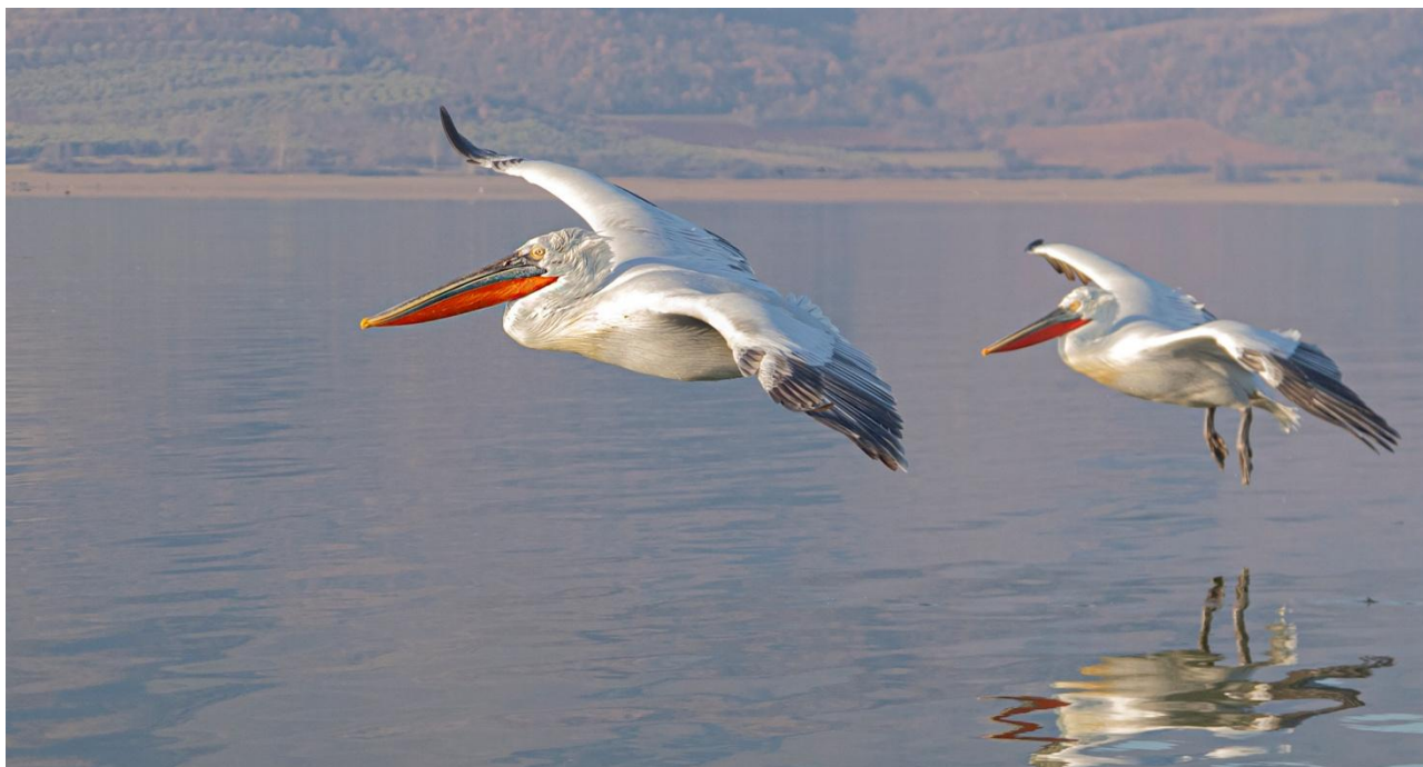
Krushuvade pelikaner går in för landning i Kerkinisjön.