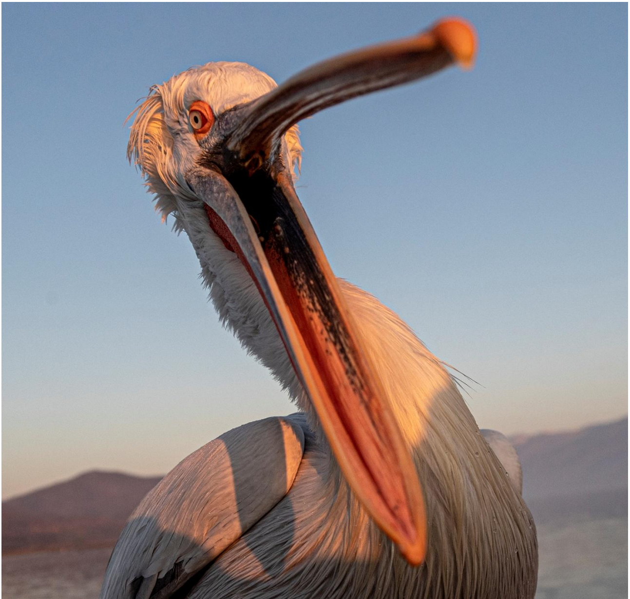
Den krushuvade pelikanen gapar och gör sig till.

Strapatser och tempo. Det är inga särskilda strapatser inplanerade på resan. När vi gör båtutflykt på sjön är det bra att ha skodon som inte har glatt sula, utan som griper fast ordentligt. Det kan vara fuktigt på båtdäcket.