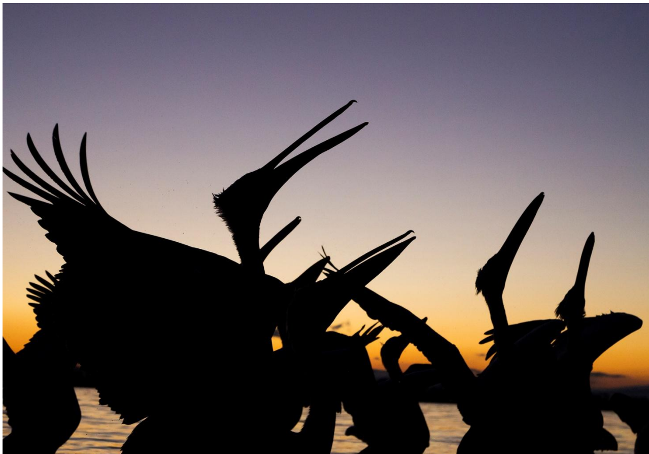
Krushuvade pelikaner i gryningsljus. Kerkinisjön.