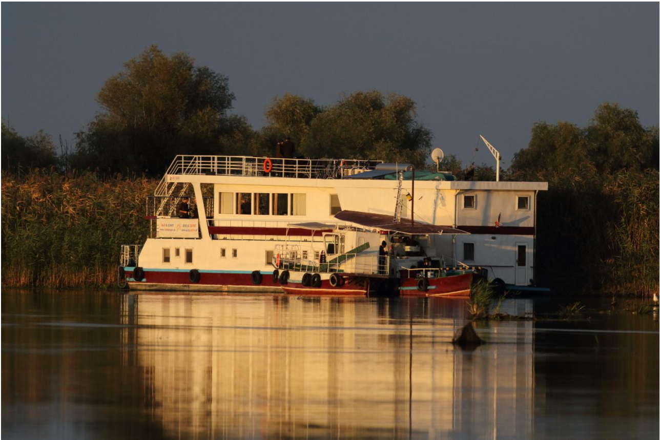
Vår hotellbåt i Donaudeltat.