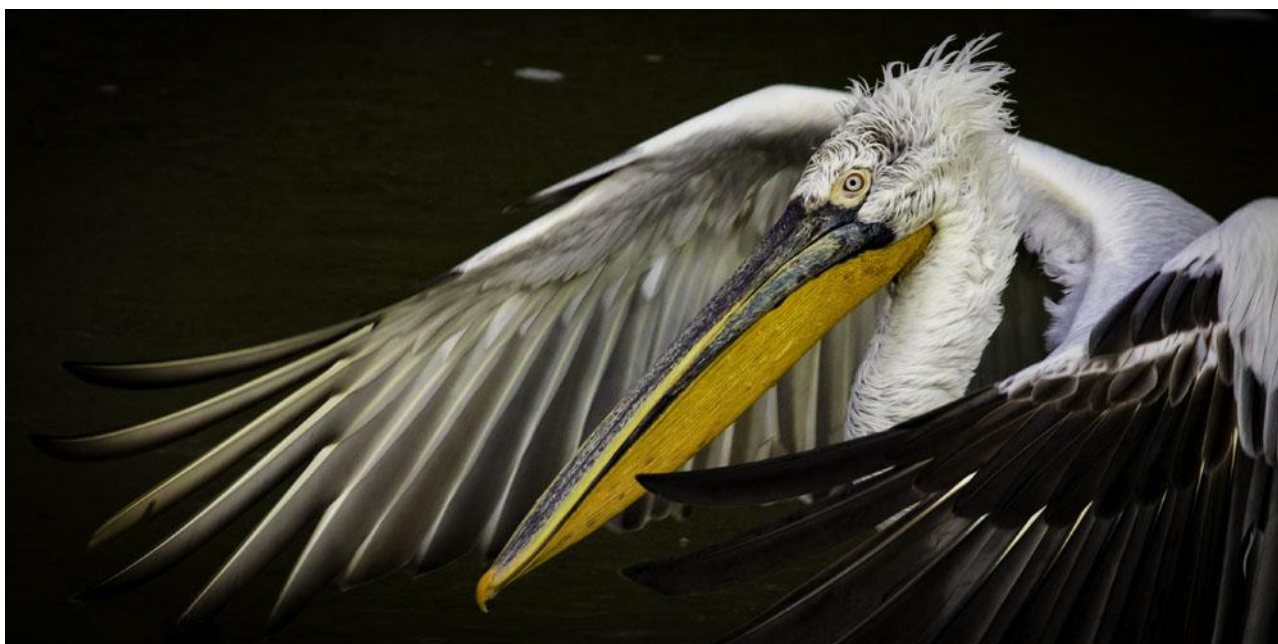
Krushuvad pelikan, en av många häftiga arter vi träffar på i Donaudeltat.