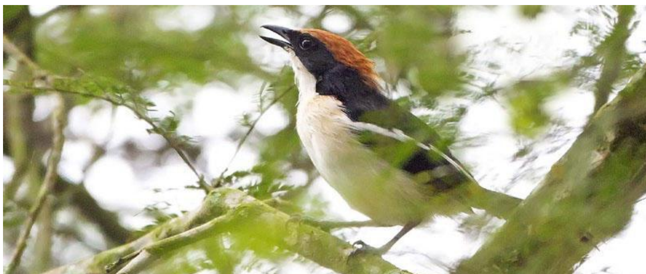
Gabela Bushshrike, endem för Angola.