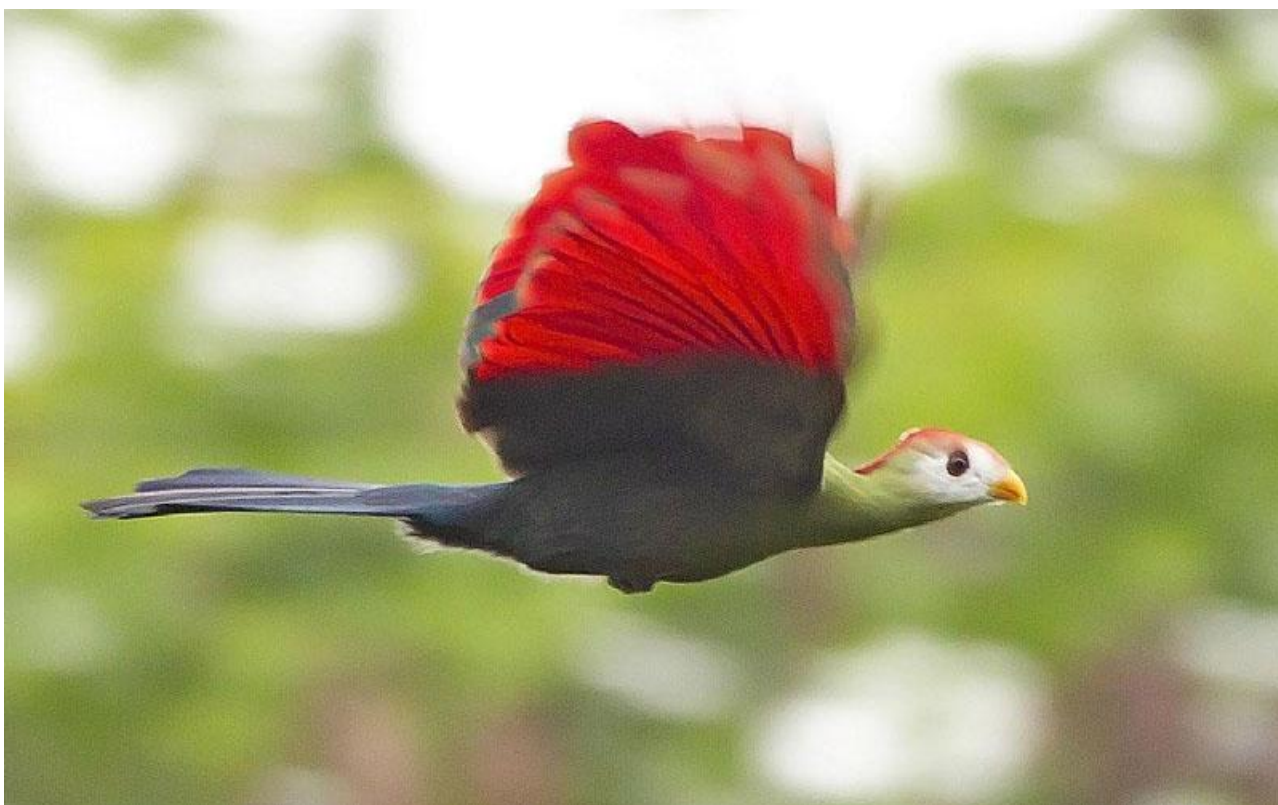
Red-crested Turaco, endem för Angola.