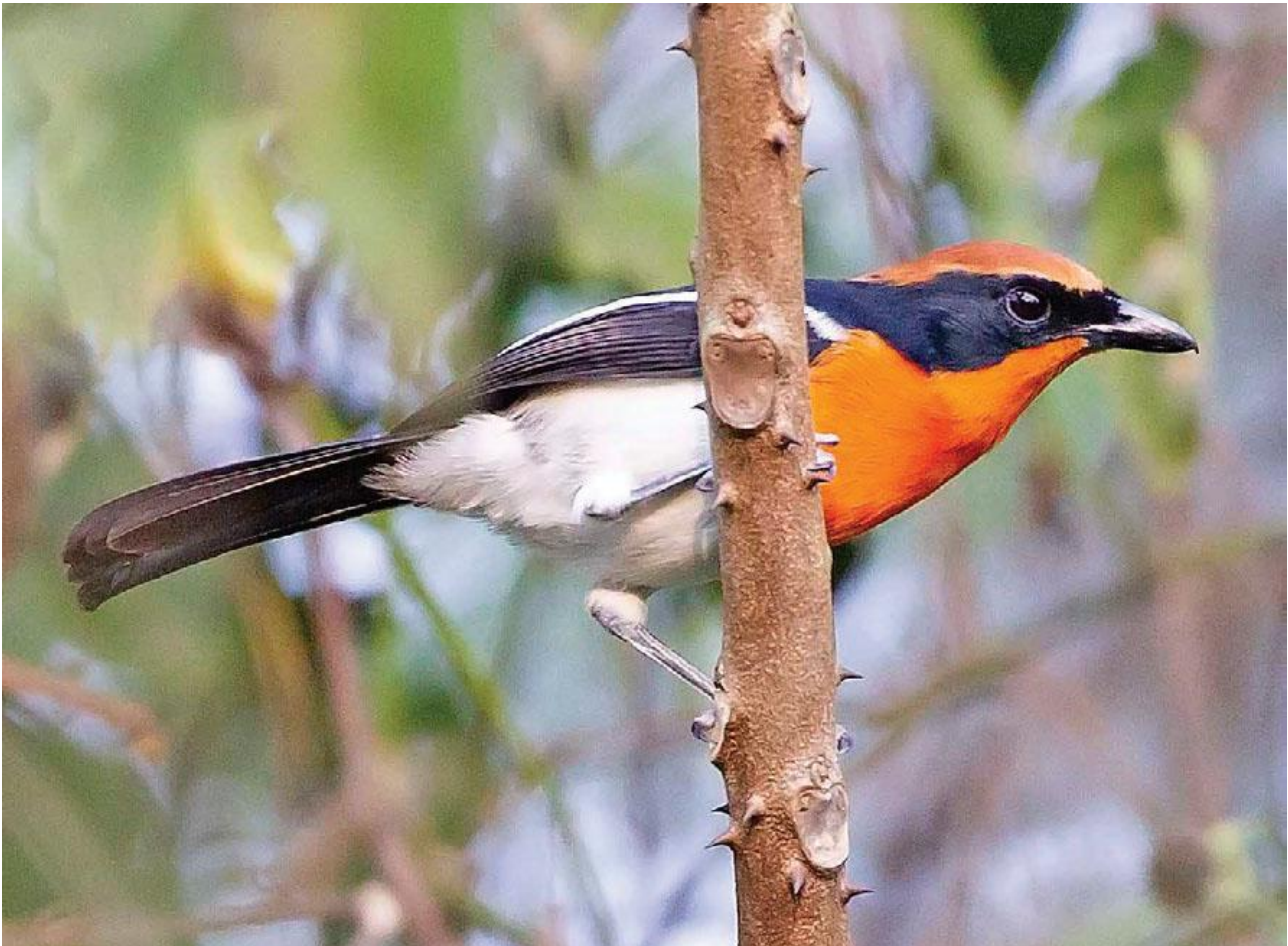
Braun´s Bushshrike, endem för Angola.