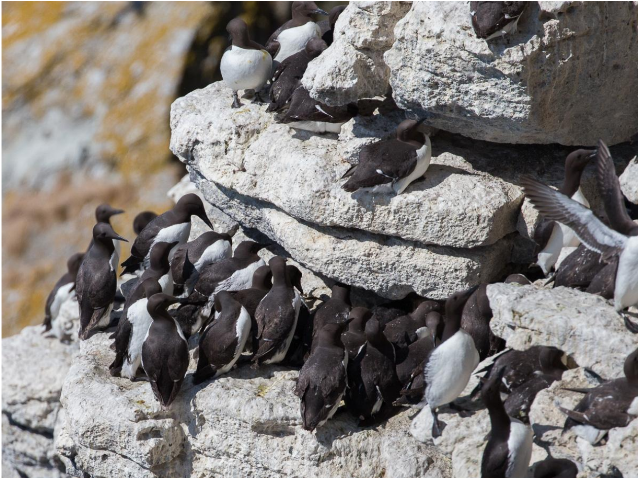
Sillgrisslor på Stora Karlsö.