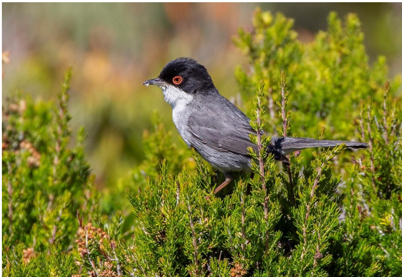
Sammethättan hör till macchians och stickiga täta buskage.