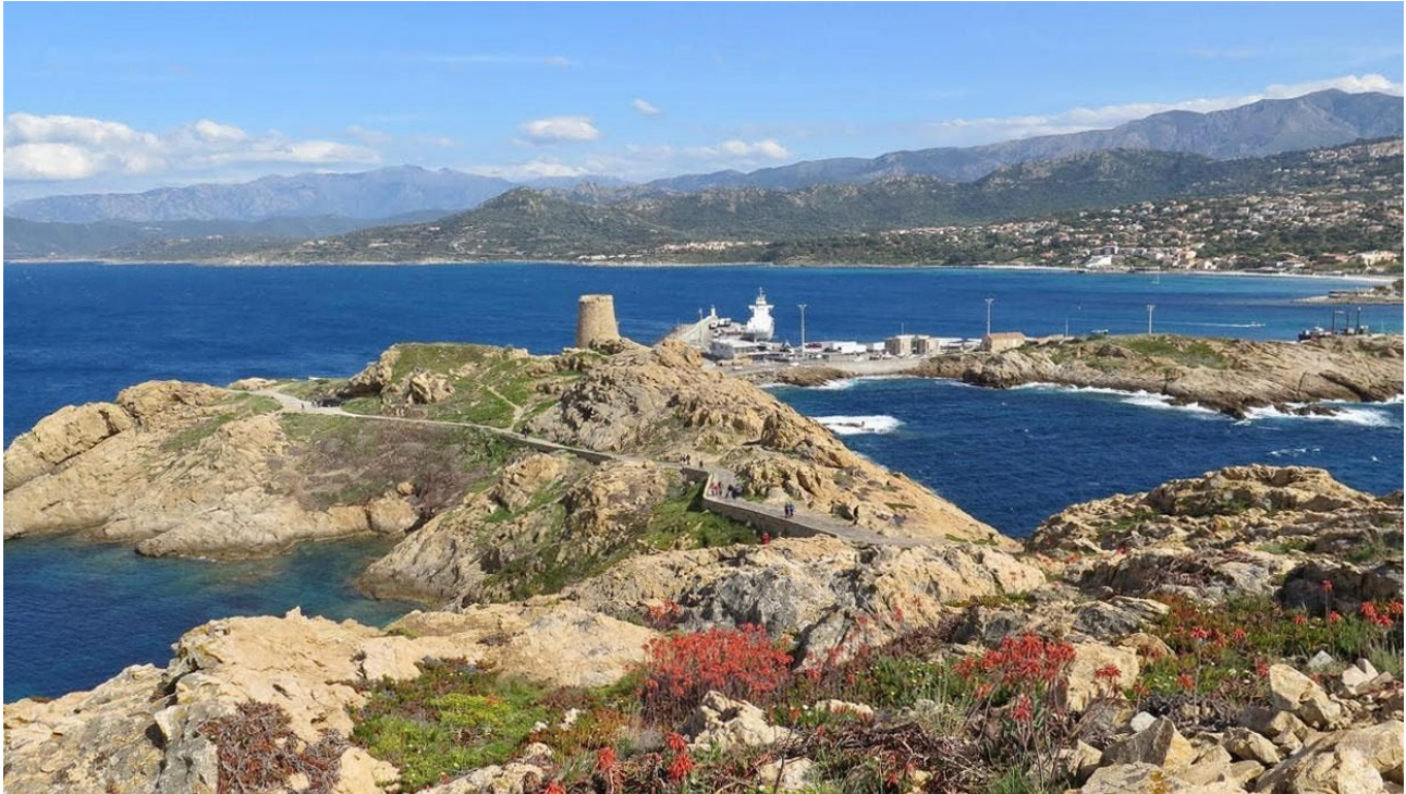
Pietra och hamnen i L'Île-Rousse.

Hela veckan bor vi på Resort Napoléon Bonaparte, ursprungligen ett slott och med en fin hotellträdgård som hyser såväl svart stare som italiensk sparv. Härifrån gör vi dagliga utflykter.