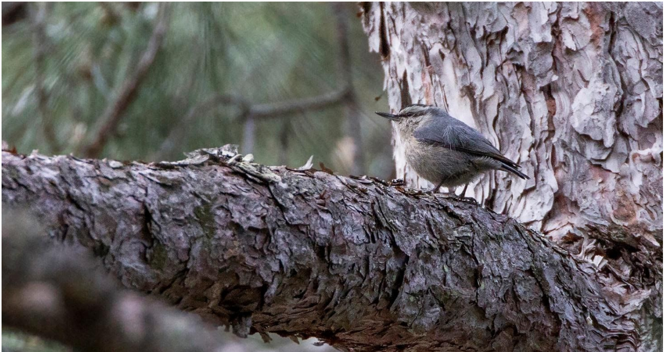
Korsikansk nötväcka. Som namnet antyder finns arten endast på Korsika.

De flesta dagar blir det korta körsträckor, men det kan ändå innebära någon timme eller mer i bilen eftersom de korsikanska vägarna är långsamma.