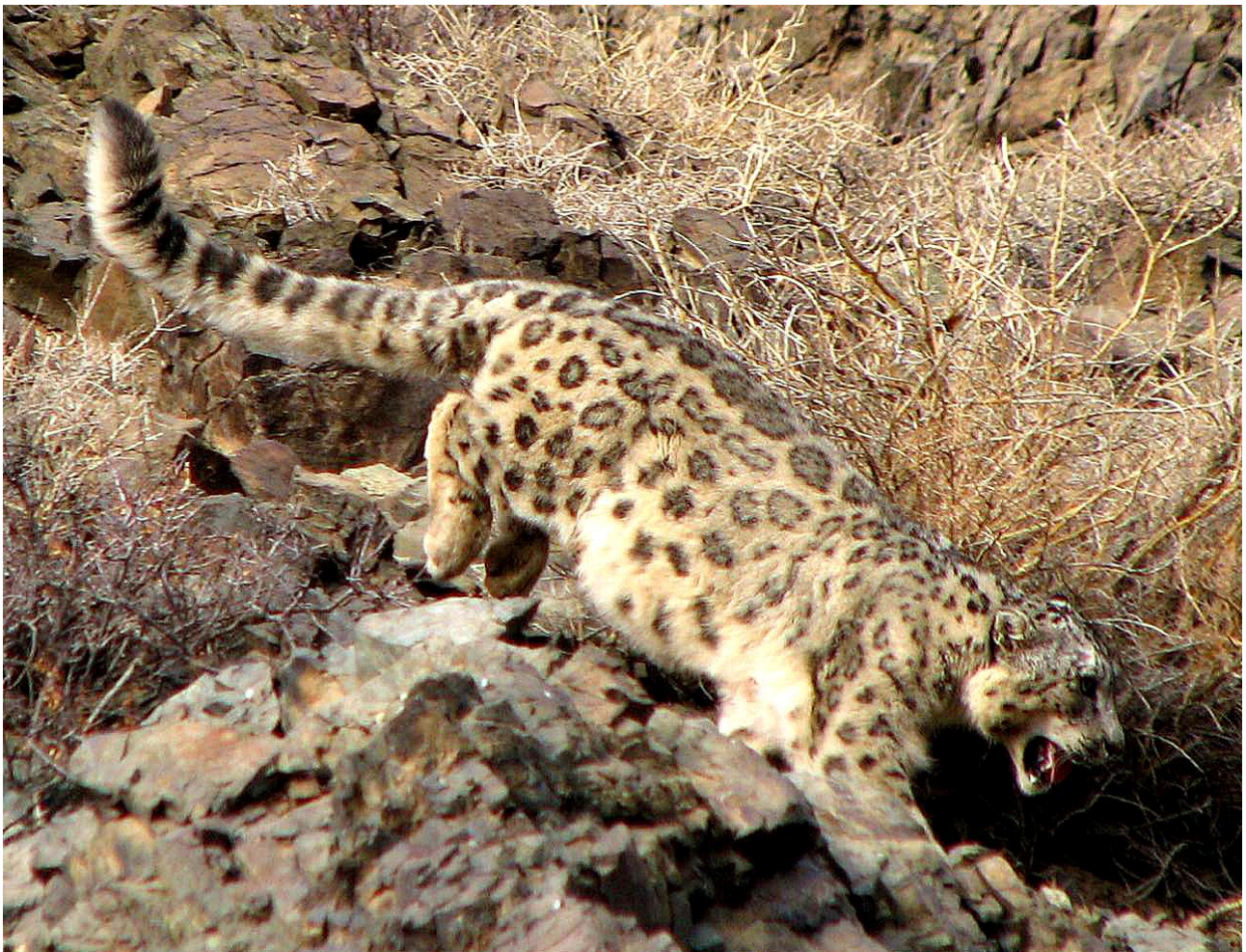
Snöleopard i Jargalantbergen.