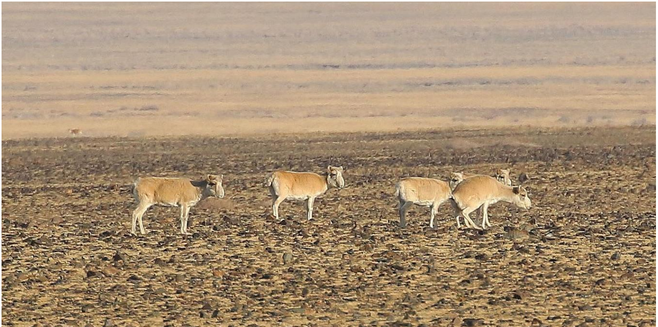
Vi har också stor chans att få se den märkliga saigaantilopen.