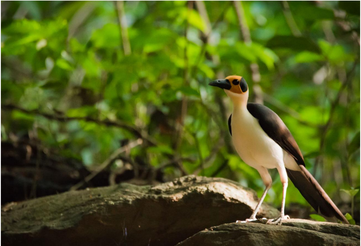
Yellow-headed Picathartes – en av resans mera ikoniska arter.