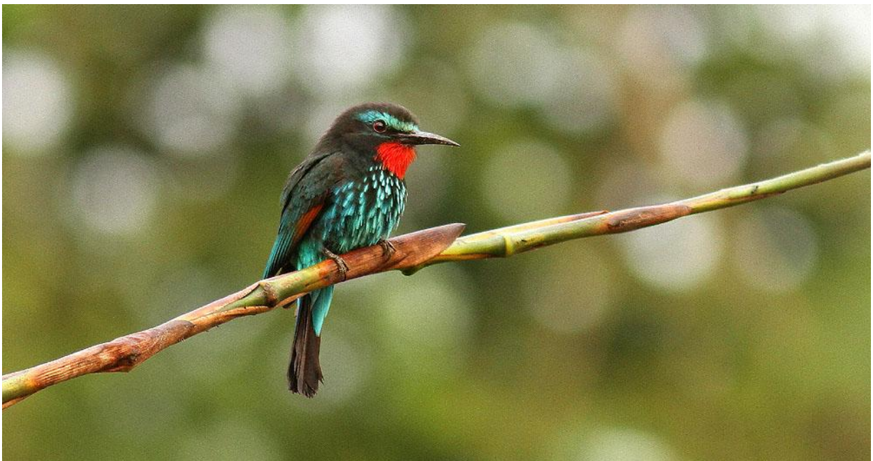
Black Bee-eater.

Därefter transport till Accra där resan avslutas på internationella flygplatsen.