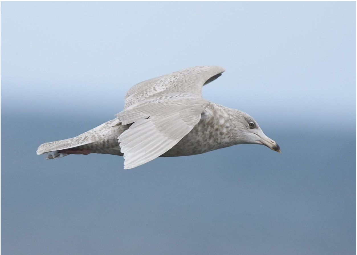
Om vi har tur kan vi stöta på vittrut.

7 januari. Resan avslutas efter gemensam lunch.