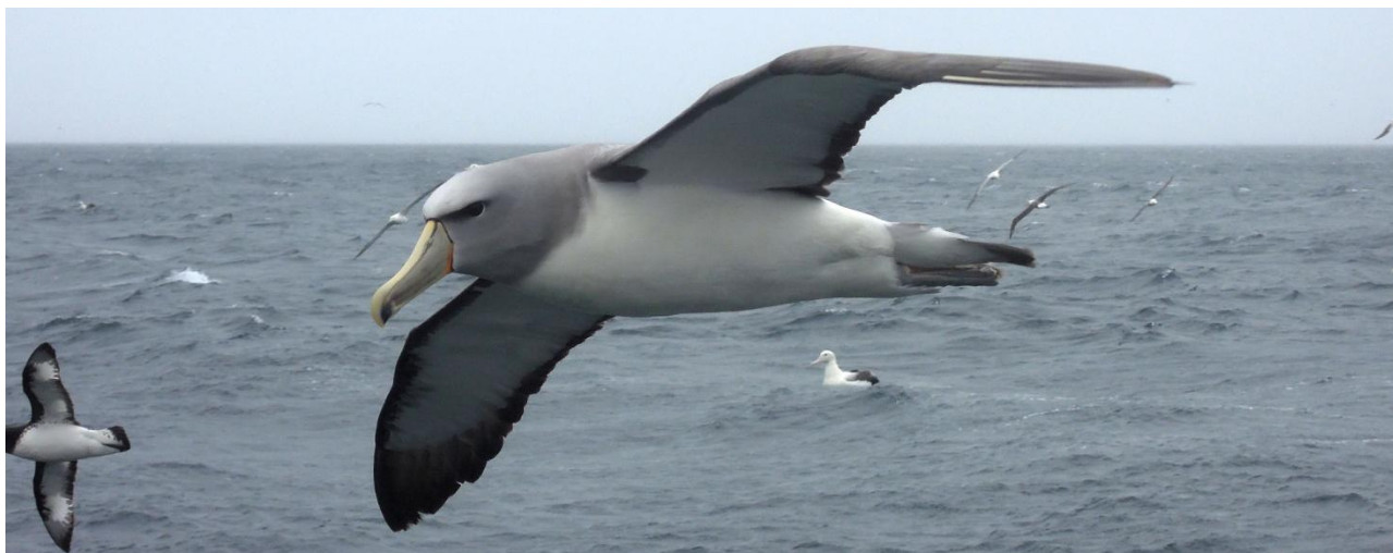
Havsfågelturerna på resan ger fantastiska närobservationer på bl a albatrosserna. Här en Shy Albatross.