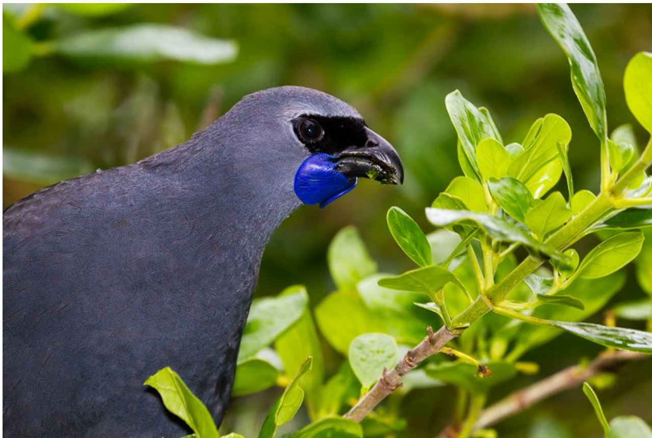
North Island Kokako.