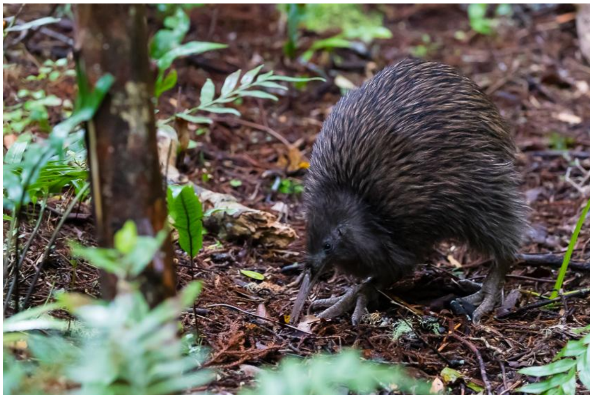
Southern Brown Kiwi.

Räkna också med att det kana vara ordentlig sjögång på några av våra havsfågelturer. Här är det bra att gardera med sjösjukemedicin.