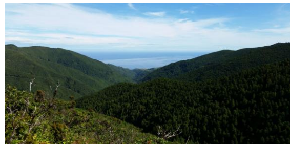
Utsikten från Miradouro da Serra da Tronqueira var enastående.

Vi fortsatte till utsiktspunkten Miradouro da Serra da Tronqueira där utsikten var enastående. Härifrån hade vi full vy över den drygt 900 m höga toppen Pico Verde. Vi kunde verkligen skatta oss lyckliga för att vi inte hade dimma och regn som ofta är fallet här. Ytterligare några domherrar höll till kring utsiktsplatsen och i solskenet flög tistelfjäril och långsvansad blåvinge. Det var svårt att slita sig från denna vackra plats men vi klev in i minibussarna för återfärd till byn Povoação för lunch.