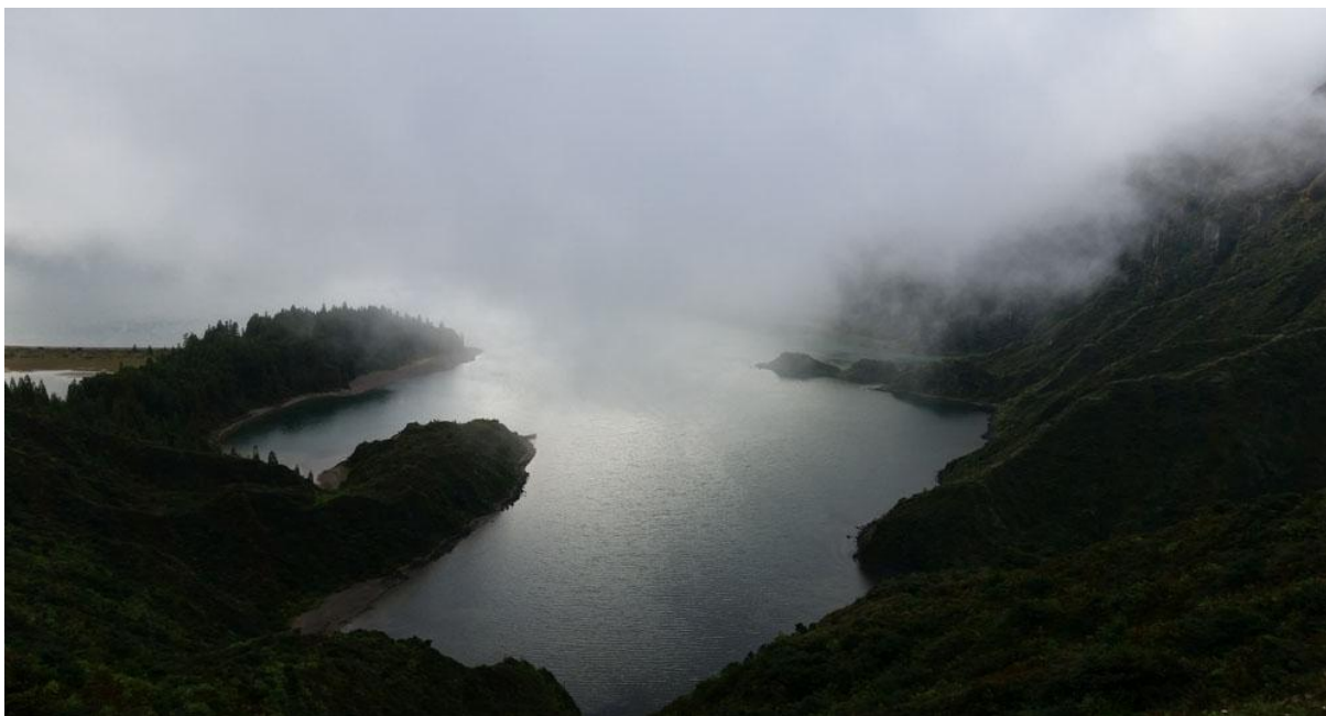
Eldsjöns krater insvept i dimmoln.

över de 900 m höga topparna men när solen bröt igenom kunde sjön med den vita sandstranden spannas av med tubkikare. Vi kunde inte hitta några fåglar i den djupa kratern men försärlor var vanliga häruppe. Efter dessa härliga vyer fortsatte vi till den djungelliknande skogen i Caldeira Velha. När vi klev ut ur minibussarna dök två helenaastrilder upp och de rödfärgade fåglarna satt en stund mitt på vägen. I Caldeira Velha erbjöds möjlighet till ett dopp i varma källor. Iberiska sjögrodor verkade trivas bra i en bäck med ljummet vatten och kungsfågel sågs fint i den lummiga skogen.