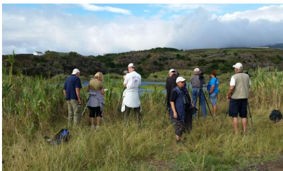
Studier av vadare i Cabo da Praia.

Avfärd redan 06.15 mot flygplatsen och resa till Terceira. Vid flygplatsen på Terceira väntade en buss som tog oss till hotellet i Angra do Heroísmo där vår lokala guide mötte upp. Vi åkte österut mot stenbrottet i Cabo da Praia men stannade först till för en "brunch" i La Rocha. Ute på terrassen sågs de små öarna Ilhéus das Cabras och förutom de många gulnäbbade lirorna sågs en småspov som flög förbi.