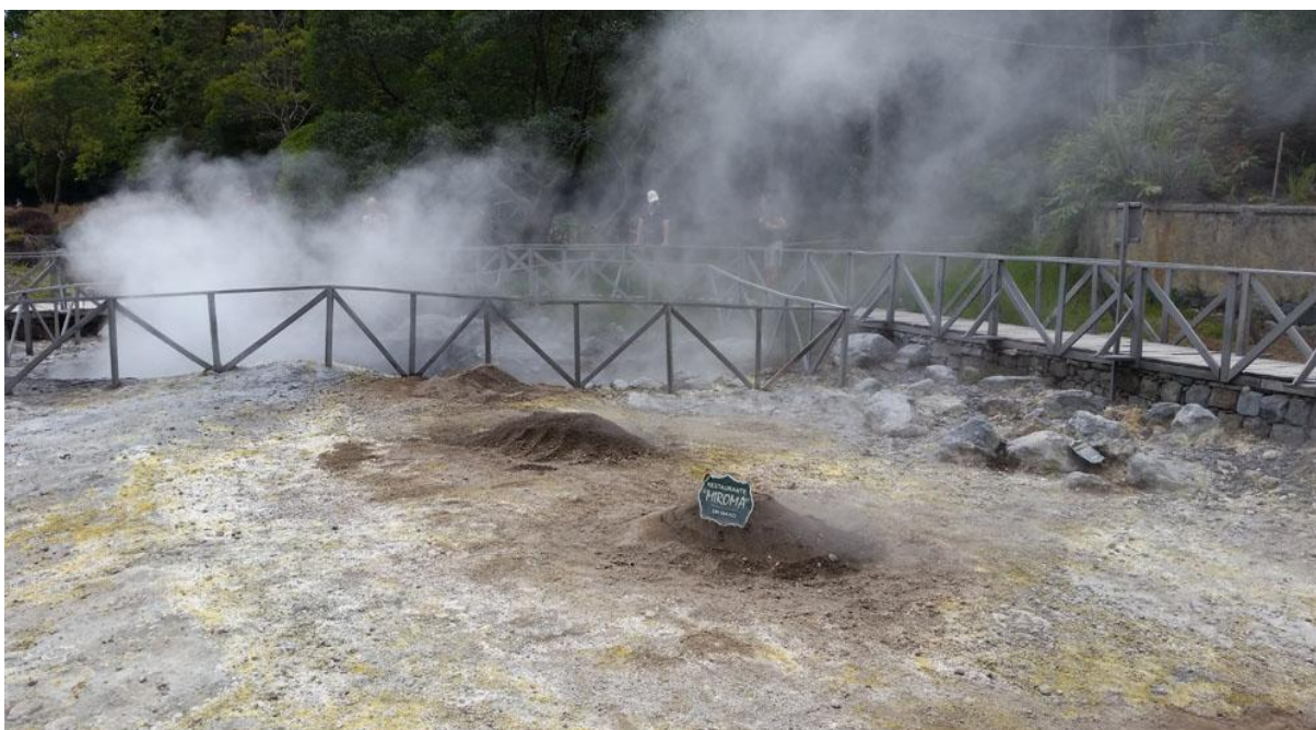
De heta källorna vid Lagoa do Furnas.

Efter den uppfriskande upplevelsen i Terra Nostra åkte vi vidare till Lagoa do Furnas med de heta källorna. I de bubblande källorna gräver man ner grytor med mat som får stå på långkok. Denna maträtt har blivit en riktig turistattraktion. En ensam kricka i kratersjön var ny researt liksom den från Nordamerika hitflugna tjocknäbbade doppingen. Denna lilla dopping var svårfunnen i vegetationen längs sjöns strandkant men vi fick se den bra.