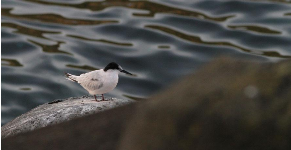
Adult rosentärna i hamnen, Angra do Heroísmo.