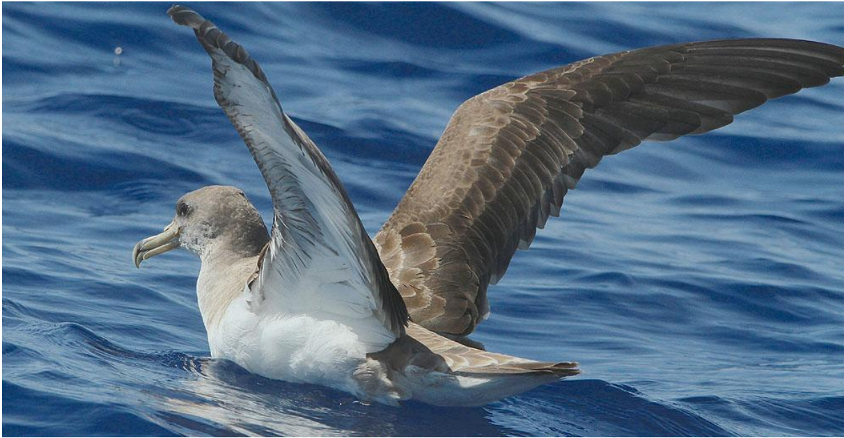
Gulnäbbad lira på vattnet vid havsturen 25.9.