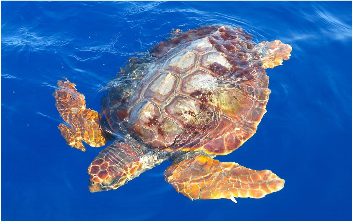
Äkta karettköldpadda alldeles intill båten.