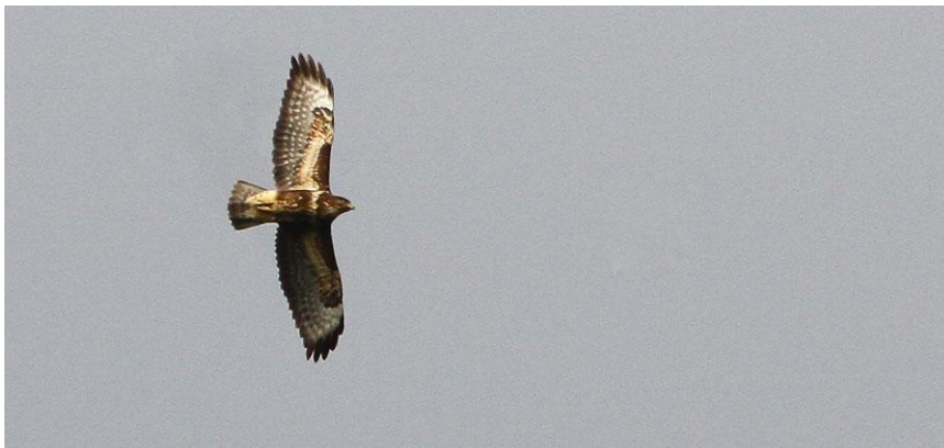
Ormvvråk av den azoriska rasen.