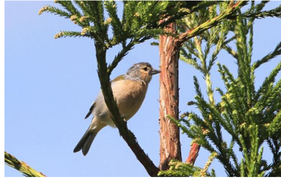
Den azoriska rasen av bofink skiljer sig rätt markant från den vi har hemma.

Vi fortsatte norrut längs sjön och vid vägens slut nådde vi en vacker avskild plats där vi begründade den tunnel som på 1930-talet tog sju år att färdigställa. Den idylliska platsen inramades med den porlande sången från rödhakar.