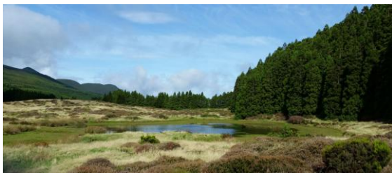
Den vackert belägna Lagoa do Negro.

Vi fortsatte in mot Angra do Heroísmo och gjorde ett besök på Monte Brezil varifrån utsikten över staden kan vara bedårande. Nu hade det förutom dimman också börjat regna och vi fick gissa oss till upplevelsen av den mäktiga utsikten från denna kulle.