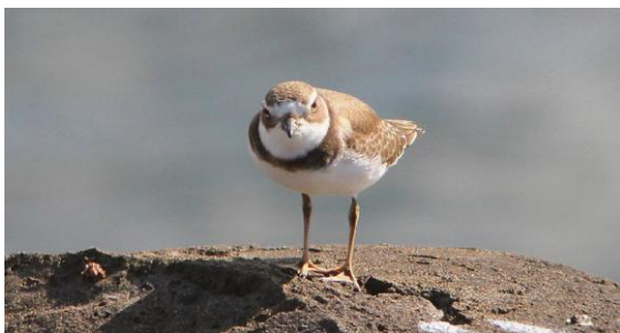
En ung flikstrandpipare på nära håll i hamnen Ponta Delgada.

Då vi nu började bli småhungriga letade vi upp ett kafé med utsikt över hamnen. Med lite mat och dryck i magen gick vi tillbaka till hotellet för uppfräschning inför kvällens middag.