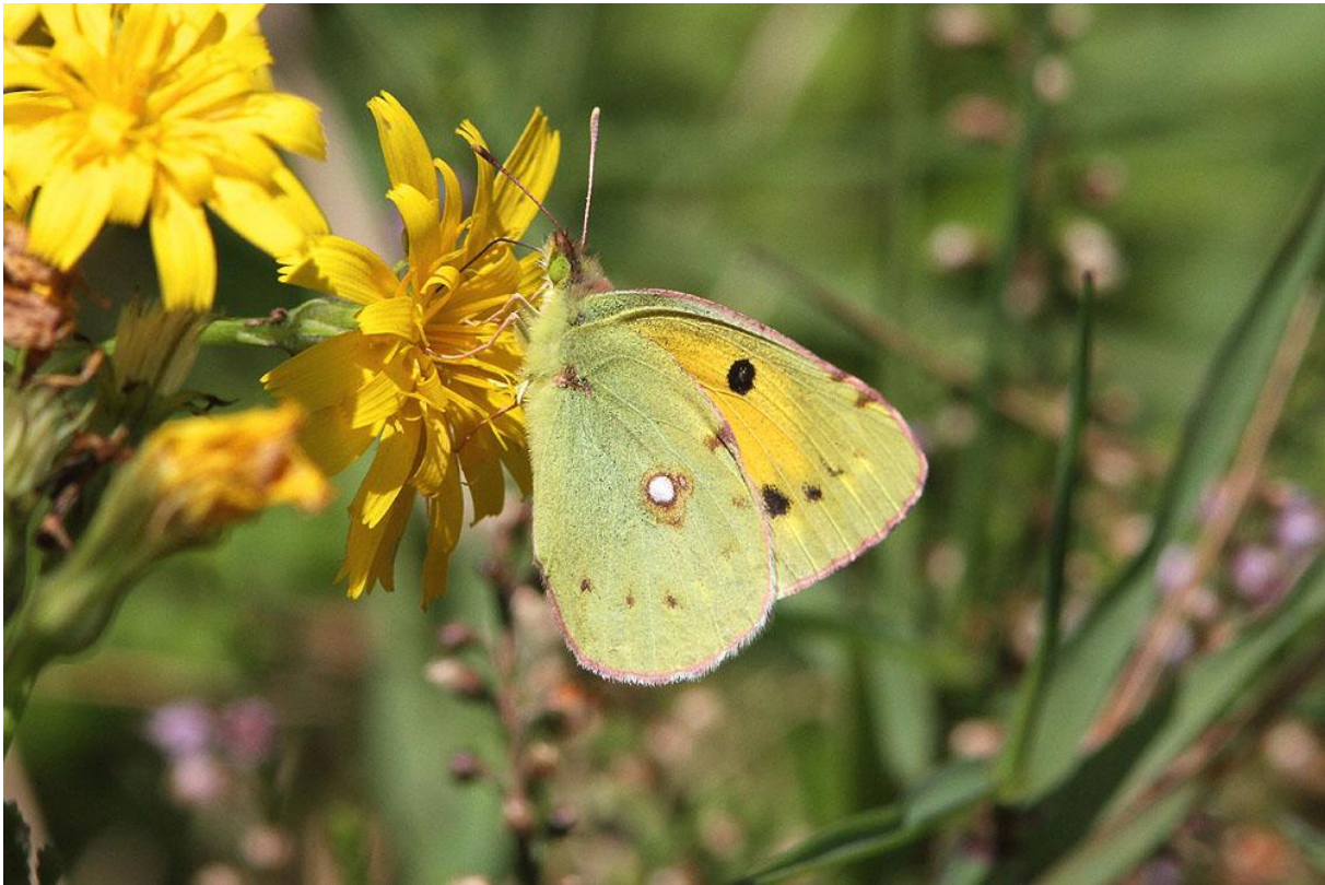
Rödgal höfjäril.