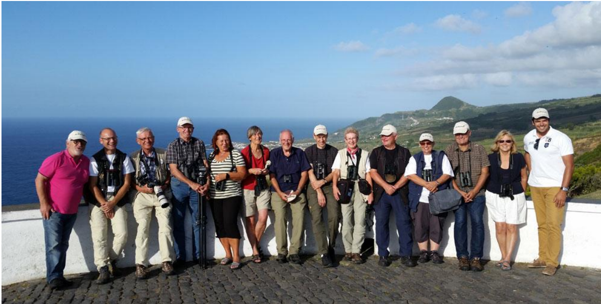
Gruppen samlad vid utsiktsplatsen Ponta do Escalvado på Sao Miguel.