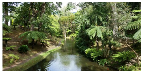
Den gröna botaniska trädgården Terra Nostra.

Efter lunchen åkte vi till Furnas i de centrala delarna av ön. Längs vägen kunde vi i söder skimta ön Santa Maria. I Furnas stannade vi kort till vid några varma källor (caldeiras) och därefter besökte vi den imponerande botaniska trädgården Terra Nostra. Några utnyttjade badmöjligheten i det varma vattnet med hög järnhalt i "Ungdomens källa". Passande nog simmade några roständer omkring i vattnet. Roständernas kroppsfärg var försvinnande likt färgen på vattnet.