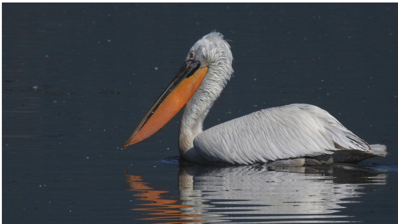
En av världens största kolonier av krushuvad pelikan finns i Lake Prespa.

Varmt välkommen på AviFaunas resa till Nordmakedonien & Grekland!