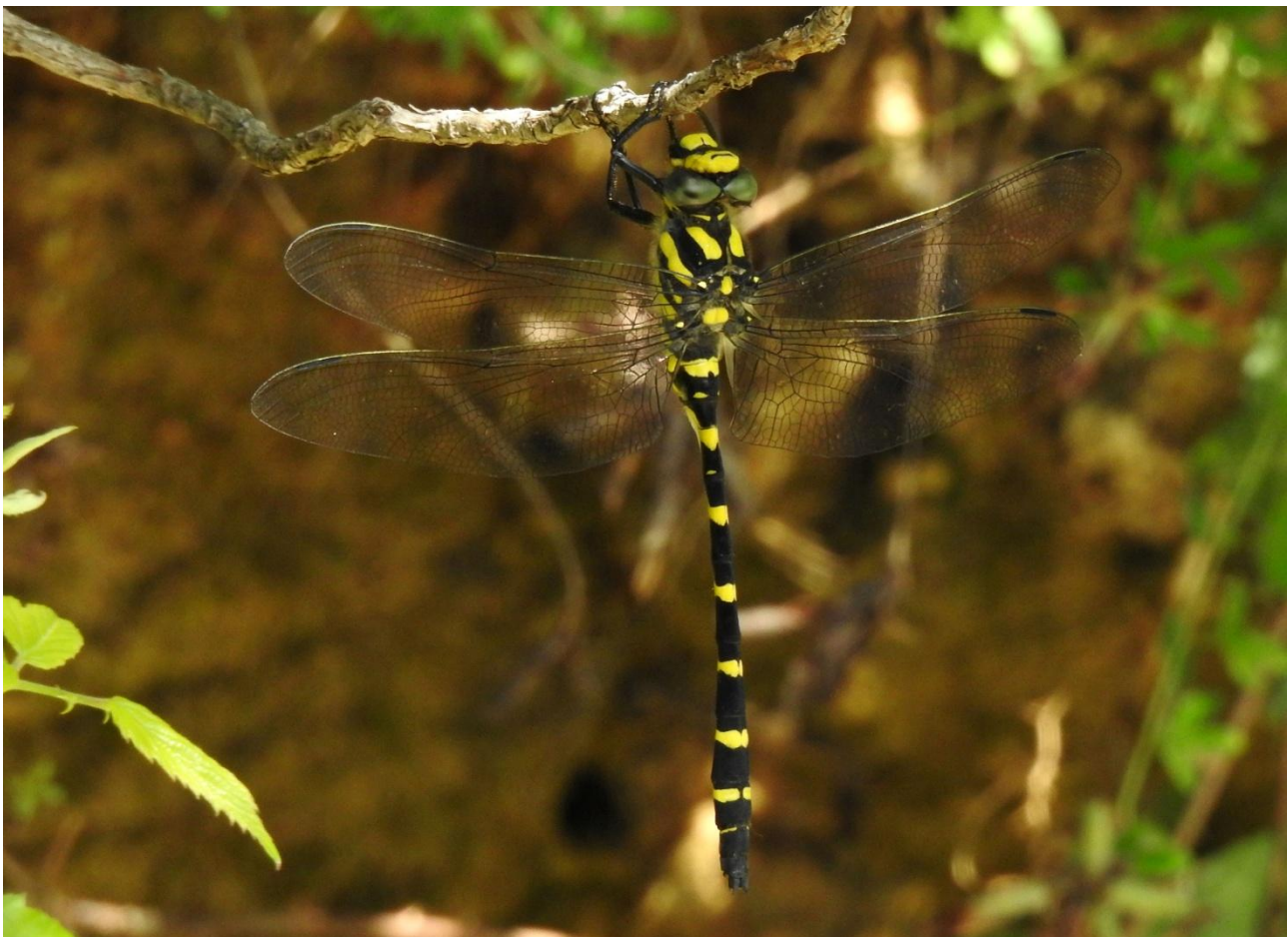
Balkan Goldenring är en vacker trollslända som har en sparsam utbredning i Sydosteuropa.

Vårt kansli kontaktar du på 0485–444 40 eller e-post admin@avifauna.se . Hit kan du vända dig om frågor kring praktiska saker som betalning och bokningsläge, som inte har med fågelfaunan på resmålet att göra.