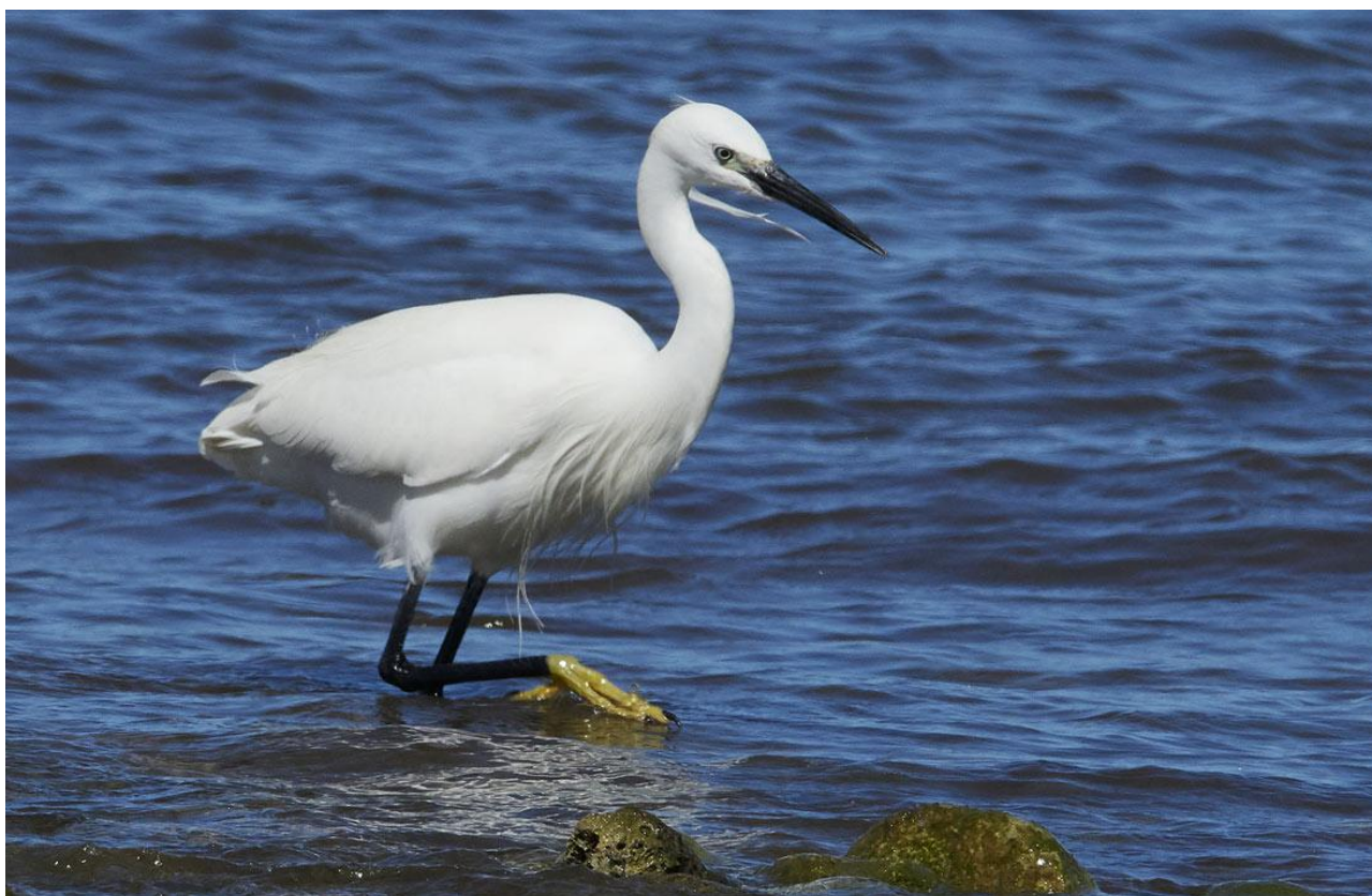
Silkeshäger är en vanlig häckfågel i våtmarker.