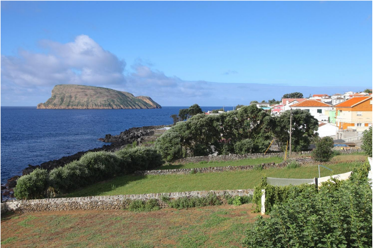
Den vackra ön Terceira.