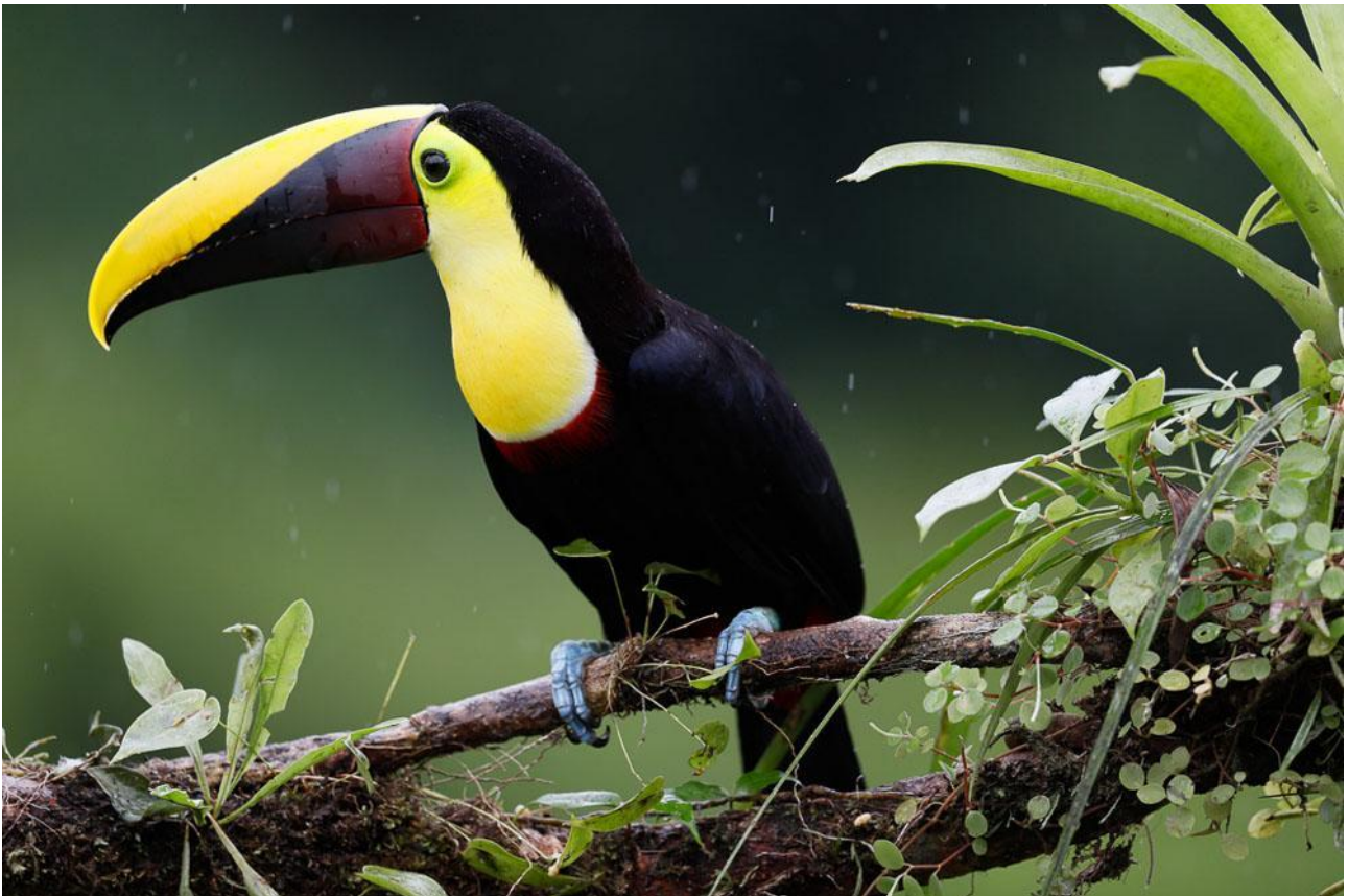
Denna Chestnut-mandible Toucan, är en av flera arter tukaner vi hoppas se på vår resa.

”Frammot notiden vände båten tillbaka, och vid landstigningen upptäckte vi de vackra Prothonotary Warbler och Yellow-throated Euphonia. En ordentlig frukost stärkte oss inför avfärd. Bland de fåglar som infann sig vid fruktbordet utanför matsalens fönster uppmärksammade vi särskilt Red-legged Honeycreeper i olika schatteringar av blått. Bredvid stod en liten palm, och om man hukade sig och kikade upp i lövverket, kunde man urskilja en liten Pacific Screech Owl, som är typisk för denna del av Costa Rica.”