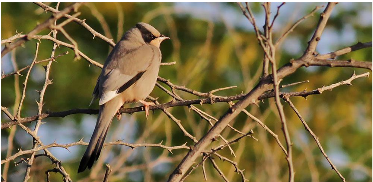
Många längtar efter att få se hypokolius, här en hane.

Vi var så framme vid Jabal Samhan, hemvist för den eftertraktade klippörnen. Nedanför oss ett långt, högt och brant klippstup att hålla distans till. Vi blev inte besvikna. Inom kort hade vi sett båda de gamla klippörnarna, varav den ena på nära håll. Oj, vad fina de är! Kortstjärtade korpar och sinaiglansstarar sågs också, liksom bleka klippsvalor. En långnäbbad piplärka och en arabstenskvättan fanns också närvarande. Fältfrukosten satt fint med vidunderlig utsikt ner mot havet och olika wadier.