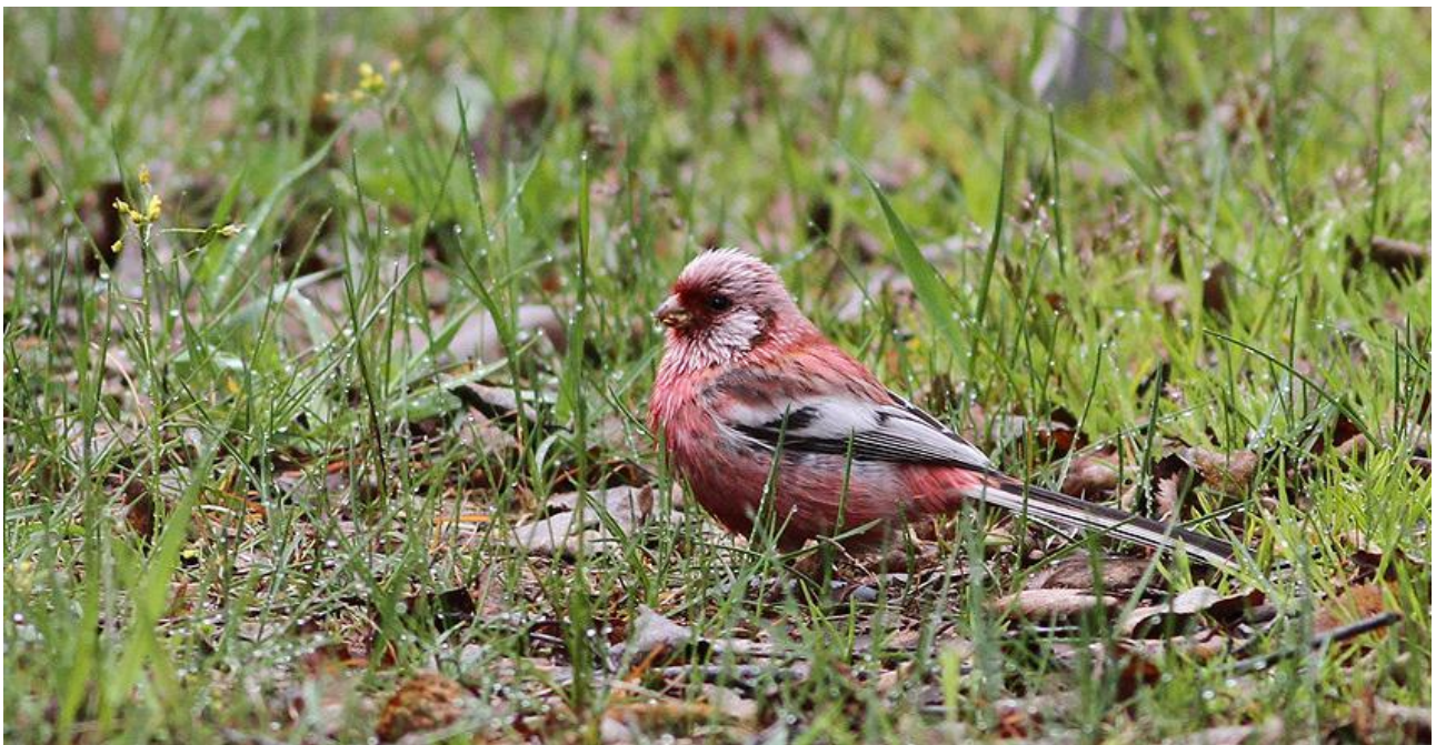
Långstjärtad rosenfink.

Fågellivet i bergen kring Altajs högstäpper är spännande och här finns överraskningar att söka. Under ett par dagar gör vi vandringar upp på högre altituder för att bl a titta efter altajsnöhöna, altajjärnsparv, större rosenfink, bergrödstjärt, stensångare och asiatisk alpfink. På lägre altitud hittar vi Chujastäppen – Altajs största högstäpp. I det ödsligt trädlösa landskapet hittar vi ökenpipare, mongolsnöfink, jungfrutranor och mongolvråkar. I buskområdena längs stäppens kanter trivs stäppsångare, azurmes och långstjärtad rosenfink. Här hittar vi också gott om isabellatörnskator av nominatrasen och just Chujastäppen och det nordvästliga hörnet av Mongoliet är det enda kända området i världen där det produceras hybrider mellan dessa och vanlig törnskata.