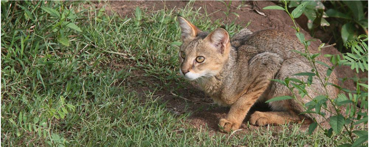
Jungle Cat. Udawalawe.

hand en liten bit från gruppen måste du vara mycket uppmärksam på samlingstider och var resten av gruppen rör sig så du inte försenar avfärd eller skrämmer fåglar som resten av gruppen smyger på. Det är särskilt viktigt att reseledaren informeras om ditt intresse för fotografering i förväg och att ditt fotograferande inte försenar gruppen