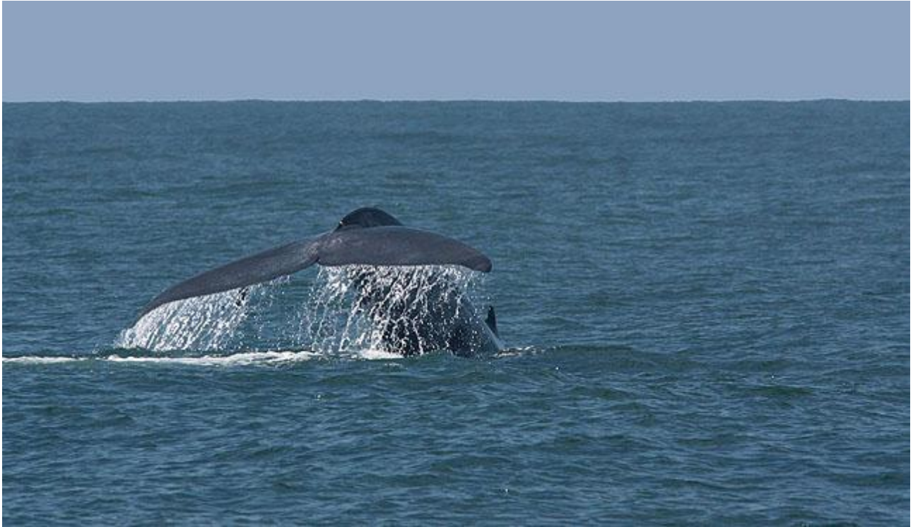
Blåval – obegripligt stor på närhåll.