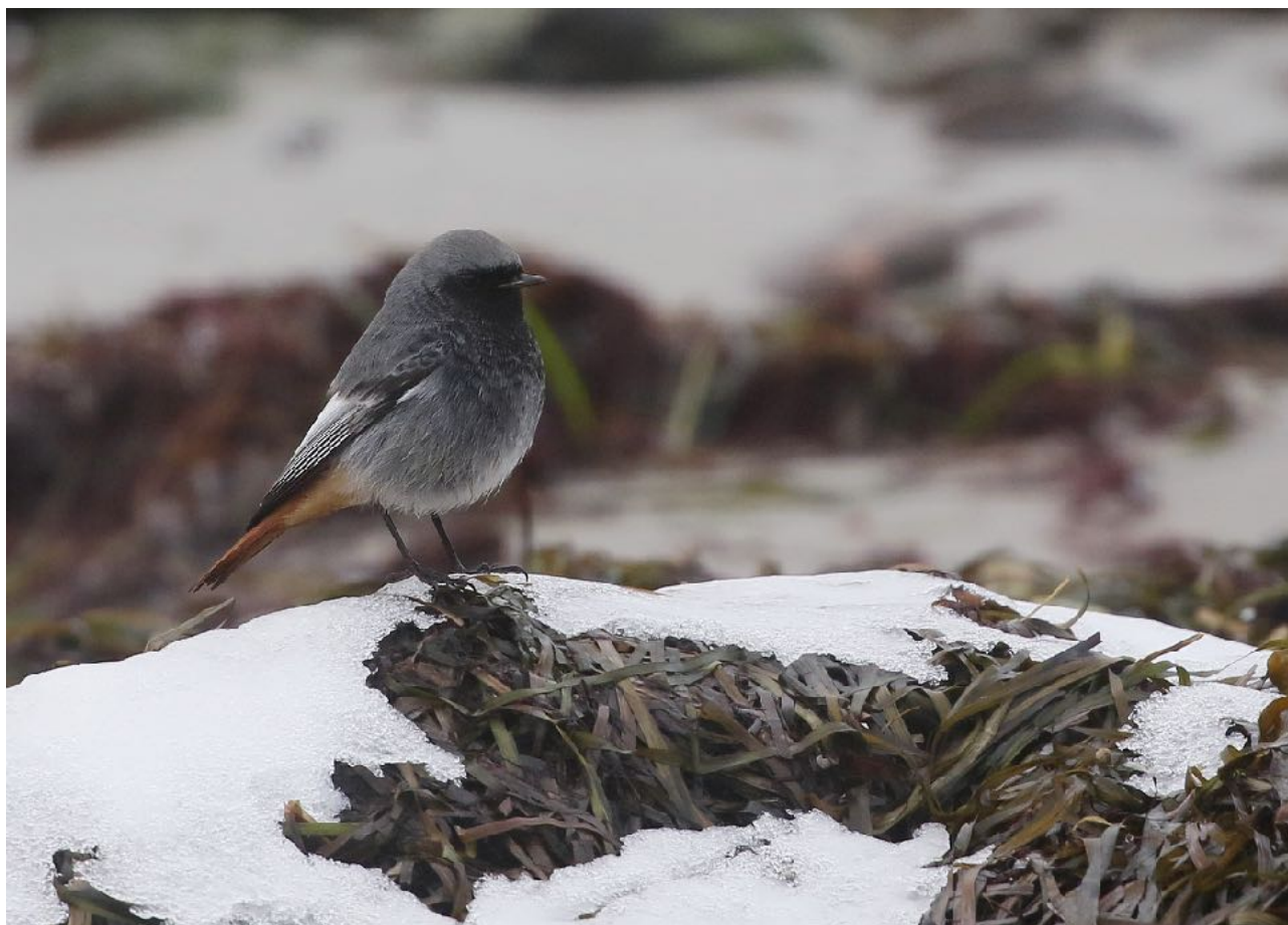
Svart rödstjärt. David Erterius.

1 ex stöttes längs ett dike vid Strömnäs, Löddesnäs.