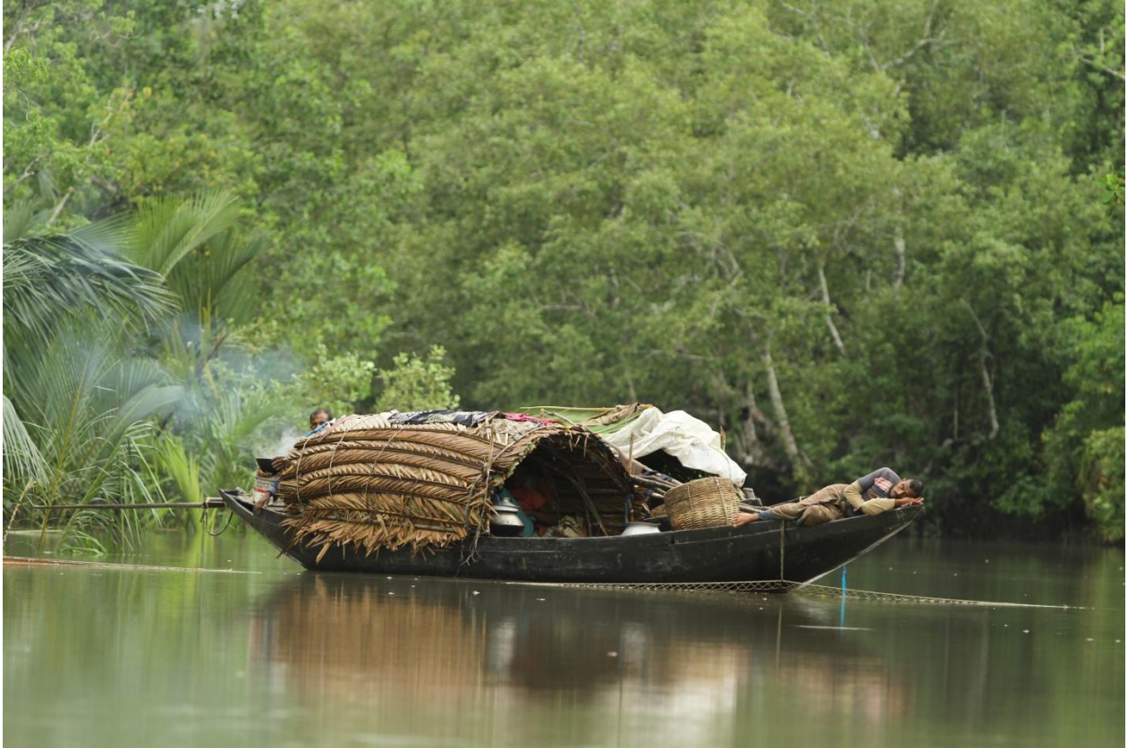
Ibland råder ett stillsamt liv i Sunderbans.