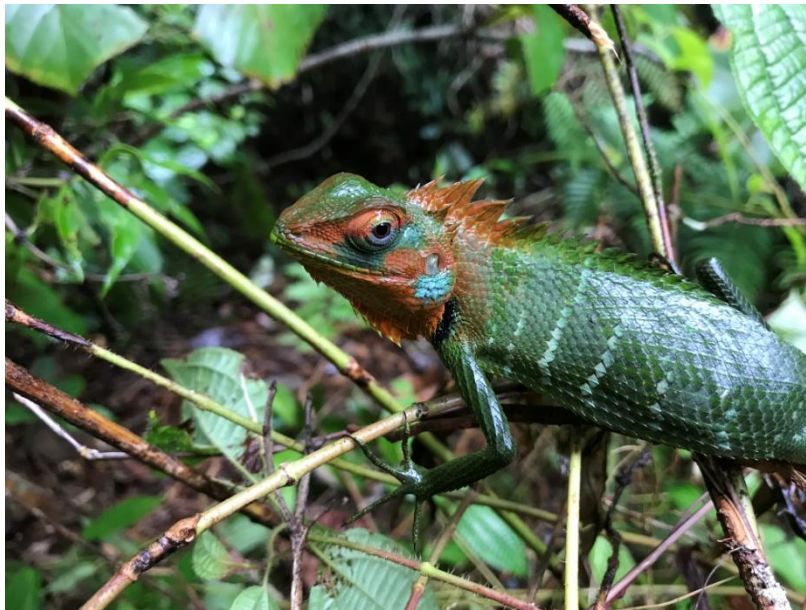
Common Green Forest Lizard. Sinaraja.

nära flygplatsen och har tillgång till hotellrum för packning och tvagning några timmar innan resan avslutas på flygplatsen.