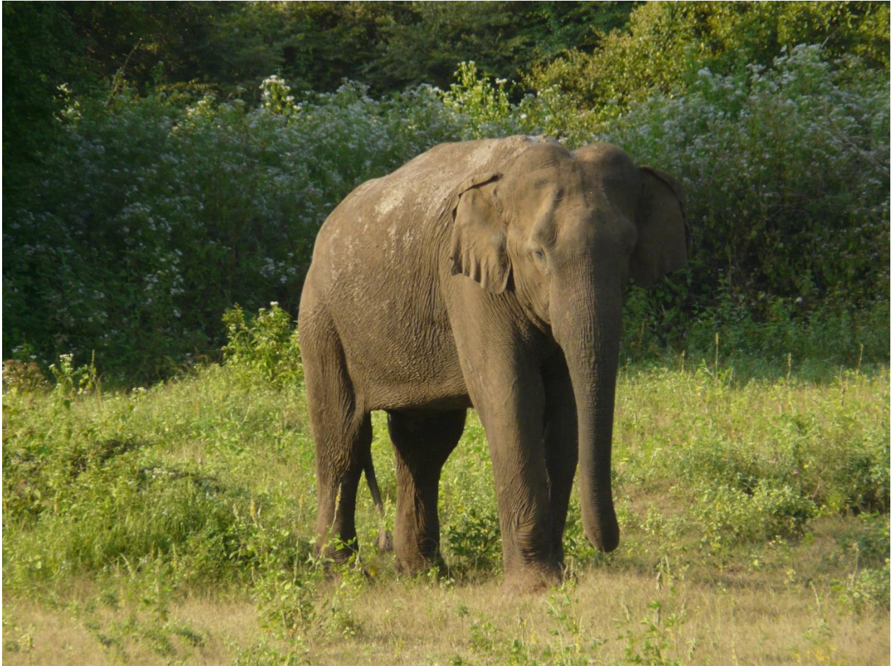
Asiatisk elefant. Udawalawe nationalpark.