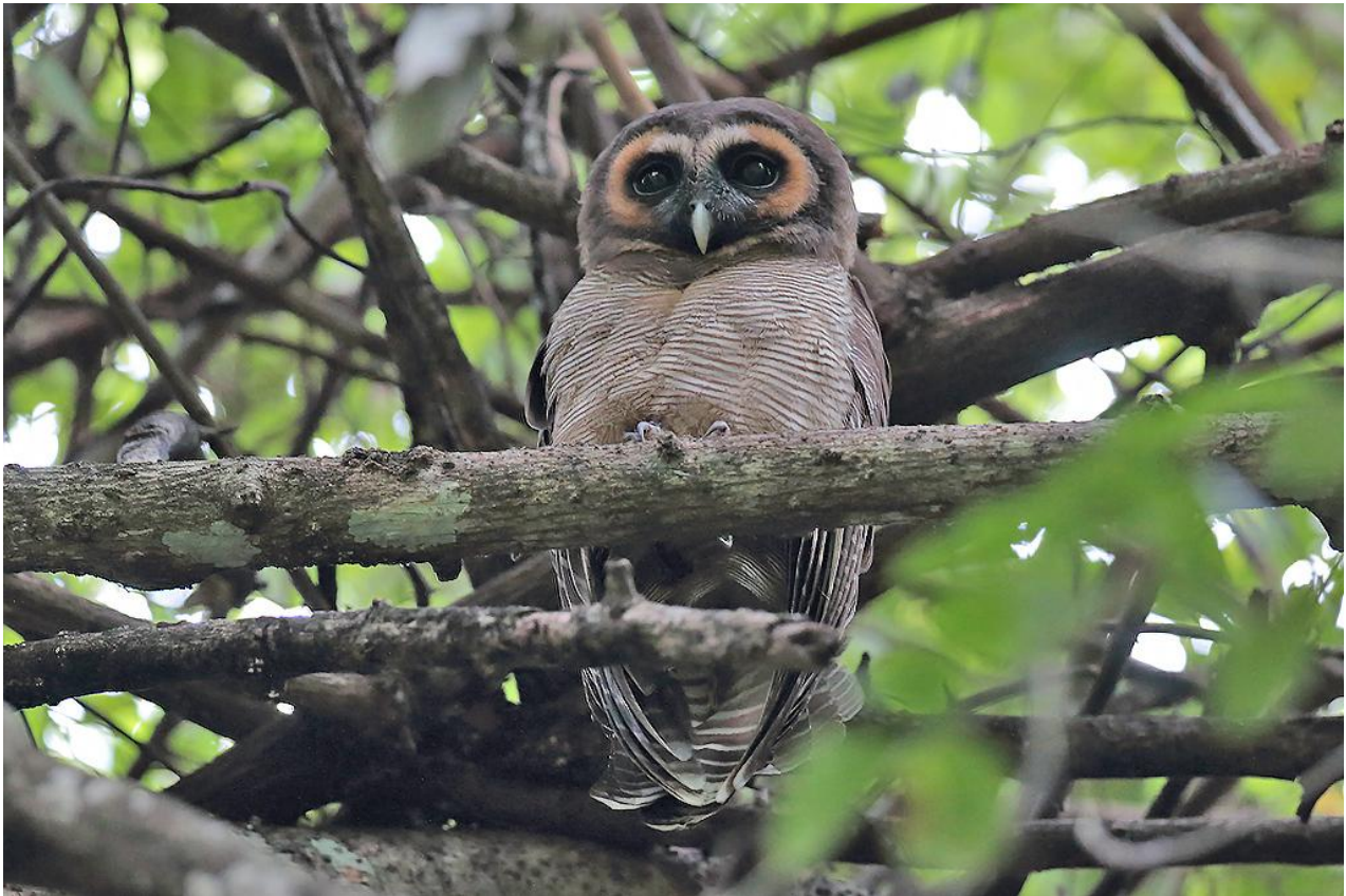
Brown Wood Owl.

”Efter några timmars gång var vi ute i ett "hett" område för blåval och efter ett tag fick vi se några avlägsna sprut, samt kunde ana ryggen på jättevalen, men den gäckade oss vad avsåg närobsarna. Så småningom blev det dock bättre obsar på blåval och vid flera tillfällen fick vi även fina obsar av de charmiga spinnardelfiner, helt nära båten.”