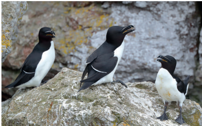
Tordmular.

Heldag på Stora Karlsö. Vi började med att stanna till vid Klinte kyrka – ett pålitligt ställe för lundsångare. Och visst fanns det en hane där som sjung intensivt i klinten ovanför församlingshemmet. På Gotland väljer ofta lundsångarna att sitta i de branta klintkanterna. Den lilla "Phyllisen" visade också upp sig i en ask nära parkeringen som vi lyssnade ifrån.