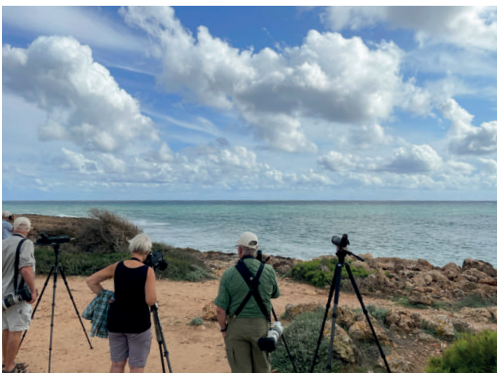
Havsfågelspaning vid Cap de Salines.

Mest uppseende var kanske sträckande flamingos!