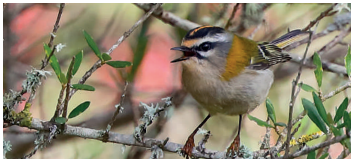
Brandkronad kungsfågel.

Framåt lunch rörde vi oss vidare ut på Formentorhalvön med första stopp för lunch på den gamla utkiksposten Albercutx. Vägarna här är vindlande serpentiner med branta stup på sidorna och karavaner av dödsföraktande cyklister. Dessutom är varje parkering fylld med minst fem bilar för mycket. Lunchen smakade väl till utsikten och klippsvalor som snurrade runt oss.