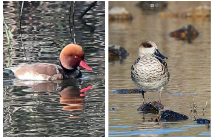
Rödhuvad dykand och marmorand.

Dvärgörddrommen firades på kvällen med bubbel och rödnäbbad trut ute på restaurangens veranda mot havet!