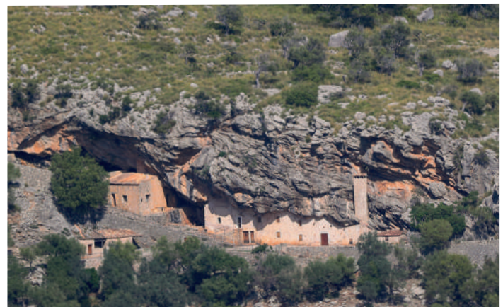
Bergsby, Tramontana.

Torsdag 7 oktober. Så var det dags att samsas med cyklister på serpentinvägar igen, men först fick vi se resans enda tärnor, två kentska dito som rastade på stranden nedanför hotellet. Målet för dagen var Embassament de Cuber, en damm i bergstrakterna i världsarvet Tramontana. Vägen är i sig häpnadsväckande med hus insprängda i berget och hisnande vyer.