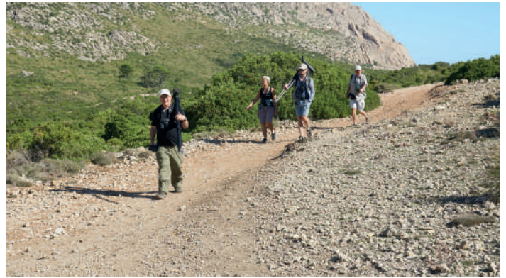
Bosque Valley.

Tisdag 5 oktober. Vår andra heldag på ön lovade gott väder och vi satsade på en långpromenad genom Bosque Valley som startar i Port de Pollença och skär mellan bergen till en vik på nordsidan av Formentorhalvöns bas. Den svåraste fågelarten att se någon annanstans än Baleariska öarna är förstas balearisk sångare och var en av förmiddagens målarter. Dalen ligger i skugga under morgonen och det går att tajma promenaden så man kan spendera tid just där solen når fram – ofta blir det en tydlig aktivitetsökning just när solen slår om temperaturen från ganska kyligt till rejält varmt.