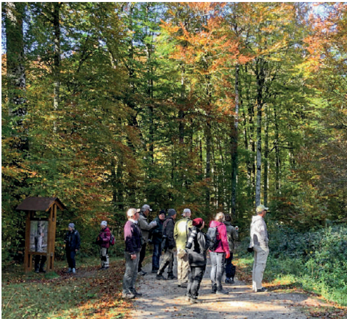
La Selva de Irati.

så lång tid innan vi hittade en hane vittryggig hackspett av den sydliga rasen lilfordi som rörde sig utmed stigen vi gick på. Efter lunch i fält begav vi oss vidare till Lindus Pass och ett par timmars sträckskådning. Ett par hundra sträckande tranor och en del röda glador sträckte men mer kul var flockar med steglitsar och bofinkar som kom nedifrån dalen och jobbade sig upp för att passera oss någon meter över marken i bekväm ögonhöjd. Hela tiden fanns mängder med gåsgamar i luften och vi såg även de lokala kungsörnarna.