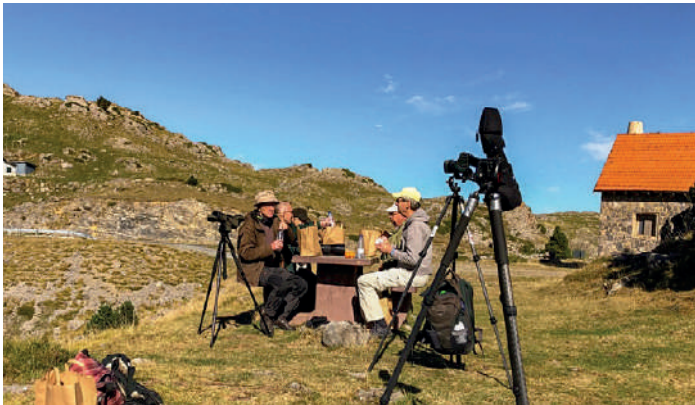
Lunch i Pyrenéerna.

Avfärd en timme till den pittoreska byn Isaba. Stenkyrkan här är en övervintringsplats för murkrypare men den hade inte kommit hit ännu. Större delen av dagen tillbringades vid Larra-Belagua på lite högre höjd i fin barrskog. Ett par adulta lammgamar kom förbi på nära håll och kamerorna smattrade. Definitivt en av resans fågelmässiga höjdpunkter! Citronsiska hördes och bland annat flera mindre korsnäbbar sågs samt en spillkråka. Uppe vid passet på 1800 m, precis på gränsen till Frankrike, åt vi vår medhavda lunch. Småflockar med diverse flyttande finkar kom förbi på låg höjd. Eftermiddagen vid Foz de Mintxate där vi såg Alpjärnsparv och sedan vidare till Foz de Arbaiun och sedan till hotellet. Foz betyder ungefär ravin och vi besökte flera spektakulära sådana under resan.