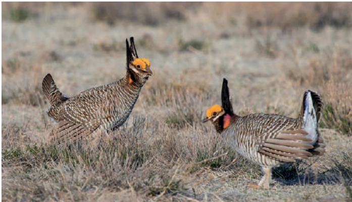
Lesser Prairie Chicken.

Vi inleder dagen på en privat ranch i gömsle med Lesser Prairie Chickens framför oss på nära håll. Vi delar upp oss i två olika gömslen på olika spelplatser. Det här är nog den mest aktiva arten av de vi sett på resan och spelet bjuder på stor underhållning. En Western Meadowlark sätter sig på vårt gömsle och sjunger så det ekar i det. Som på alla spelen springer enstaka berglärkor på marken framför oss. På vägen tillbaka till "after-grouse"-fiket stannar vi till vid några prärieugglor som bjuder på uppvisning. Vid skådar oss sedan i den hårda vinden till Wray där vi skall stanna två nätter. En överraskning i form av en trumpetarsvan vilar i en sjö vi stannar till på längs vägen.