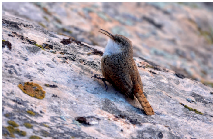
Canyon Wren.

Hönfri dag. Nästan i varje fall, på slutet av dagen ser vi en spelande Dusky Grouse i Black Canyon. Innan dess har vi besökt Colorado Monument med sina stenformationer och sett resans första seglare och Canyon Wrens samt sett två individer av den flugsnappande, vackra Lewis's Woodpecker med sina kråklika vingslag. Senare på dagen beger vi oss över gränsen till Utah och får in Sagebrush