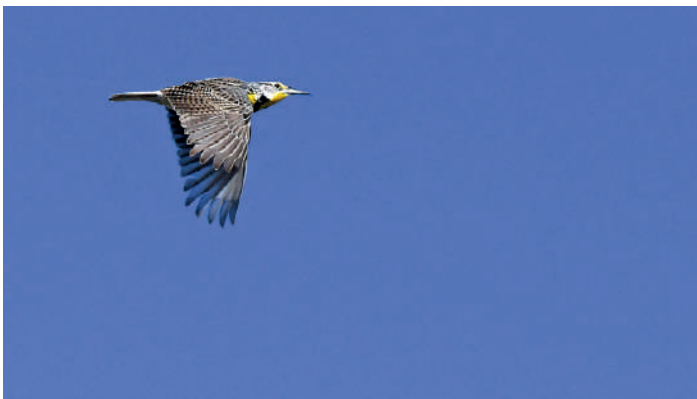
Western Meadowlark.

Morgonen ägnas åt lappsparvar av framför allt två arter: Thick-billed och Chestnut-collared Longspur. Det blåser en hel del och det känns så där men vi ser några av vardera arten rätt snart. Uppenbarligen flyger de alla norrut i vinden, på låg höjd, och verkar lite törstiga då de är intresserade av den nästan uttorkade vattenpöl vi står vid. Phil känner till ett större vattenhål i flygriktningen så vi kör fram till det någon kilometer längre fram. Och där kommer, under den stund vi står där, kontinuerligt flockar av tre arter lappsparvar flygande förbi oss, med flera av dem rastandes några sekunder vid vattenkanten för