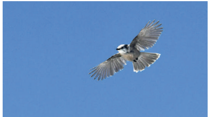
Gray Jay.

att dricka. De flesta är vanliga lappsparvar och Chestnut-collared men även en hel del Thick-billed landar. En fantastisk upplevelse att se dem kämpa sig norrut i motvinden. En Vesper Sparrow hängs också in, och några ladusvalor och förstas Red-winged Blackbirds, med enstaka Yellow-headed Blackbirds, visar sig också. Vi skådar vidare och intar resans första McDonalds-lunch mitt på dagen. Därefter till Fort Morgan där vi får in kryssen snögås och Virginia Rail bland andra. Vi blir också inbjudna på ett timslångt besök till ägaren på den ranch vi skall besöka morgonen efter, och blir utfrågade om våra favoritfåglar och får höra historier om livet som ranchägare och hur det gick till när Sandy Komito (karakteren känd från den verklighetsbaserade filmen The Big Year) besökte just hans ranch för Greater Prairie Chicken på sitt rekordår. På kvällen kör vi tillbaka till Wray och en mycket god middag.