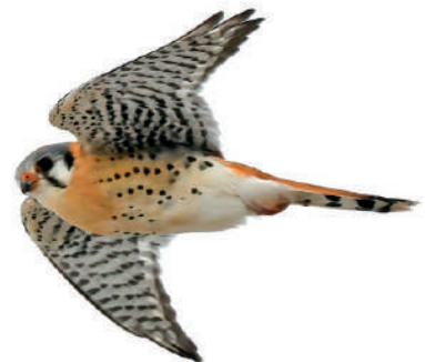
American Kestrel.

Spelplatsen för Greater Prairie Chicken ligger bara en kvart bort, så vi får sovmorgon till 05.15. Greater är lite mer letargisk än Lesser men vi har dem på nära håll och några får till och med se en parning. På vägen från spelet besöker vi ett bo för Nordamerikas största uggla, Great Horned Owl och vi ser också två nyanlända Bobwhites, ännu en hönsfågel in på listan. Och när vi lämnar Wray