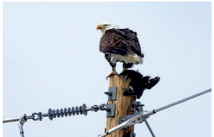
Bald Eagle.

Den första av många tidiga morgnar med uppstigning mellan 4 och 5. Idag skall vi se spelande Greater Sage Grouse, och de är redan igång i mörkret när vi anländer med tredubbla lager långkalsonger till spelplatsen. Här skådar man spelet från sina fordon, på en allmän väg och på behagligt avstånd. Djupt imponerade åker vi in till Walden igen för en rejäl amerikansk frukost på restaurang, på porslin och med metallbestick denna gång. Därefter skådar vi oss på snöiga vägar i bergen till Moose Center och lite bortom för fler specialiteter. Kaffe i Walden igen och en snabb titt vid den stora sjö som finns intill där vi ser mängder med änder, i princip alla sim- och dykänder i Nordamerika, samt en and av obestämd art i klorna på en Bald Eagle som sitter på en telefonstolpe och blänger på oss mellan tuggorna. Därefter kör vi till Craig och förbereder oss för nästa hönsspel.