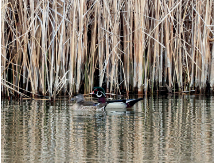
Wood Duck.

för att köra de tre timmarna tillbaka till Denver går två flockar med vilda kalkoner vid sidan av vägen. Tanken var att försöka på ripan denna eftermiddag igen, men det är väldigt dåligt väder med mycket snö i bergen och andra skådare har letat länge efter den under dagen utan att se den, så vi avstår. Vi får istället fina obsar på Williamson's Sapsucker och Wood Duck, den senare en art som gäckat oss tills nu. Natt på flygplatshotell i Denver och avslutningsmiddag på samma restaurang som den första dagen.