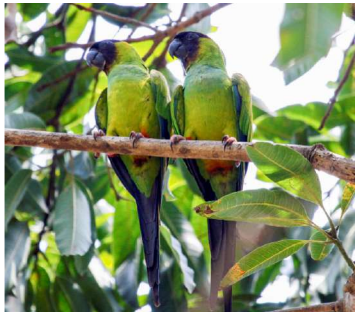
Nanday Parakeet.

Vi hade ordnat så att vi kunde äta frukost på hotell redan klockan halv sex. Sedan återstod bara en tre timmars bussfärd till flygplatsen. Där tackade vi Eduardo för ett lysande värdskap och guidning. Och det kändes som vi med råge uppfyllt resans motto "hellre kvalitet än kvantitet"!