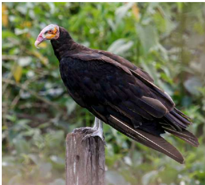
Lesser Yellow-headed Vulture.

Klockan halv fyra var det dags för traktens stora sevärdhet, Lagoa dos Araras. Det är en källsjö dit mängder av arapapegojor och kohägrar kommer till kvällen för att övernatta i palmer ute i sjön. När vi kom fram hade redan både Blue-and-yellow och Red-bellied Macaw börjat att anlända. I sjön simmade Common Gallinule och myskand. Andra nya arter blev Planalto Foliage-gleaner, White-throated Kingbird och White-winged Swallow. Vi njöt av skådespelet ändå fram till skymningen. Sedan var det dags för artgenomgång och middag.