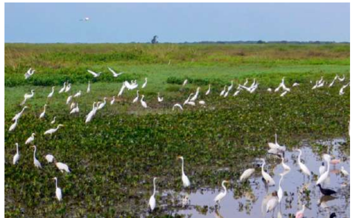
Great Egret och American Woodstork.

På vägen hem längs Transpantaneiran såg vi återigen flera hundra American Woodstork och Great Egret. Vi hittade även till Gunillas lycka två Brazilian Teal. Efter som vi var tillbaka vid Jaguar Lodge redan vid fyratiden fick vi tid till att fotografera Toco Toucan, hyacintaror och andra vackra fåglar.