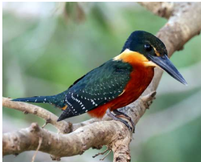
Green and Rufous Kingfisher. Carina Wattmo.