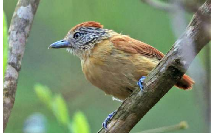
Barred Antshrike.

Nattens sömn och lite morgonkaffe gjorde att alla var sugna på att se nya fåglar. Vi åkte till Aqua Fria road och gick sedan på kanten av vägen för att bekanta oss med Cerradons fåglar. Nästan direkt såg vi en Shrike-like Tanager och sedan två Blue-winged Macaw. Dessa följdes av fina obsar på Rufous-winged Antshrike. En annorlunda Tanager gjorde oss lite förbryllade tills vi