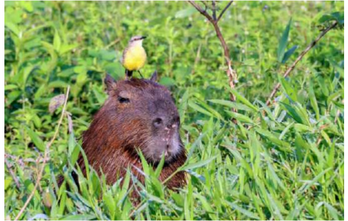
Kapybara med Cattle Tyrant.

Efter lunchen kände vi för att koncentrera oss mer på flodens fåglar. Vi började med några American Skimmer som hade sällskap av en hyacintara på stranden. Sedan såg vi Yellow-billed Tern tillsammans med Large-billed