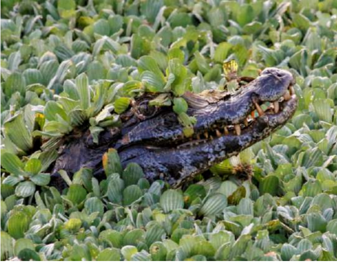
Ycare kajman.