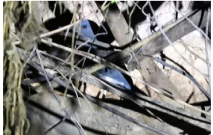
Zigzag Heron.

Vi for vidare på floden och letade efter jätteutter utan finna någon. Strax före lunch såg vi att gräset var nedtryckt vid stranden och vår båtförare sa att det varit en jaguar där nyss. Efter en kort väntan på om den skulle dyka upp åkte vi en bit uppströms och landade våra två båtar på en strand i trädens skugga. Det var dags att äta ur vår medhavda lunchlåda. HG och Lennart passade på att fiska pirayor och alla fick se den beryktade fisken.