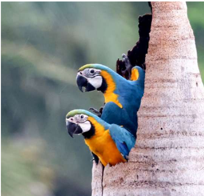
Blue-and-yellow Macaw.

Det var en splittrad grupp som samlades på Cuiaba flygplats på förmiddagen. Några hade kommit tidigare och två hade missat sin anslutning och skulle ansluta till gruppen vid midnatt. Hur som helst for vi till Chapada dos Guimareas där Berit och Ylva väntade. Efter check-in och lite vila på rummet var alla sugna att komma ut i naturen. Vi åkte först till en utsiktsplats där Sydamerikas mittpunkt är markerad. Här fick vi se den lite ovanliga Blue Finch, Crested Black-Tyrant, Swallow Tanager och Black-throated Saltator. I luften svävade Swallow-tailed Kite och Biscuate Swift. Och framförallt njöt vi av den fina utsikten. Vi for vidare till en annan utsiktsplats, Morro dos Ventos. Där hade vi hoppats att få se arapapegojor komma och landa på de röda klipporna men de höll sig borta. Vi fick nöja oss med Yellow-tufted Woodpecker och Black-crowned Tityra. Solen gick ned och vi for tillbaka för lite kvällsmat och sedan en välbehövlig sömn efter alla intryck och lång resa.