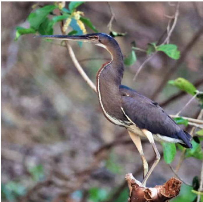
Agami Heron.

Efter kvällsmaten var det dags för tre i gruppen att åka till Cuiaba eftersom deras flyg gick tidigt nästa dag. De såg en tapir längs Transpantaneiran vilket blev resans femte!