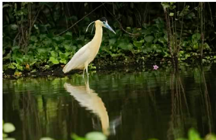
Capped Heron.

Ut på floden igen. Vi för tillbaka till biflödet vi var i onsdags. Det dröjde inte länge förrän vi såg en jaguar uppe i ett träd. Det var en hanne som låg och vilade sig. De stora tassarna hängde ned på varsin sida om trädstammen. Efter ett tag reste den sig och hittade en ny sovställning. Vi lämnade den och ägnade oss åt lite