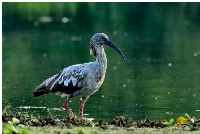
Plumbeous Ibis.

Samling halv fem för nästa safaritur i mörker och gryning. Inte lika mycket djur som kvällen före. Några Tapeti (Brasiliens små kaniner) och Red Brocket (hjort stor som ett rådjur). När det ljusnat stannade vi till vid ett vattenhål intill vägen. Bland hägrar och ibisar stod ett par rosen-skedstorkar. Innan vi var tillbaka hade vi även hunnit se Whistling Heron och Brazilian Teal.