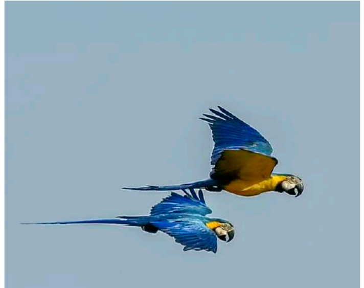
Blue-and-yellow Macaw.

Eftersom det var tämligen varmt så här mitt på dagen blev det några timmars siesta före nästa äventyr, Lagos de Araras. Den är känd för att mängder med arapapegojor och andra fåglar kommer dit vid skymningen för att övernatta i höga palmer som står ute i den lilla källsjön. Det gick en orädd Small-billed Tinamou på stigen ned mot sjön. När vi kom fram fanns där redan några Blue-and-yellow Macaw vilket glädde oss svenskar extra mycket med tanke på färgerna. Där fanns även myskand, ormhalsfågel och Wattled Jacana. Det kom stora mängder Red-bellied Macaw inflygande. Andra nya arter var Short-tailed Swift, White-throated Kingbird, Yellow-chinned Spinetail, Black-capped Donacobius och Yellow-rumped Marshbird. På vägen tillbaka till vårt boende flög det några Lesser Nighthawk över bussen.