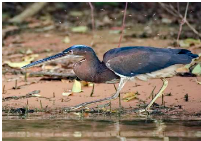
Agami Heron.

Innan det blev mörkt hittade vi en Great Horned Owl med unge och ett större gäng näsbjörnar. I skymningen åkte vi till ett vattenhål för att se om det kom några djur dit för att dricka. Först kom ett gäng förvildade grisar och strax efter det en grupp Collared Peccary.