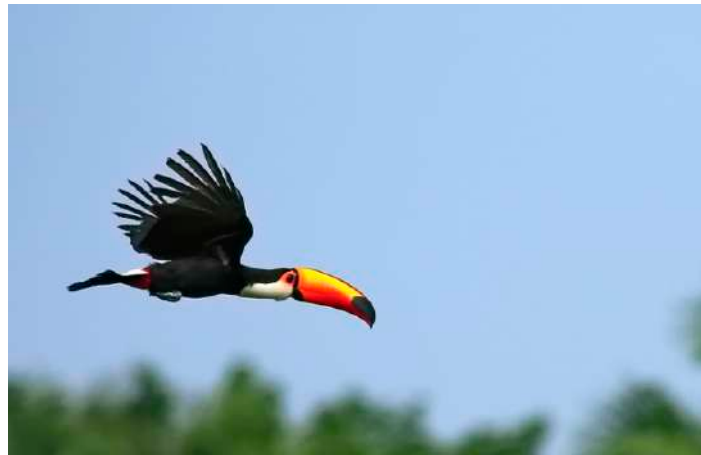
Toco Toucan.

På kvällens avslutningsmiddag kunde vi konstatera att resan varit mycket lyckad och levt upp till mottot "hellre kvalitet än kvantitet". Inte minst alla möten med jaguarer och andra däggdjur.