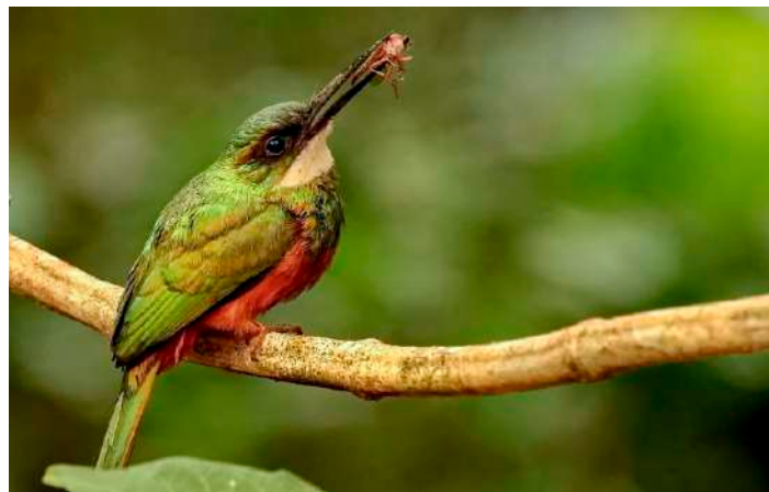
Rufous-tailed Jacamar.

Samling vid fem och noterade då att det låg dimma. Så istället för den klassiska vägen genom cerradon körde vi längre bort där det var lite lägre och tack vare det ingen dimma. Där tog vi en promenad längs en väg genom fin