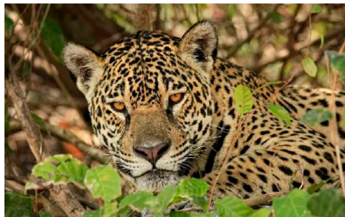
Ung jaguarhanne.

På vägen tillbaka stötte vi på jätteuttrar två gånger. Vi hann även med en kvällstur med spotlights. Vi såg en ny däggdjursart, Grey Brocket, en hjort mindre än ett rådjur. Vi såg även Little Nightjar i lampans sken.