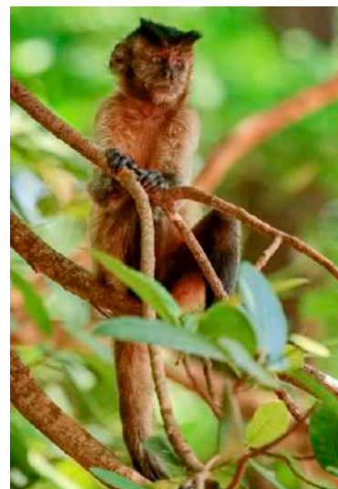
Azaras's Capuchin.

Välkomstdrinken som bestod av färskpressad juice gjorde att vi kände oss ännu mera välkomna. Nu var vi laddade för morgondagens äventyr.