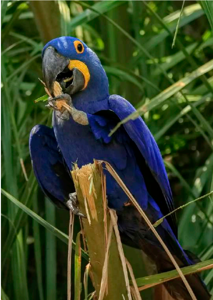
Hyacinth Macaw.