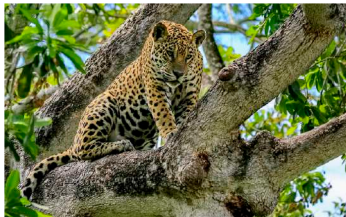
Jaguar, hona.