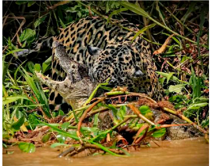
Jaguarhona med kajman.

Under lunchen passade reseledaren på att fiska pirayor som blev pirayasoppa - omtyckt av kökspersonalen på lodgen. Han fick ett tiotal innan det var dags att fara vidare. Rätt snart hittade Eduardo en ung hanne jaguar som låg uppe på strandbrinken och vilade. Vi gled sakta närmare honom men han verkade helt oberörd av vår närvaro. Vilken stor kisse – trots att han bara var ett och ett halvt år.