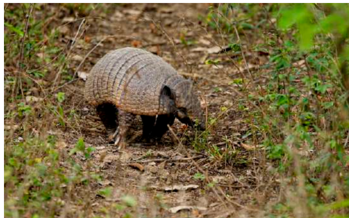
Yellow Armadillo.

Vi lyckades få äta frukost en halvtimme innan ordinarie tid. Under den tre timmars bussresan till flygplatsen fick vi säga farväl till Jabirustorken, papegojorna, alla hägrar och kapybarer i Pantanal. Sedan väntade flyg hem till Sverige eller Danmark förutom för de som valt att förlänga resan själva och besöka Iguazufallen och kustregnskogen.