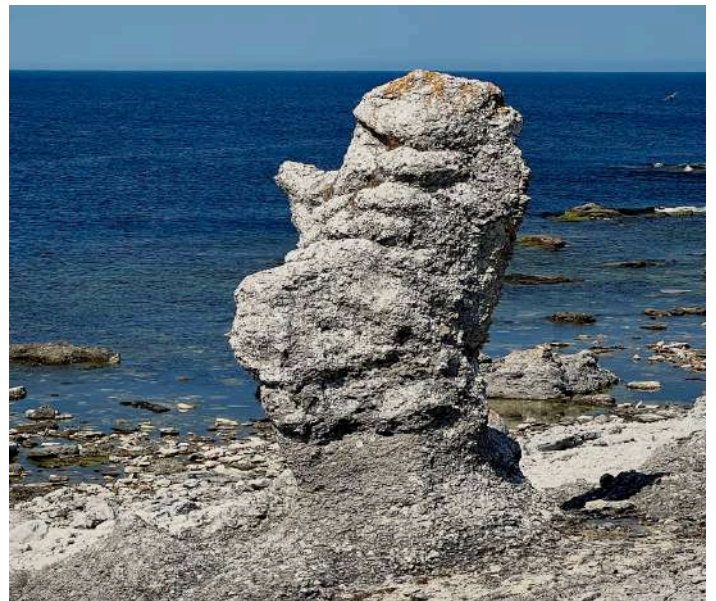
Hoburgsgubben vid Burgsvik