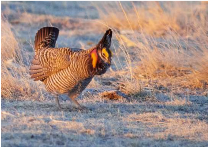
Greater Prairie Chicken