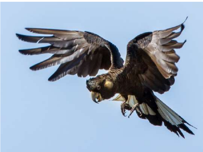
Carnaby's Black Cockatoo

17 november. Tidig frukost och sedan kör vi en dryg halvtimme till Dryandra State Forest där vi tillbringar hela dagen, med sen återkomst till hotellet kring 11 på kvällen. På sena eftermiddagen och kvällen går vi omkring i en del av parken där man arbetar med återinplanteringsprojekt av hotade däggdjur och stupar sedan i säng i vårt boende i Narrogin fulla av intryck.