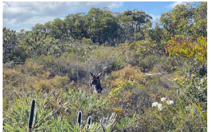
Western Grey Kangaroo