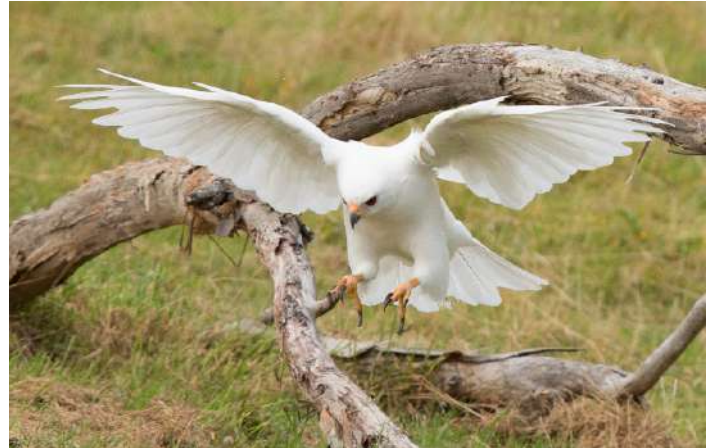
Grey Goshawk (vit morf)

27 november. Hemresedag, eller för de som vill, flygtur till Southwest Wilderness för Orange-bellied Parrot, och återkomst till Hobart på kvällen med avresedag dagen efter.