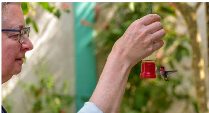
Världens minsta kolibri: Bee Hummingbird.

Fulltankade åkte vi sista biten till vårt boende i Vināles. Vid några fiskdammar längs vägen flög flera Snail Kite.