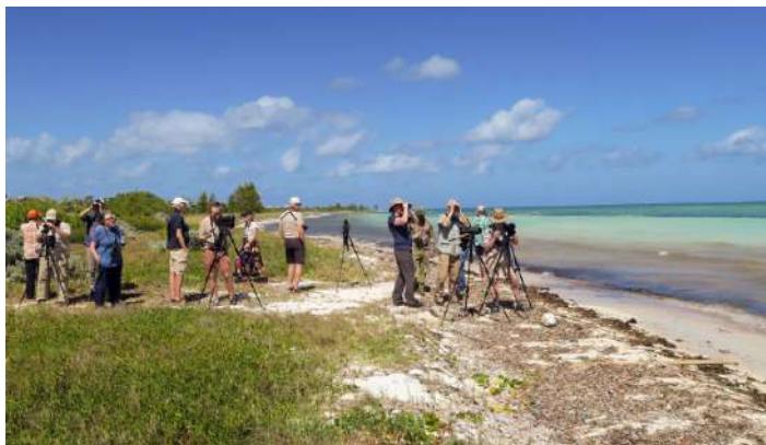
Vid Cayo Coco.

Efter en omväg till Panama landade vi på flygplatsen i Havana strax före midnatt. Alla kontroller gick ovanligt snabbt så vi kom till vårt hotell vid ett. Det var skönt att lägga sig i en sval säng med rena lakan.