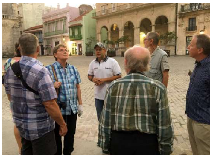
Stadsvandring i Old Havana