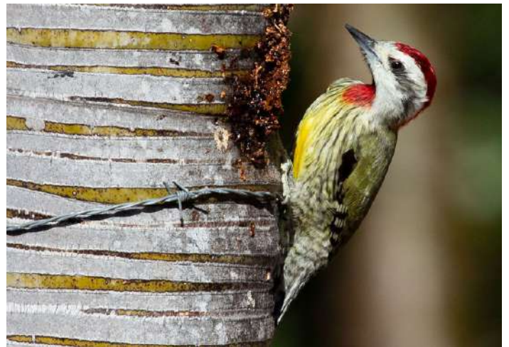
Cuban Green Woodpecker