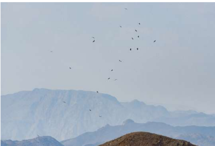
Svart stork.

Morgonen på norra stranden med frukost och skådning. Ingen överdriven aktivitet men en revhäger och en flock på ca 50 årtor var kul samt några vitögda måsar. När vi såg att det rörde sig lite rovfåglar åkte vi upp i bergen för rovis-skådning. Visst sträck av stäppvråkar och enstaka stäppörnar men roligast var en flock på 63 svarta storkar. Efter lunch gjorde vi ett försök på södra stranden efter bergsparv men den såg vi inte. Inte gick det bättre med de strimmiga flyghönsen i Holland Park men här fick vi fina obsar på en hane rostsparv. Vi avslutade vid km 19 och dammen där. Mycket simänder men också några granna tamarisksparvar. En gammal och en ung större skrikörn visade sig också fint. Trevlig dag med flera besökta lokaler runt Eilat.