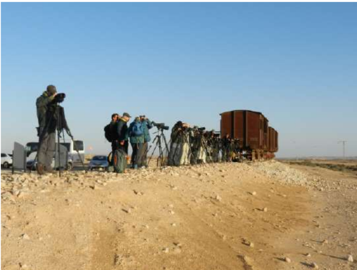
På spaning efter kragtrapp vid Nitzana.

Avfärd redan kl 03.30 mot Nitzana. Noam Weiss och Nicolas från Tyskland gjorde oss sällskap. Vi anlände på slaget 06.00 och det var redan mycket folk runt gömslet. Vi fick fina obsar på två spelande hanar kragtrapp. Även ökenlöpare sågs. En bit längre fram tog vi frukost i en spännande dunge. Första masktörnskatan sågs här. På vägen tillbaka sågs minervauggla av lilith -rasen. I närheten av Ashalim gick vi i jordbruksmarker och såg en fin flock på ca 25 tjockfötter. En skatgök som inspekterade ett kråkbo var också kul. Sedan vidare till Sde Boker där vi tittade på gås- och smutsgamar och fick även se en hökörn innan vi intog vår packade lunch här vid Ben Gurion Memorial park.