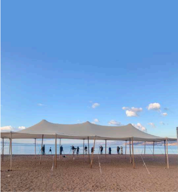
Norra stranden, Eilat.