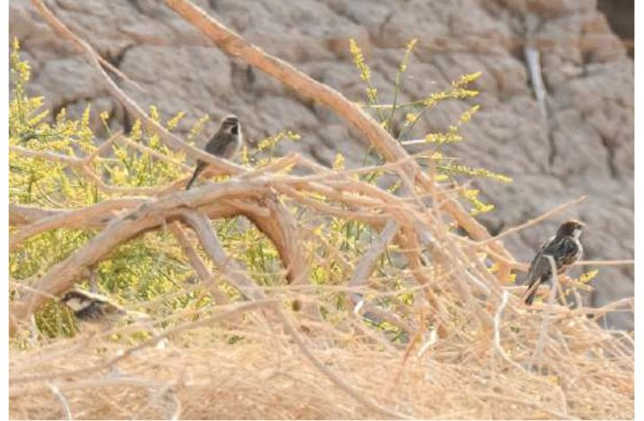
Tamarisksparv och spansk sparv.