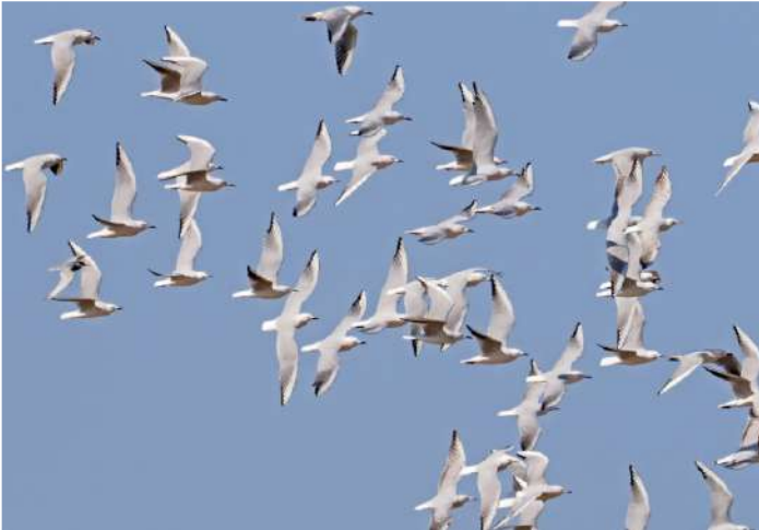
Långnäbbad mås.