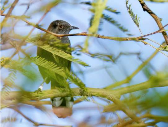
Svart trädäktergal.