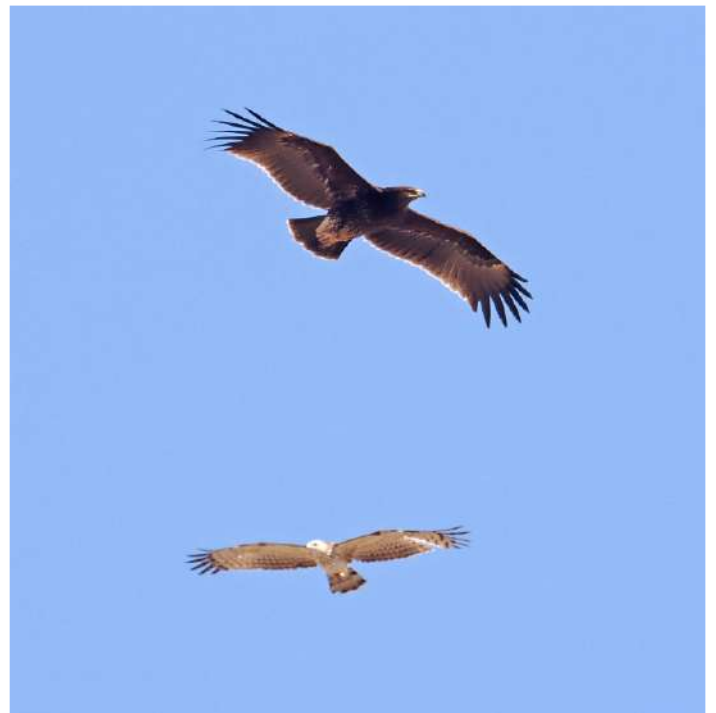
Större skrikörn och tofsbivråk.

Vid saltdammarna vid km 20 hade vi fint sträck av stäppörn rakt över oss under eftermiddagen. Vi kom dock hit för att jobba på svart trädnäktergal. Efter ett litet tag fick några ett par snabba glimtar. Vid gjorde ett annat försök vid km 42 i kanten av en dadelpalmsodling och där gick det bättre så alla fick se en. Många bruna glador som jagade insekter och åt dem på lärkfalksmanér.