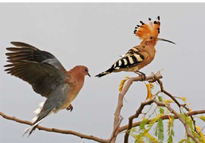
Palmduva och härfågel.