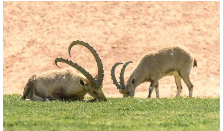
Nubisk stenbock.

Vi kom tillbaka till lodgen vid femtiden efter en lång dag i fält.