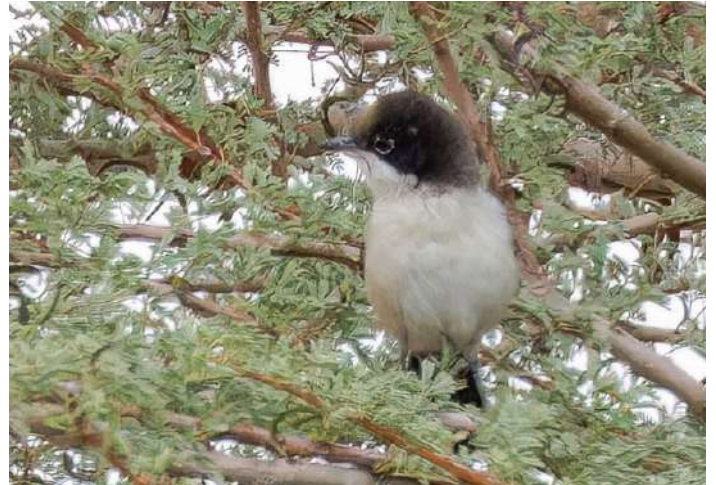
Arabsångare.