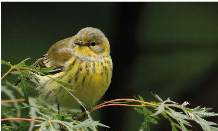
Cape May Warbler.