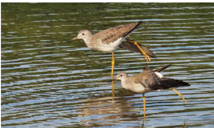
Större och mindre gulbena.