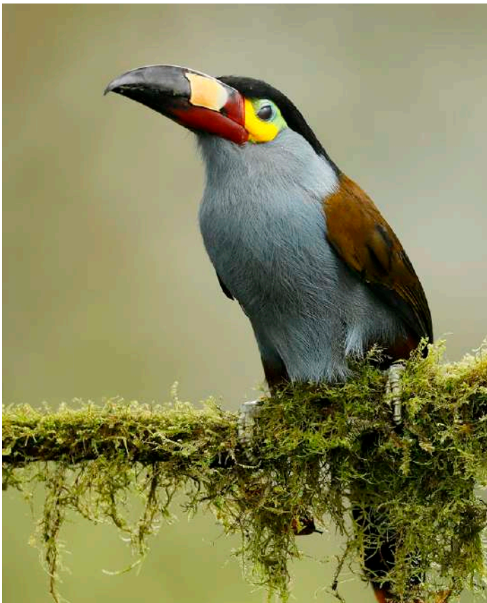
Plate-billed Mountain Toucan

28 oktober. Vi bordar vår yacht Anahi kring lunchtid och installerar oss och påbörjar vår kryssningsdel.